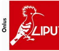
LIPU, Lega Italiana Protezione Uccelli http://www.lipu.it