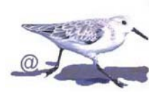
EBN Italia http://www.ebnitalia.it