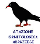
SOA, Stazione Ornitologica Abruzzese http://www.soabruzzo.it