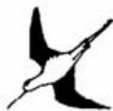
Stazione Romana per l'Osservazione e la Protezione degli Uccelli http://www.sropu.it