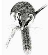
As.Fa.Ve, Associazione Faunisti Veneti http://www.faunistiveneti.it