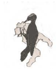
Associazione Studi Ornitologici Italia Meridionale http://www.asoim.org