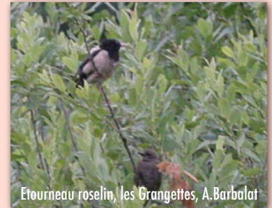
Etourneau roselin, les Grangettes, A. Barbalat

Au cœur de l'été, alors que l'actualité ornithologique était plutôt calme, un magnifique Etourneau roselin en plumage adulte a pu être observé aux Grangettes entre le 11 et le 25 juillet. Accompagnant une grande bande d'Etourneaux, il était facilement repérable lorsque toute la bande prenait son envol dans un bruissement d'ailes. Son corps rose saumon contrastant alors fortement avec le plumage sombre de ses cousins sansonnets.