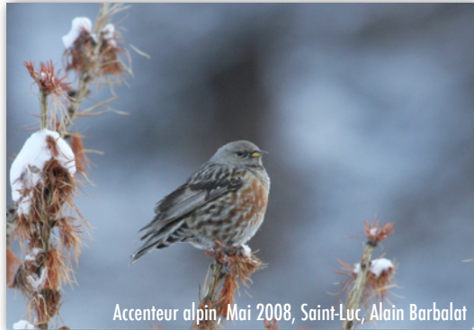
Accenteur alpin, Mai 2008, Saint-Luc, Alain Barbalat

Les quelque 310 données récoltées au cours de ces 5 dernières années entre le 15 mai et le 31 juillet sur ornitho.ch indiquent une altitude moyenne de 2500 m, avec des extrêmes jusqu'à 3750 m et seulement 5 observations en dessous de 1500 m. Sa répartition se calcule évidemment sur le relief alpin avec une présence continue dans les Alpes et les Préalpes. Les données jurassiennes sont exceptionnelles.