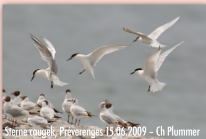
Sterne caugek, Préverenges 15.06.2009

Le printemps 2009 aura été riche en événements pour les amateurs de Sternes. Si la Sterne pierregarin, fidèle à son habitude est revenue sur nos lacs et cours d'eau dès le 28 mars à Préverenges, pas moins de 6 autres espèces ont été observées ce printemps. La palme de la rareté revient à une Sterne voyageuse observée le 13 mai aux Grangettes. Il s'agit là de la cinquième observation suisse pour