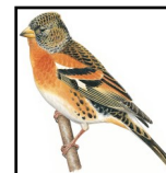
Pinson du Nord