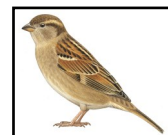
Moineau domestique femelle

La confusion avec le Pinson du Nord peut être levée en observant le croupion, qui est blanc chez ce dernier. Enfin, une confusion avec le Bouvreuil pivoine peut exister, mais ce dernier présente une calotte noire et un bec très épais également noir.