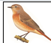
Rougequeue à front blanc (femelle)

Pour le mâle la confusion est possible avec la Sittelle torchepot au niveau des couleurs (gris, noir, poitrine chamois). Pour la femelle, c'est avec la femelle du Rougequeue à front blanc ou la femelle du Tarier pâtre qu'il peut y avoir confusion en raison des couleurs (dos gris-brun et ventre chamois).