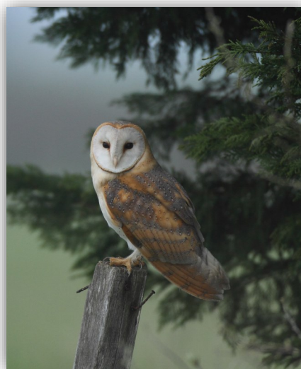
Mâle ou Femelle

Mâles, femelle et juvéniles sont semblables . Les individus des pays du nord sont roussâtre sur le dessous. Les juvéniles de quelques semaines sont reconnaissables au reste de duvet pâle qu'ils portent sur la tête.