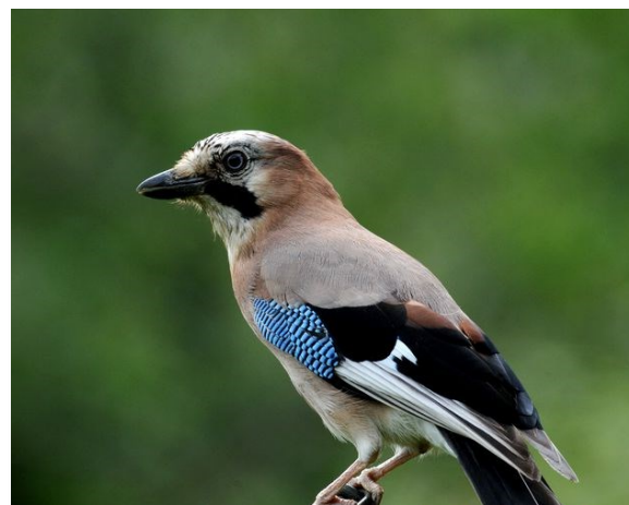
Mâle ou femelle

Mâles, femelles et jeunes ont un plumage identique .