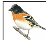
Pinson du Nord (plumage nuptial)