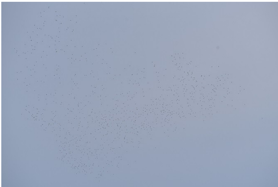
Pigeons ramiers en migration, Spoy.

Effectifs record en Côte-d'Or pour 107 espèces d'oiseaux