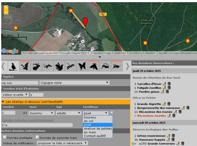
Figure 3 : localisation précise, information sur l'âge et sur le comportement, tout y est !

Pour en savoir plus sur la Cigogne noire, c'est ici .