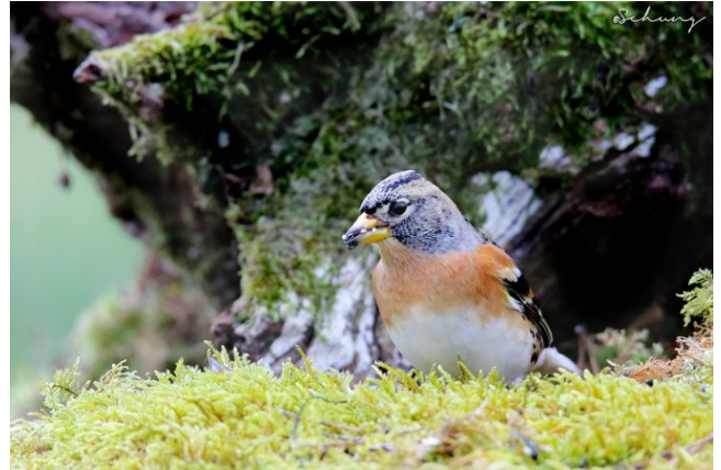
Pinson du Nord (S. Baschung)

Avec déjà 49 observations de Pinson du Nord depuis le 5 octobre en Côte-d'Or, l'hiver 2015-16 s'annonce très bon pour ce fringille, qui n'avait été contacté durant tout l'hiver précédent qu'à 43 reprises !