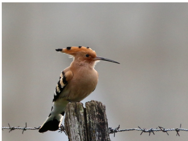
Huppe fasciée (S.Desbrosses)

(H.Gauche), encore un record de date (précédent le 3 avril 2005)