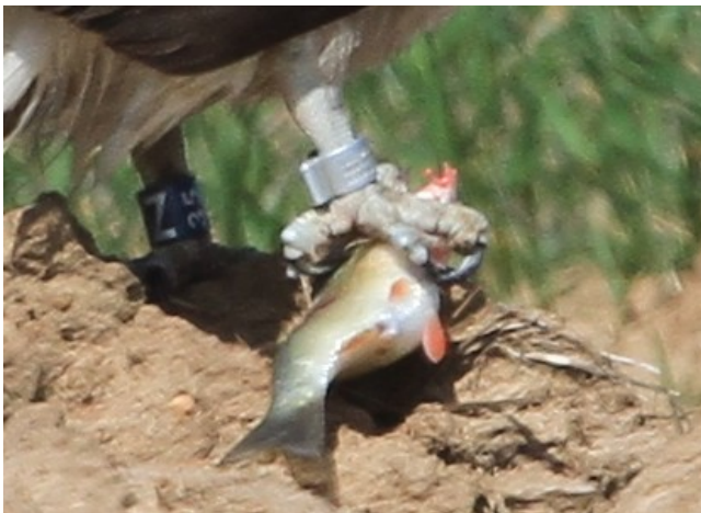
Balbuzard pêcheur allemand