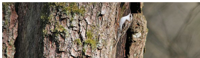
Grimpereau des bois

Pour toutes les communes le déroulement du programme est le même, avec des présentations en salle réalisées en début et fin de programme et des sorties nature durant la belle saison. N'hésitez pas à y participer, toutes les dates sont sur l'agenda de la LPO.