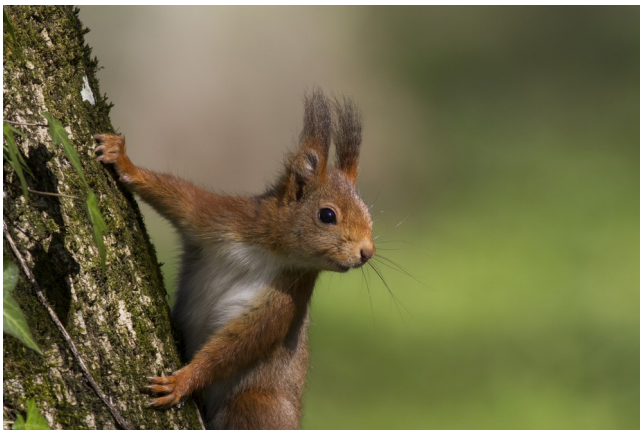
Écureuil roux (S.Baschung)

Noisette et cône de conifère mangés par un écureuil. Les noisettes sont cassées en deux parties souvent égales, tandis que les cônes sont arrachés à leur base et rongés de manière grossière, contrairement à ceux grignotés par d'autres rongeurs comme les mulots (SP.Babski)