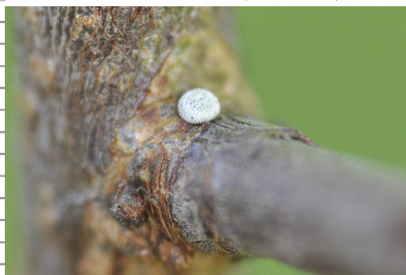
Oeuf de Thècle du bouleau (F. Conort)