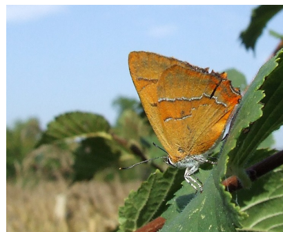
Thecle du bouleau (N. Conort)