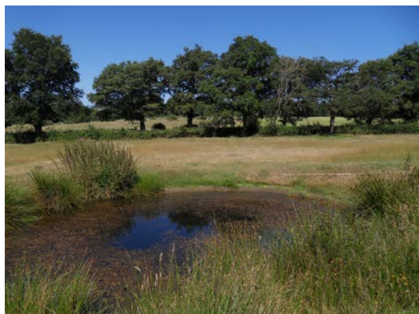
▲ Mare de prairie

Une meilleure connaissance de la répartition régionale des espèces et l'ensemble des travaux spécifiques menés en Poitou-Charentes permettent aujourd'hui d'apprécier le statut des différents taxons et de les confronter à la méthodologie UICN pour évaluer leur degré de menace.