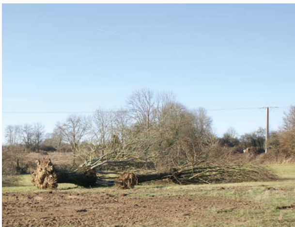
▲ L'intensification de l'agriculture est à l'origine de la destruction de nombreux habitats pour les Reptiles et les Amphibiens. Ici, arrachage d'un réseau de haies en Deux-Sèvres.

Les Amphibiens et les Reptiles sont des organismes ectothermes et sont donc très dépendants de la qualité thermique et hydrique des habitats et micro-habitats. Les Amphibiens ont de plus un cycle de vie bimodal, au cours duquel ils utilisent des habitats terrestres et aquatiques. Ils sont donc particulièrement sensibles à l'agencement paysager des milieux et à différents agents d'agressions, tels que les pollutions agricoles (nitrates, pesticides). Les Amphibiens et Reptiles ont également des capacités de déplacement et de dispersion limitées (généralement inférieures à 1 Km), qui amplifient les effets de la fragmentation et de la dégradation des milieux.