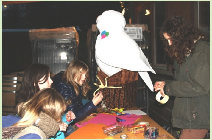
habillage de la chouette géante

(voir aussi : http://www.gobg.ch/index.php?m_id=21&a=N24#FN24 )