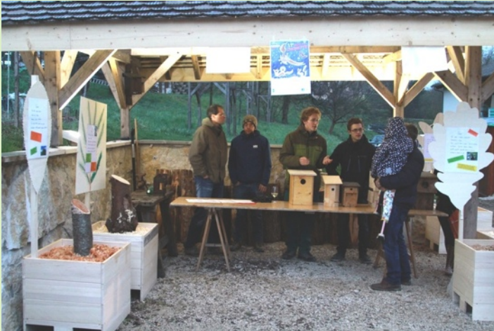
présentation de nichoirs

Cette année, la Nuit de la Chouette a pris ses quartiers à Dardagny dans le domaine du viticulteur Stéphane Gros. Plus de 120 personnes ont finalement participé à cette manifestation malgré une météo peu favorable. Dès 18h, plusieurs activités étaient proposées : excursions nocturnes, film de Christian Fosserat sur la chevêche, présentation de nichoirs et, pour les enfants, la confection de plumes en papier pour « habiller » une chouette géante (photo).