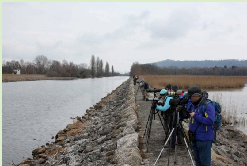
Chablais de Cudrefin - 22 février 2015