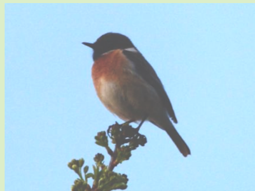
Marais de Sionnet - 12 avril 2015 Tarier pâtre - (A.Stubbe)