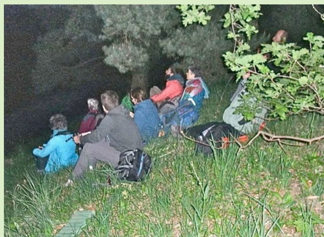
Eveil des oiseaux - 25 et 26 avril 2015