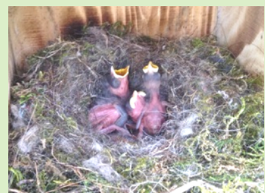
Parc de Loëx et ses nichées