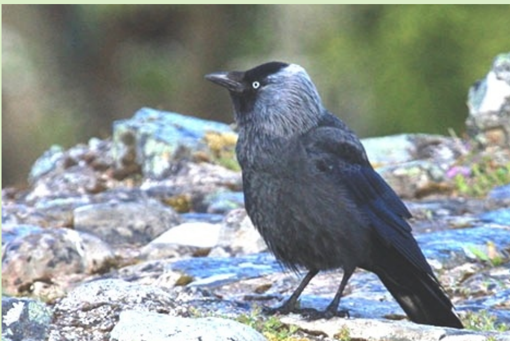
Choucas des tours

Après la pose de 10 nichoirs en 2014 à Belle-Idée, le GOBG poursuit en 2015 la prospection et la pose de nichoirs pour cette espèce dont les lieux de nidification à Genève restent peu nombreux et surtout méconnus.