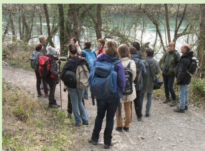
Teppes de Véré - 11 avril 2015