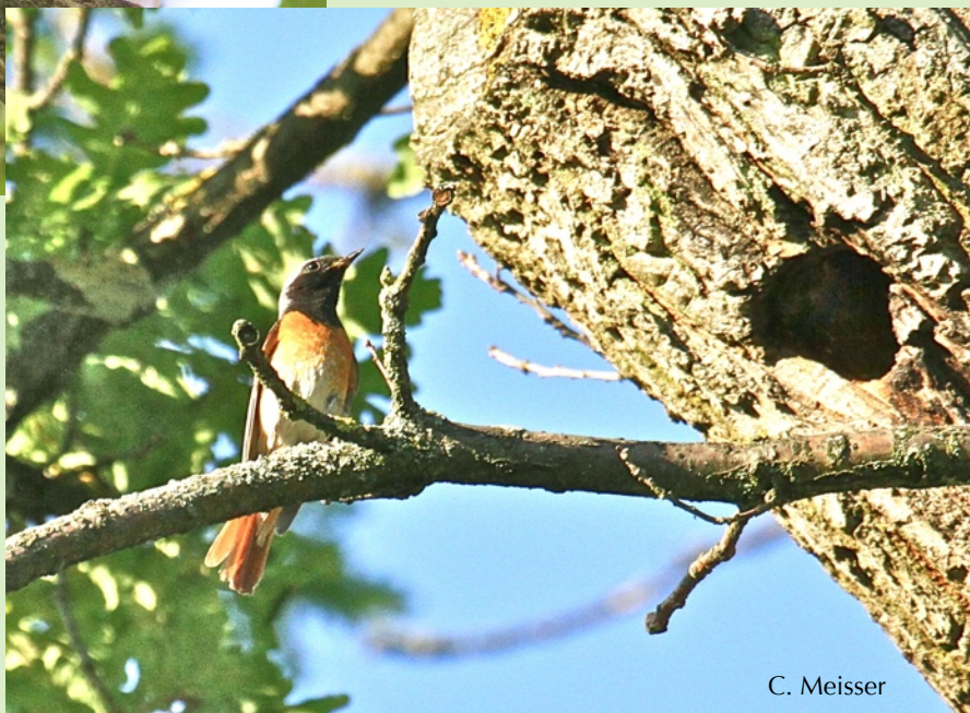
Rougequeue à front blanc devant la cavité d'un chêne qu'il a choisie pour nicher. Juin 2016