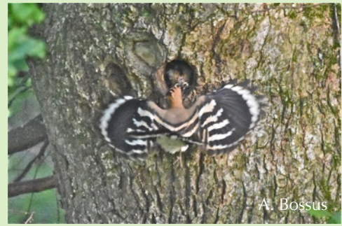
Huppe fasciée nichant dans une cavité d'un vieux chêne. juin 2016