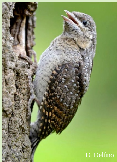
Torcol fourmilier nichant dans une cavité d'un poirier juin 2014