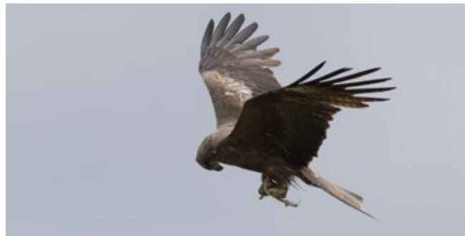
Un milan figé par Michel Jaussi

Nous nous rendrons à Hucel, au dessus de Thollon-les-Mémises, pour observer le passage des buses, milans, éperviers et autres rapaces. Avec un peu de chance, nous pourrions aussi observer l'aigle royal. Prévoir jumelles, longue-vue et habits selon la météo. Déplacement en voiture. Petite marche sur sentier escarpé.