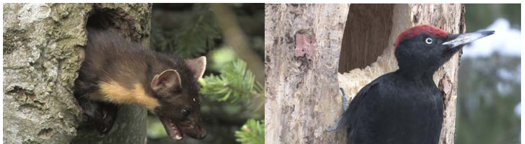
Une martre et un pic noir, images extraites du film «Premières Loges»

La conférence du mois au Muséum d'histoire naturelle