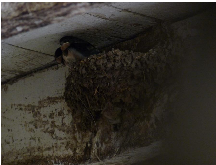
Fig. 6 - Le nid occupé dans l'écurie inférieure et son support (30/08/2014, 20h)

Ce local est une petite écurie en bas de la cour principale, assez basse (hauteur sous poutres - 2,5 m) accueillant 5 chevaux ; un nid situé dans le box au fond de cette écurie est occupé. Un autre proche de l'entrée, antérieurement utilisé ne l'a pas été cette année ; plusieurs ouvertures (porte, fenêtres) donnent accès à cette écurie et sont empruntées régulièrement par les hirondelles.