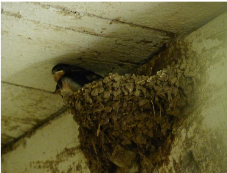
Fig. 11 - Ecurie inférieure (30/08/2014, 20h)

Les derniers jeunes de l'année 2014, nés dans l'écurie dite « inférieure » ne se sont envolés définitivement pour leur migration que le 10 septembre alors que leurs aînés et même leurs parents avaient déjà quitté les lieux ; ci-dessous une photo d'un de ces attardés prise le 9 septembre.