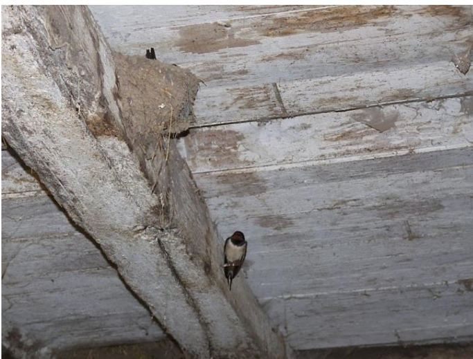
Fig. 7 - Ecurie supérieure (06/05/2014, 190h30)

Les photos ci-après illustrent cette période d'élevage assez intense.