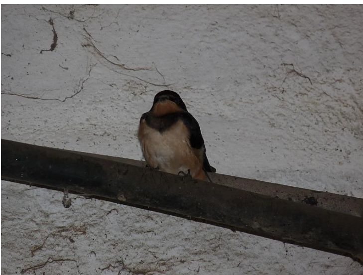
Fig. 12 - Un des deux derniers jeunes - Ecurie inférieure (09/09/2014, 19h30)

Les derniers jeunes de l'année 2014, nés dans l'écurie dite « inférieure » ne se sont envolés définitivement pour leur migration que le 10 septembre alors que leurs aînés et même leurs parents avaient déjà quitté les lieux ; ci-dessous une photo d'un de ces attardés prise le 9 septembre.