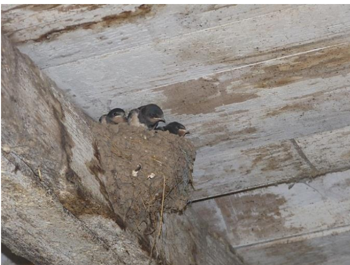
Fig. 8 - Ecurie supérieure (30/08/2014, 20h)