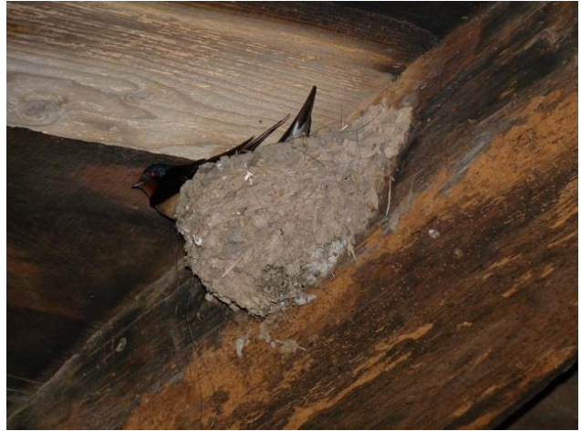
Fig. 10 - local intermédiaire (06/05/2014, 19h30)