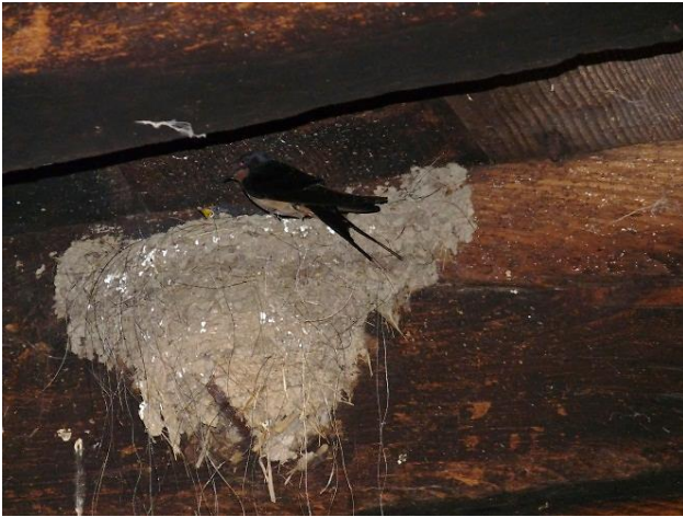
Fig. 9 - local intermédiaire (01/06/2014, 8h30)