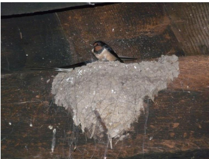
Fig. 4 - Remise intermédiaire - un nid et son support (24/05/2014)