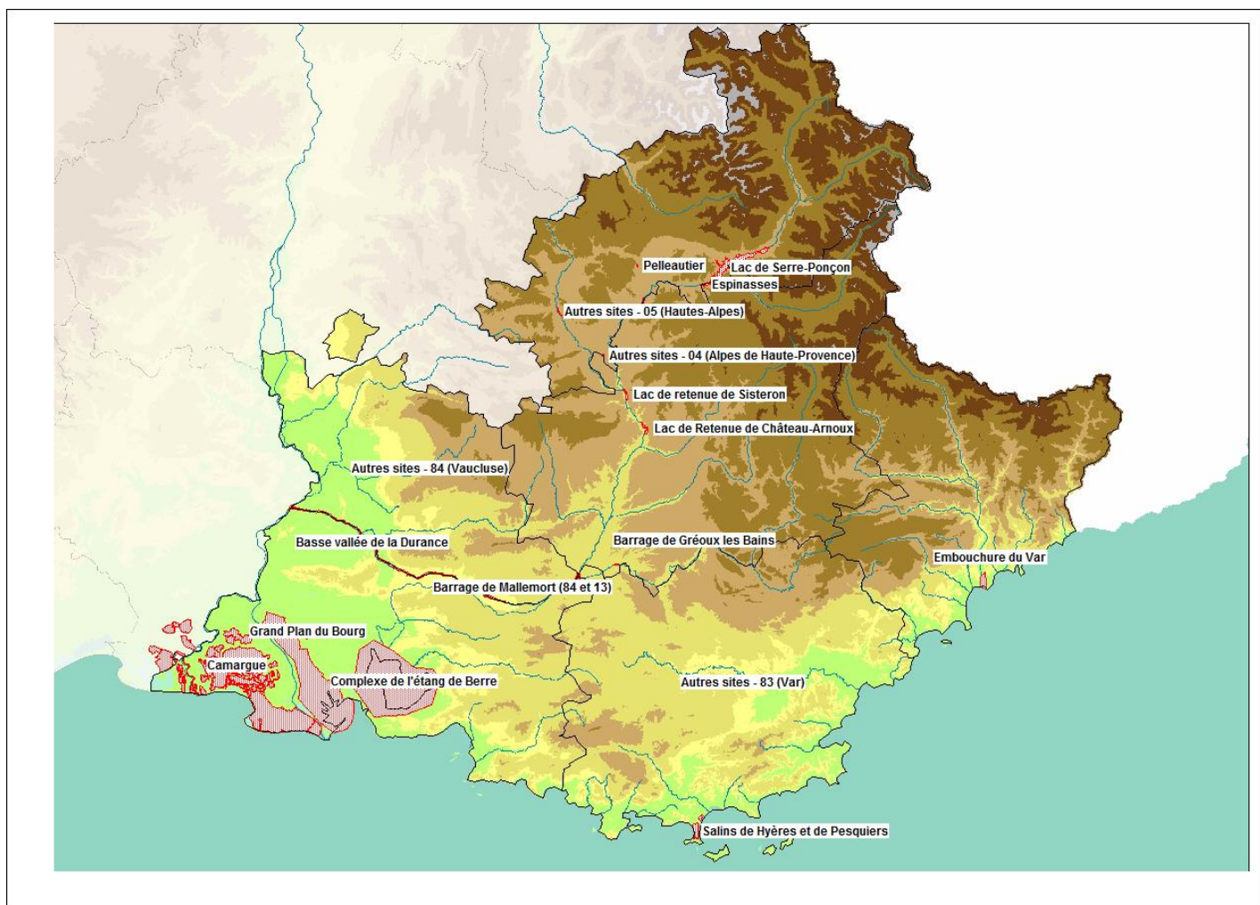
Figure 1 : Carte de localisation des principaux sites comptés.