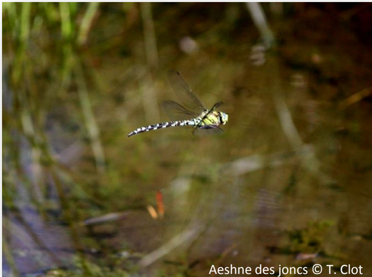
Aeshne des joncs