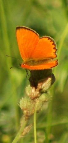
Cuivré satiné