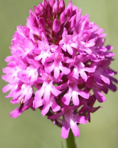
Anacamptis pyramidalis