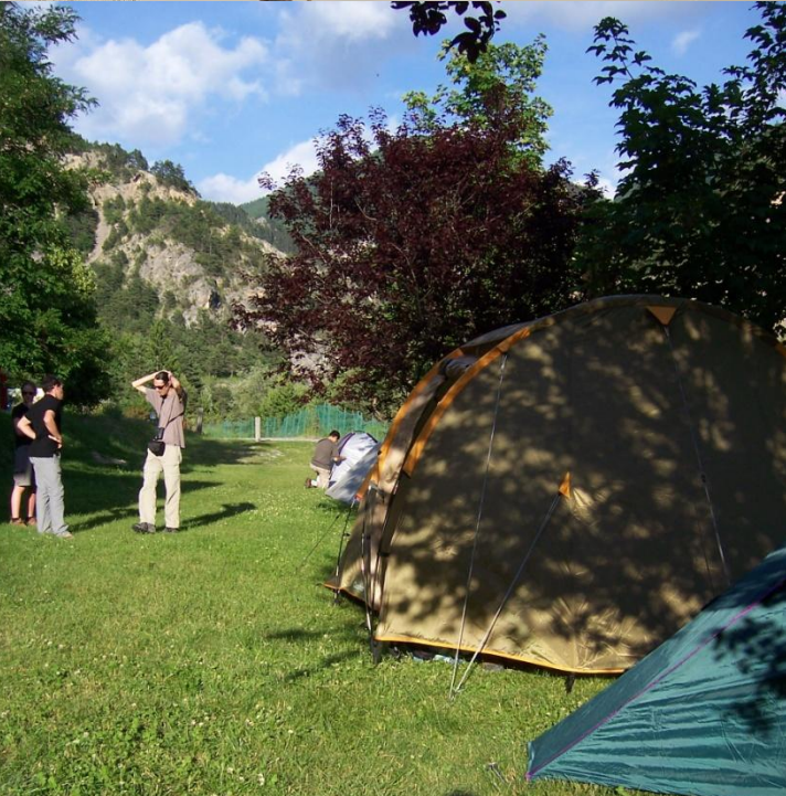
Camping Péone