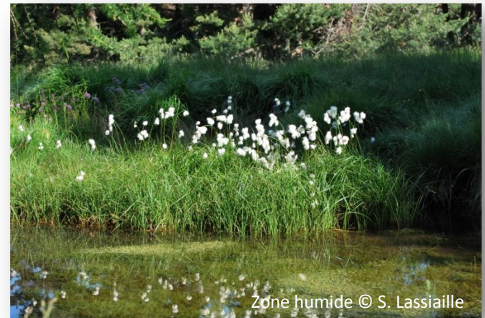
Zone humide