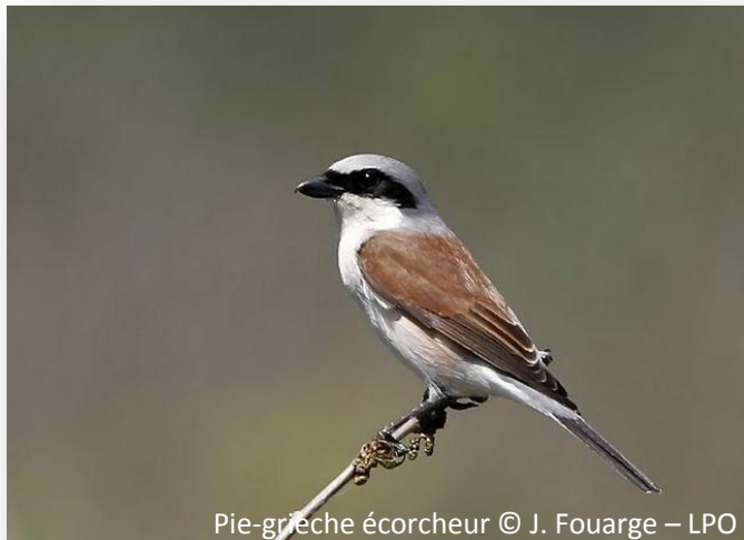
Pie-grièche écorcheur