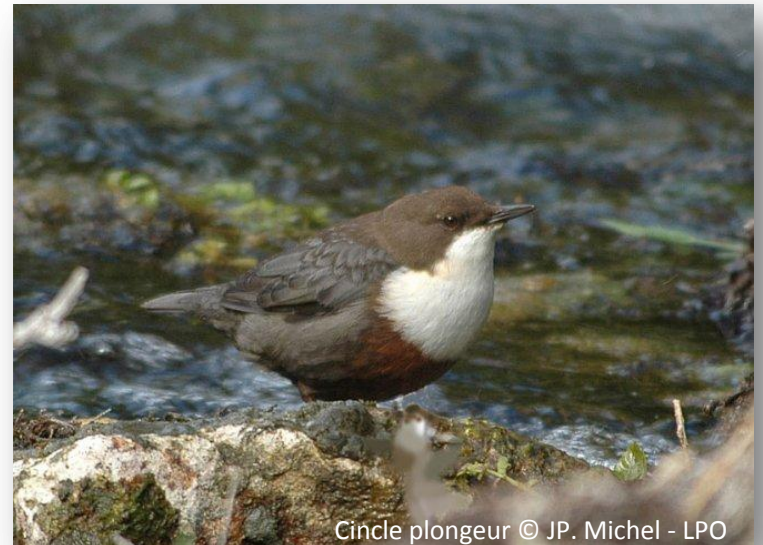
Cincla plongeur