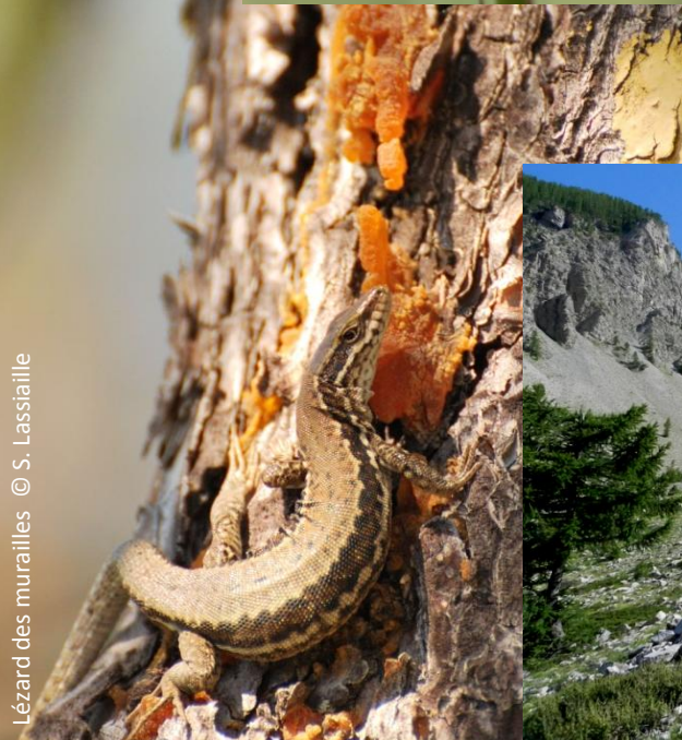
Lézard des murailles