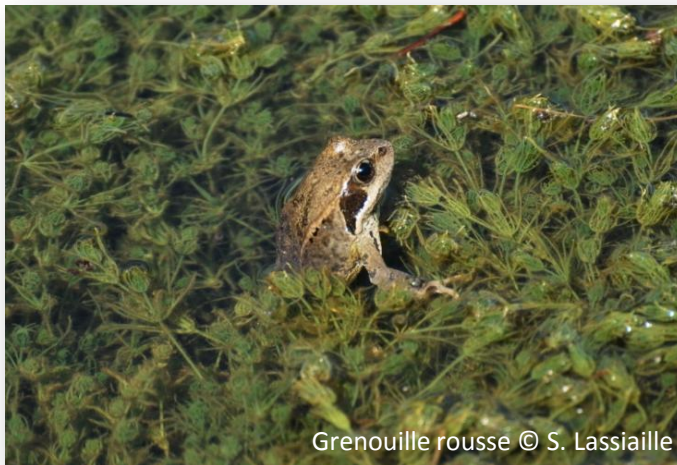
Grenouille rousse