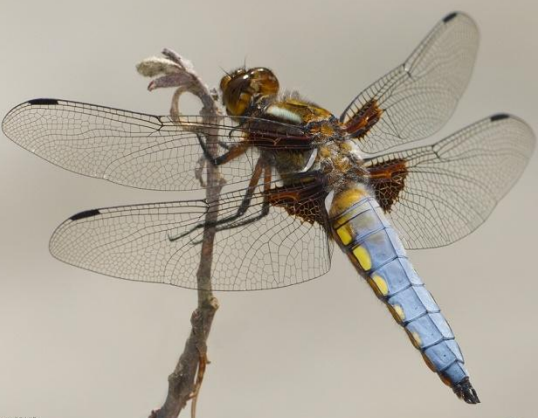
Libellule déprimée