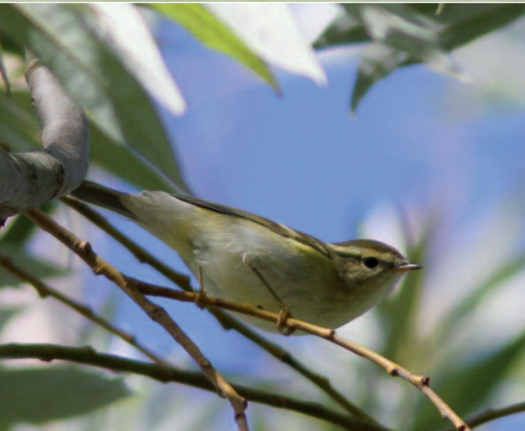
POUILLOT À GRANDS SOURCILS - SPOYS (21) - 14 OCTOBRE 2014 (GEORGES BEDRINES).

Spoys (21) : 1 individu le 14 octobre 2014 (G. Bedrines)