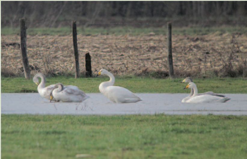
CYGNE CHANTEUR - SAUNIÈRES (71) - 18 JANVIER 2014.