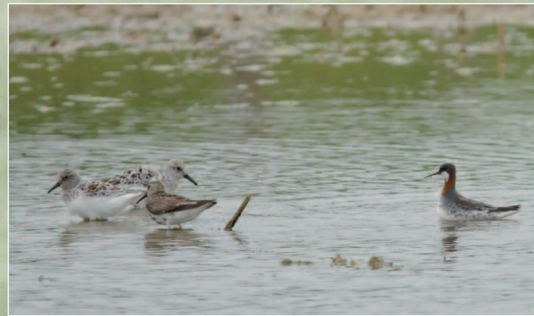
PHALAROPE À BEC ÉTROIT - VERDUN-SUR-LE-DOUBS (71) - 12 MAI 2013 (ALEXIS RÉVILLON).

Les printemps humides de 2012 et 2013 fournissent pas moins de 6 données. L'observation d'un groupe de 7 individus en Saône-et-Loire est exceptionnelle pour la région.