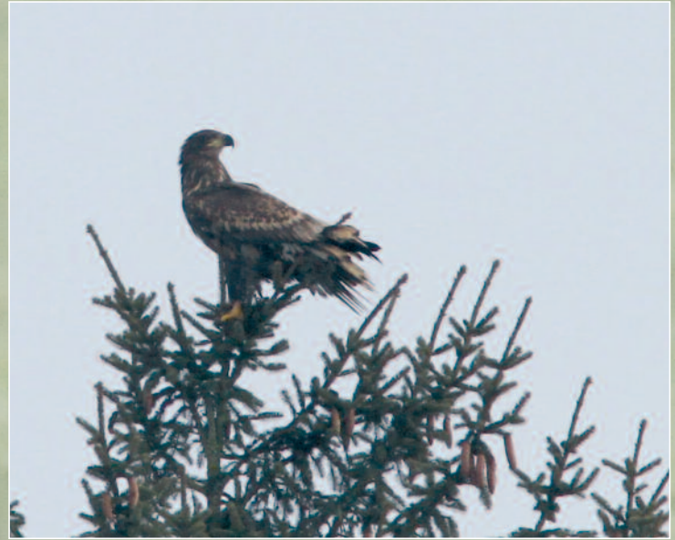
PYGARGUE À QUEUE BLANCHE - FONTAINE-FRANÇAISE (21) - 20 JANVIER 2013.

Une nouvelle donnée d'un immature en fin de printemps pour cette espèce très occasionnelle dans la région.