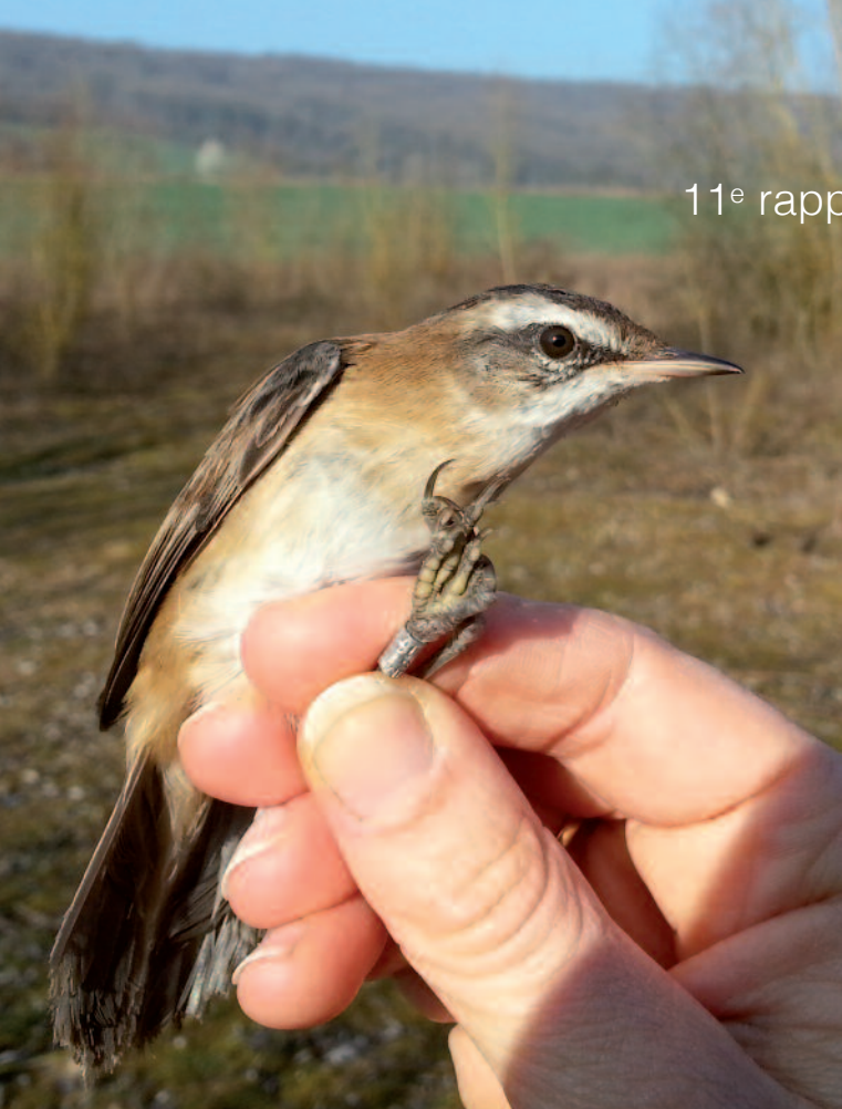
LUSCINIOLÈ À MOUSTACHES - SAINT-JULIEN-DU-SAULT (89) - 10 MARS 2014 (FRANÇOIS BOUZENDORF).

Saint-Julien-du-Sault (89) : 1 individu du 9 au 15 mars 2014 (J.-M. Guilpain, F. Bouzendorf et al.)