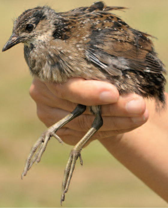
MARQUETTE PONCTUÉE - SAINT-MAURICE-EN-RIVIÈRE (71) - 15 JUILLET 2013.

Ouroux-sur-Saône (71) : 1 individu de 1 re année du 6 au 25 août 2013 (P. Gayet)