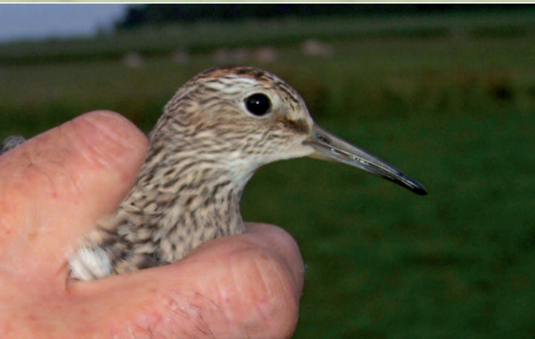
BÉCASSEAU TACHETÉ - SAINT-AUBIN-EN-CHAROLLAIS (71) 6 SEPTEMBRE 2012 (ANTHONY MORLET).

Rouvres-en-Plaine (21) : 1 individu du 24 au 26 avril 2014 (G. Bedrines et al.)