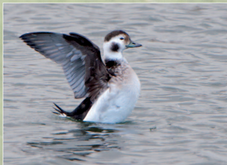
HARELDE BORÉALE -GURGY (89) - 10 DÉCEMBRE 2012 (JEAN-PAUL LEAU).

Villemanoche (89) : 2 mâles et 2 femelles le 19 novembre 2014 (F. Bouzendorf)