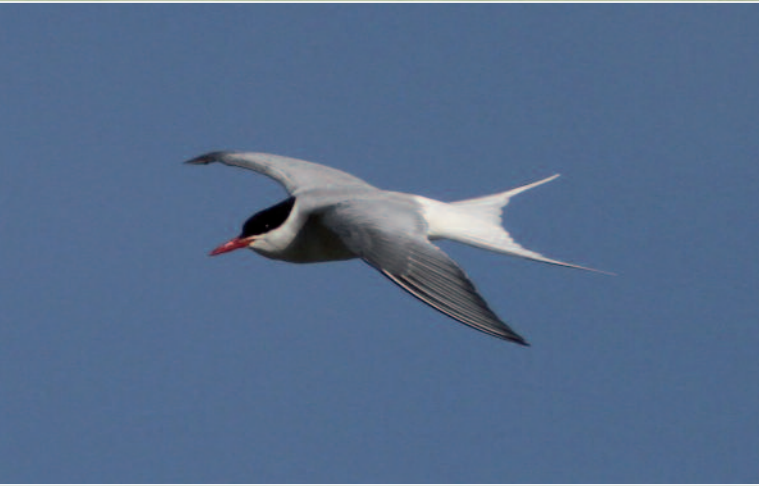
STERNE ARCTIQUE - DIJON (21) - 16 MAI 2014.

Dijon (21) : 1 adulte du 16 au 18 mai 2014 (A. Rougeron, C. Lanaud, P. Lacroix et al.)