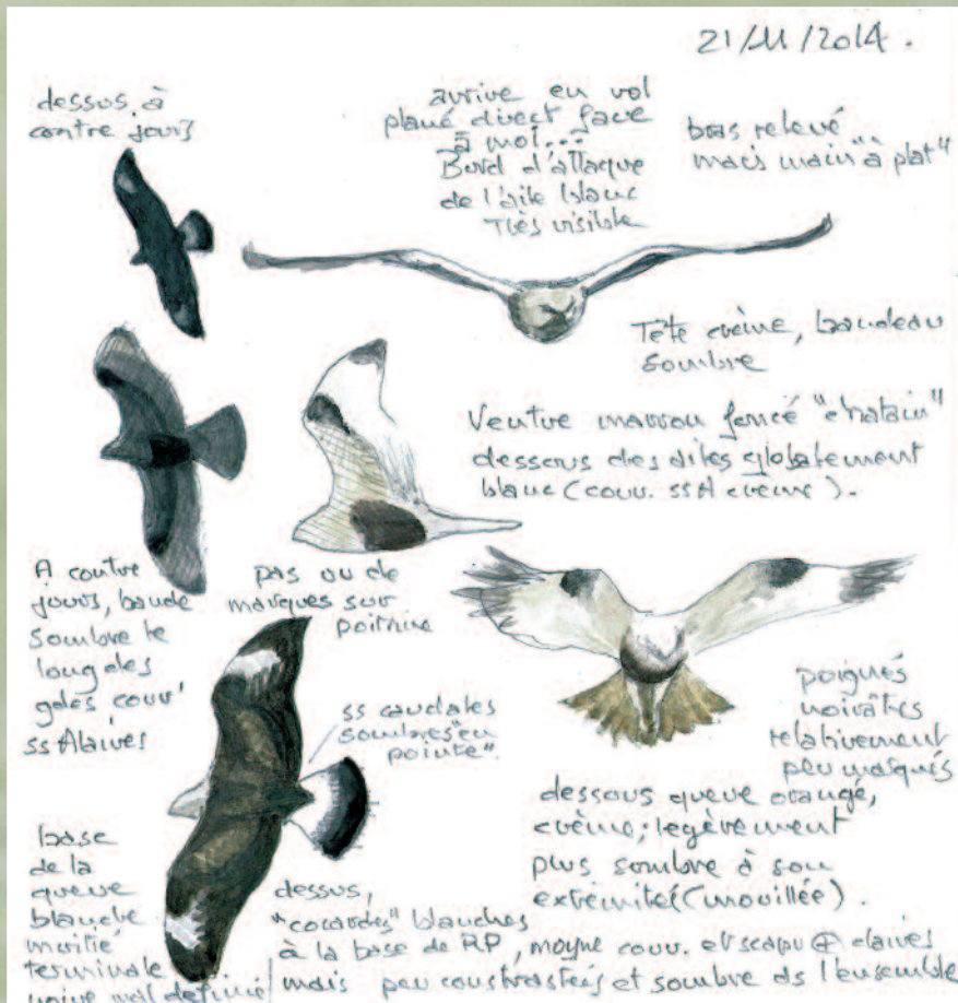
BUSE PATTUE - LAYS-SUR-LE-DOUBS (71) - 21 NOVEMBRE 2014.

Première homologation de cette espèce, observée principalement en période de migration dans la région. Il s'agit ici d'un migrateur tardif plutôt que d'un hivernant.