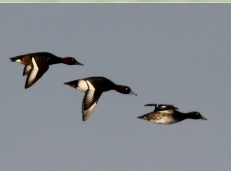
FULIGULE NYROCA - ARC-SUR-TILLE (21) - 27 NOVEMBRE 2014.

Cette espèce, auparavant annuelle dans la région, semble se raréfier, ne donnant lieu qu'à une seule donnée au cours de la période couverte par ce rapport. Il est probable que cela soit dû à un glissement de l'aire d'hivernage vers le