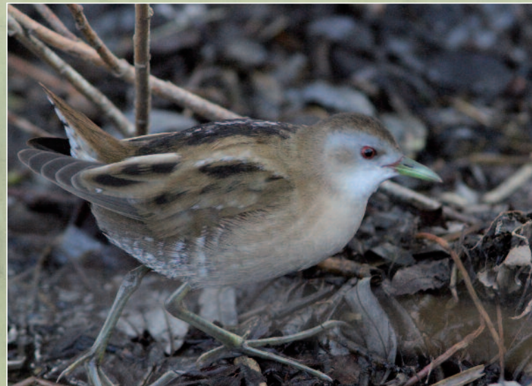
MARQUETTE POUSSIN - ROUVRES-EN-PLAINE (21) - 1 er AVRIL 2014.

Espèce nicheuse en France, mais extrêmement rare. Les données concernent des individus chanteurs sur de grands étangs. Ces données sont irrégulières et très aléatoires (entre 0-5 chanteurs entre 2002 et 2010). Le CHN l'a retirée des espèces soumises à homologation le 1 er janvier 2006.