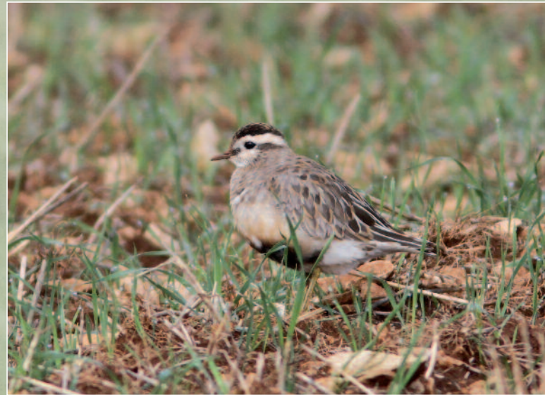
PLUVIER GUIGNARD - PRENOIS (21) - 16 AOÛT 2014.

Une nouvelle donnée de Côte-d'Or pour une espèce très rare en Bourgogne.