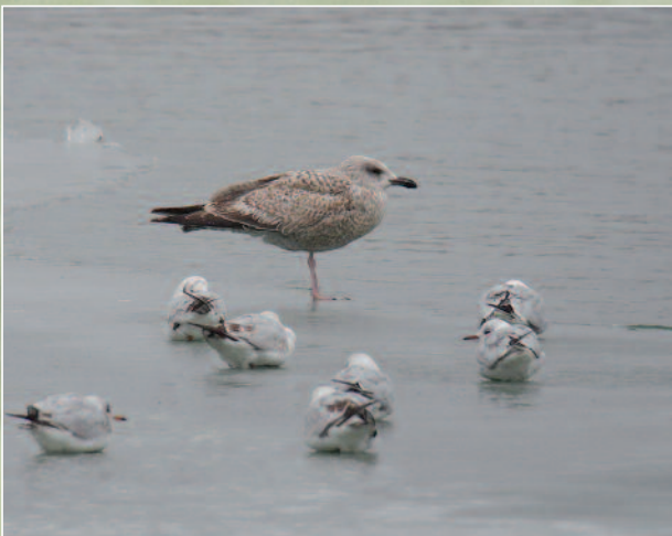
GOÉLAND ARGENTÉ - DIJON (21) - 13 FÉVRIER 2012.

Première donnée homologuée depuis la création du CHR et première mention pour la Nièvre. C'est assurément le labbe le plus rare à l'intérieur des terres.