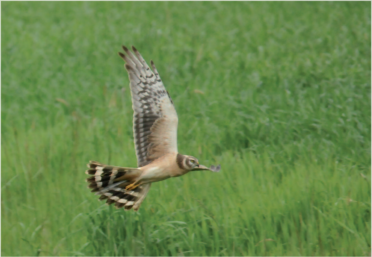
BUZARD PÂLE - SAINT-MAURICE-EN-RIVIÈRE (71) - 8 MAI 2013.