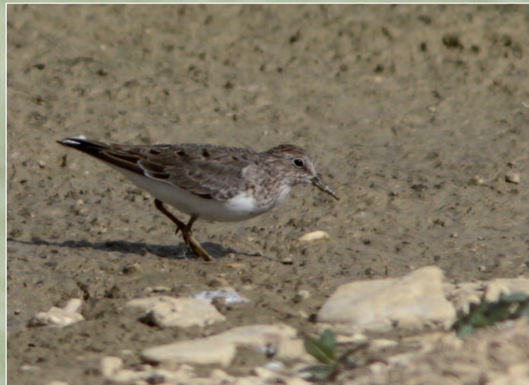
BÉCASSEAU DE TEMMINCK - MARLIENS (21) - 9 MAI 2014.

Trois bonnes années pour cette espèce. L'essentiel des observations est réalisé dans l'Yonne et l'Auxois, ce qui n'est pas surprenant pour cette espèce dont les effectifs se concentrent sur la façade atlantique.