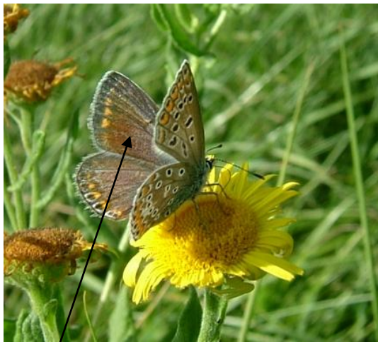
Tache discale peu marquée