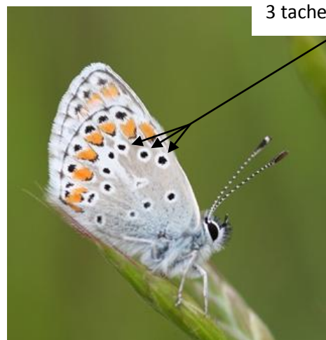
3 taches noires alignées