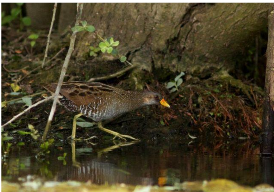
Marouette Ponctué, La Ferté-Bernard, (Sarthe), 10 juin, (Etudiants en BTS GPN de la MFR des Forges).

Huitième donnée en Sarthe pour cette espèce discrète et rare, le plus souvent contactée au passage postnuptial.