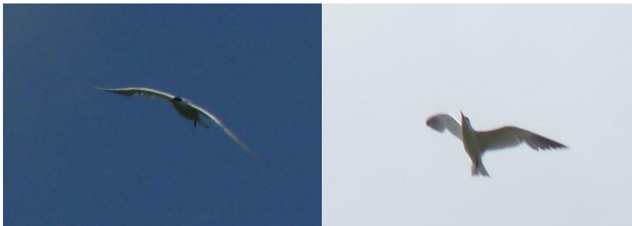
Sterne Caspienne, Bourgon, (Mayenne), 15 août, (F. Duchenne).

Deuxième donnée Sarthoise, la première datant du 15/09/2011, La Ferté-Bernard (F. Jallu).