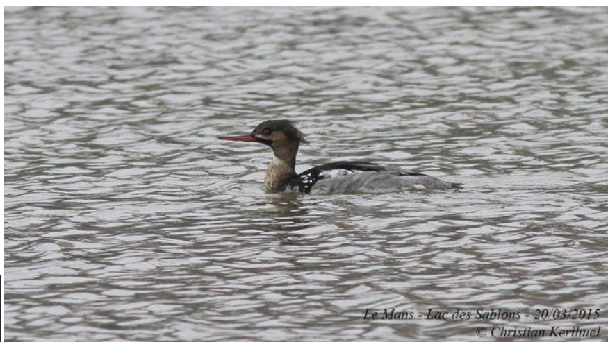
Harle huppé, lac des Sablons, Le Mans (Sarthe), 20 mars

Une nouvelle donnée en Sarthe, pour cette espèce assez rare à l'intérieur des terres. A noter que le lac des Sablons a accueilli les 3 harles ces dernières années : piette en 2012, bièvre en 2014, et donc huppé en 2015.