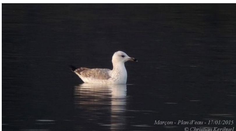
Goéland pontique, Marçon, (Sarthe), 3 ème année, 17 janvier, (C. Kerihuel).

Rappelons que les fiches d'homologation non accompagnées de documents photographique ou vidéo, concernant cette espèce, ne sont pas examinées.