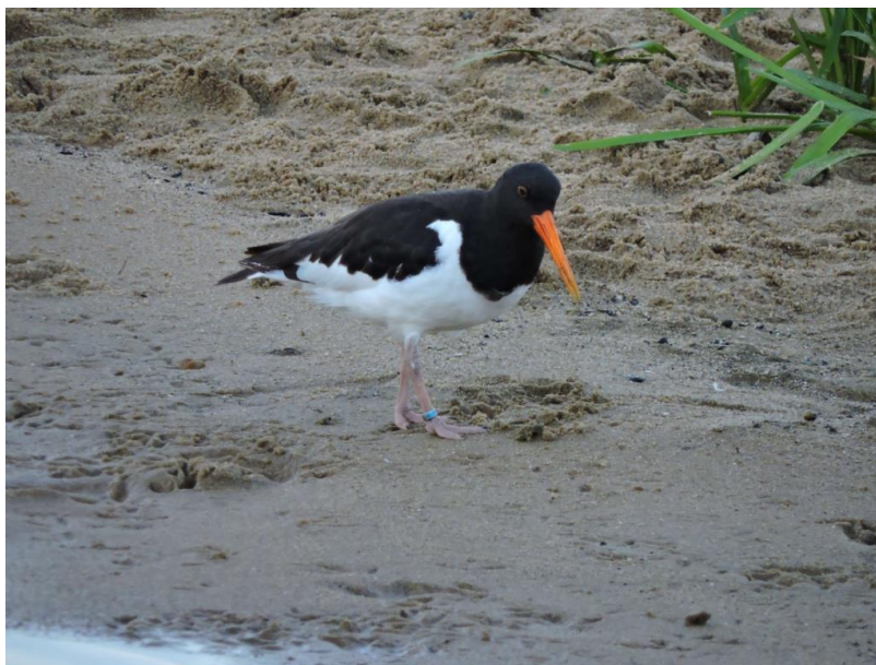
Huitrier-pie, Guécelard (Sarthe), 2 août, (J.J. Démotier).

Une donnée pour cette espèce migratrice qui semble avoir estivé (origine sauvage de l'oiseau douteuse, porteur d'une unique bague couleur ne correspondant pas à un programme européen référencé). La dernière donnée remonte au 27/03/2008 à La Ferté Bernard (Ajeux - F. Jallu). Ce dernier site demeure d'ailleurs le plus fréquenté par l'espèce en Sarthe, avec 4 données au moins depuis 1998 (comm. pers. H. Julliot).