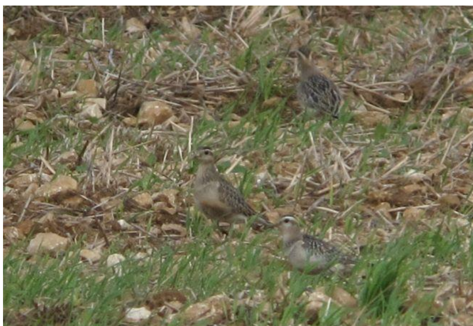
Pluvier guignard, Vezot, (Sarthe), 15 septembre, (S. Cavailès).

Sarthe – Vezot, 4 juvéniles, 15 septembre, phot., (S. Cavailès).