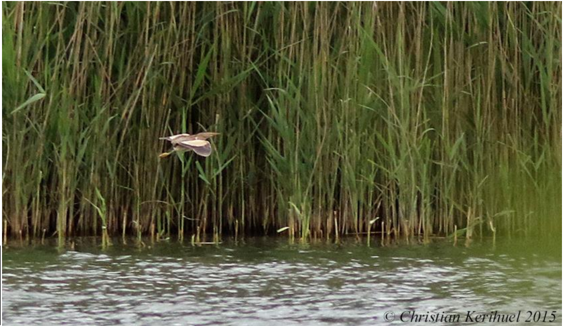
Blongios nain, La Flèche (Sarthe), 31 mai (C. Kerihuel)

Sarthe – La Flèche, de 1 à 4 inds., 2 m., 1 fem. et 1 juv., du 23 mai au 22 juillet, phot., (O. Vannucci, C. et B. Basoge, C. Kerihuel, et al., collectif www.faune-maine.org ).