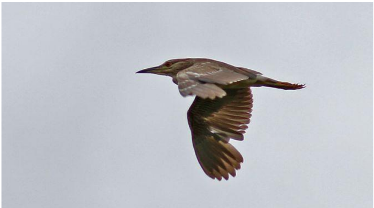
Héron bicolore, La Flèche, (Sarthe), 17 juillet (Br. Duchenne)

Pour mémoire, 1 1 ère année à Aron (Mayenne) le 7 septembre (G. Claes).