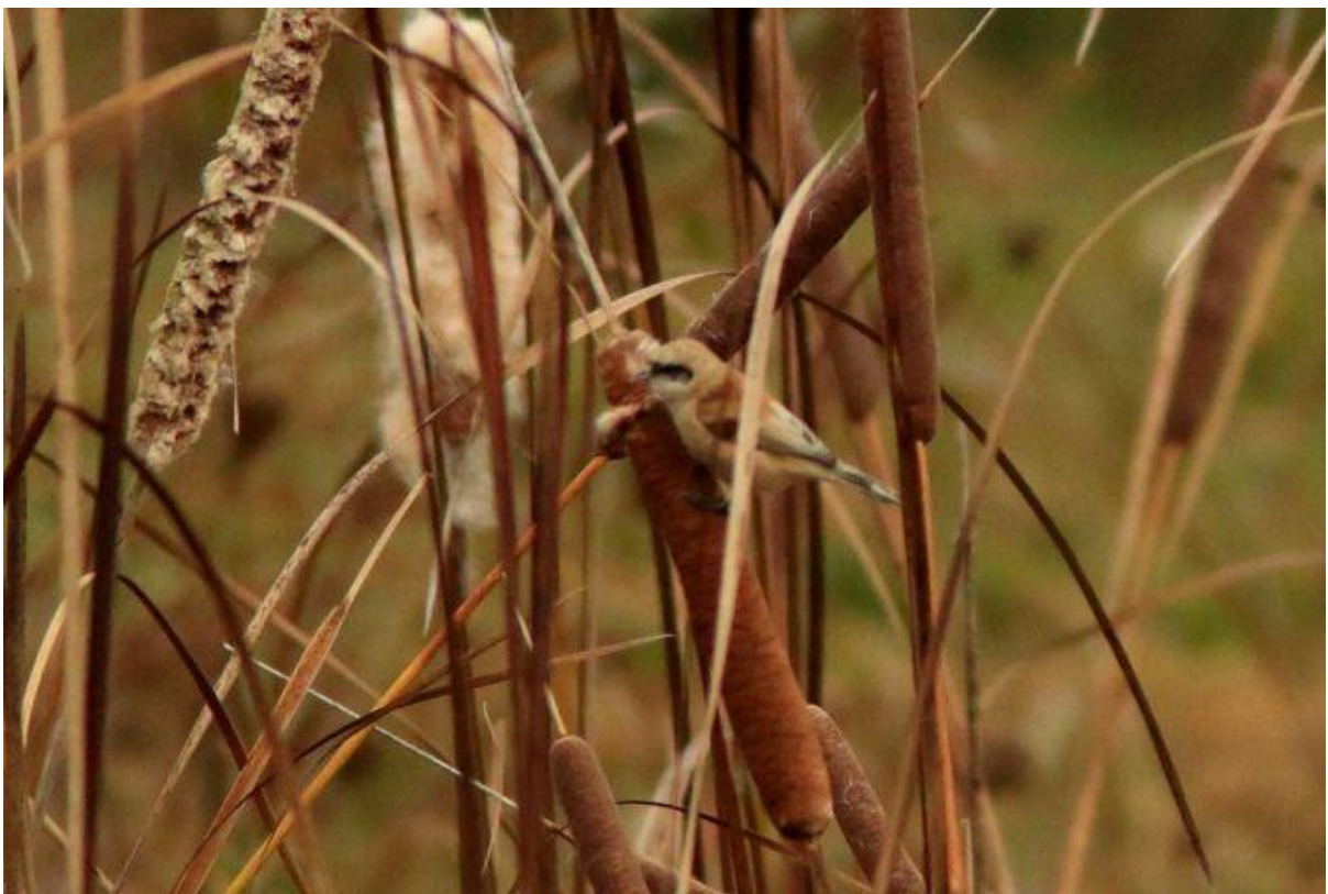
Rémiz penduline, Bazouges-sur-le-Loir (Sarthe), 19 octobre, (J. Pilon).

Une espèce migratrice qui demeure rare, à rechercher dans les massifs de roselières avec massettes notamment.