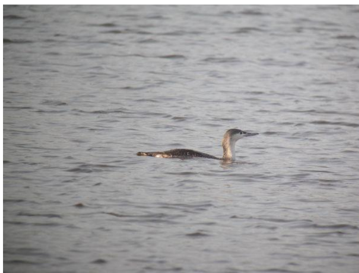
Plongeon catmarin, Saint-Fraimbault-de-Prières (Mayenne), 18 décembre (D. Quinton)

Donnée Mayennaise, à une plage de dates classique pour l'espèce. A noter qu'il s'agit de la 4 ème observation de l'espèce sur le lac de Haute Mayenne depuis 1985.