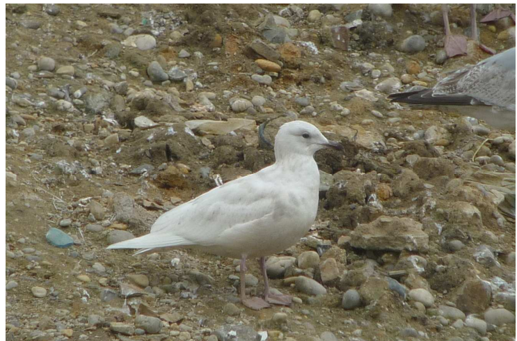
Goéland à ailes blanches, 1 er hiver, Saint-Fraimbault (Mayenne), 9 mars, (D. Madiot)