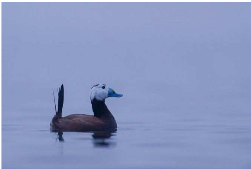
18. Erismature à tête blanche, mâle ad., Juvigné, 3 mars, (Mayenne), (E. Médard)

Deuxième donnée mayennaise remarquable pour cette espèce, après celle de janvier 1989 à Bonchamp, observée en France aux passages migratoires, principalement entre fin février et début avril puis entre fin octobre et fin novembre.