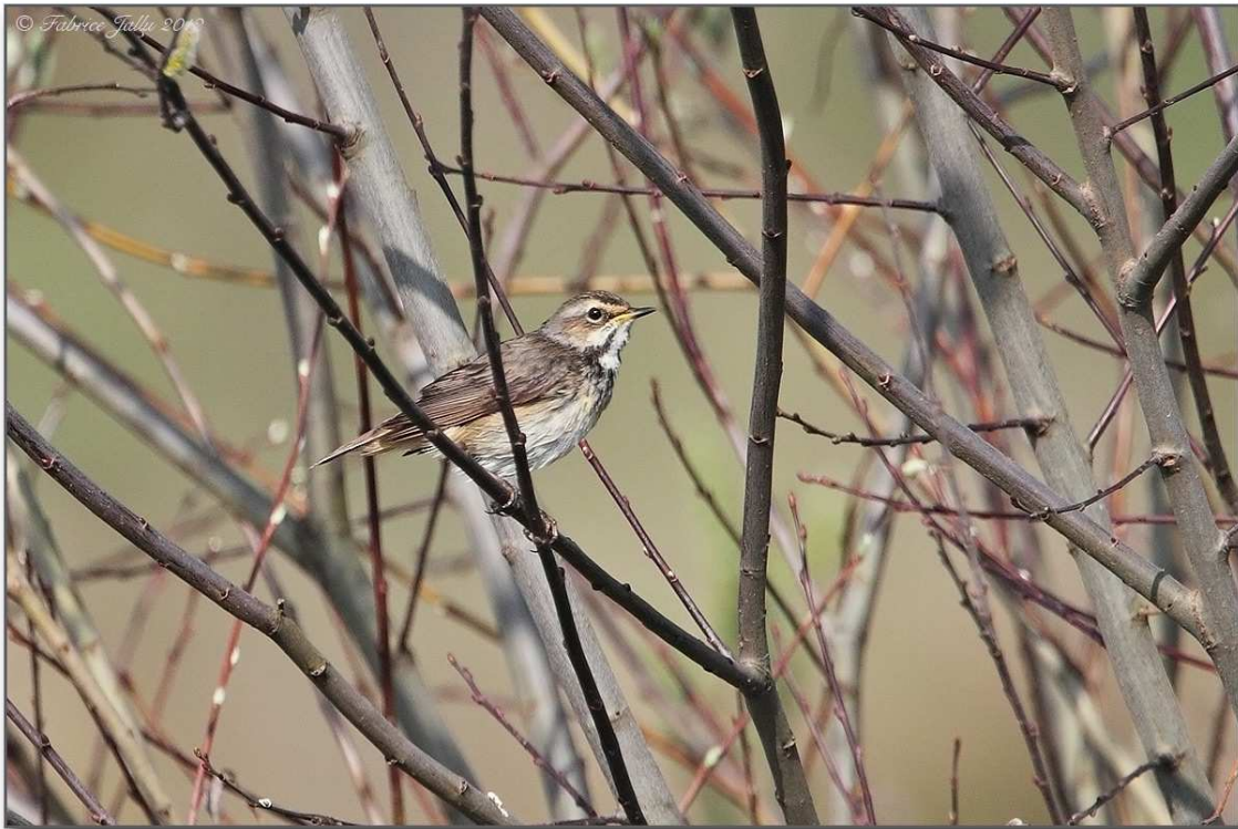
14. Gorgebleue à miroir, femelle, La Ferté-Bernard (Sarthe), 28 mars 2012, (F. Jallu)

A noter que ces données sarthoises datent de la deuxième quinzaine de mars, et qu'il s'agit le plus souvent, d'une année sur l'autre, d'oiseaux observés en migration pré-nuptiale.