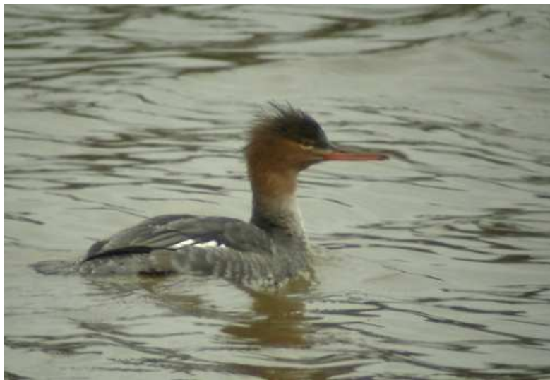
2. Harle huppé, 1 ère année, Bourgon (Mayenne), 9 décembre, (F. Duchenne)

Une donnée mayennaise de cette espèce qui apparaît surtout de mi-octobre à décembre, hivernant assez rare à l'intérieur des terres.