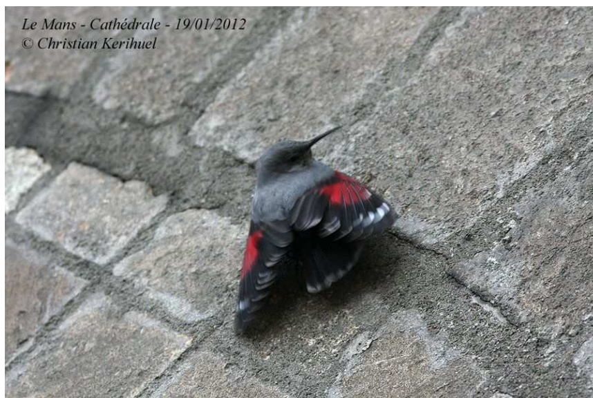
Le Mans - Cathédrale - 19/01/2012

Nouvelle donnée remarquable d'un individu de cette espèce en hivernage, et qui prend goût à son site d'accueil, dans le Vieux Mans, après la donnée de 2010.