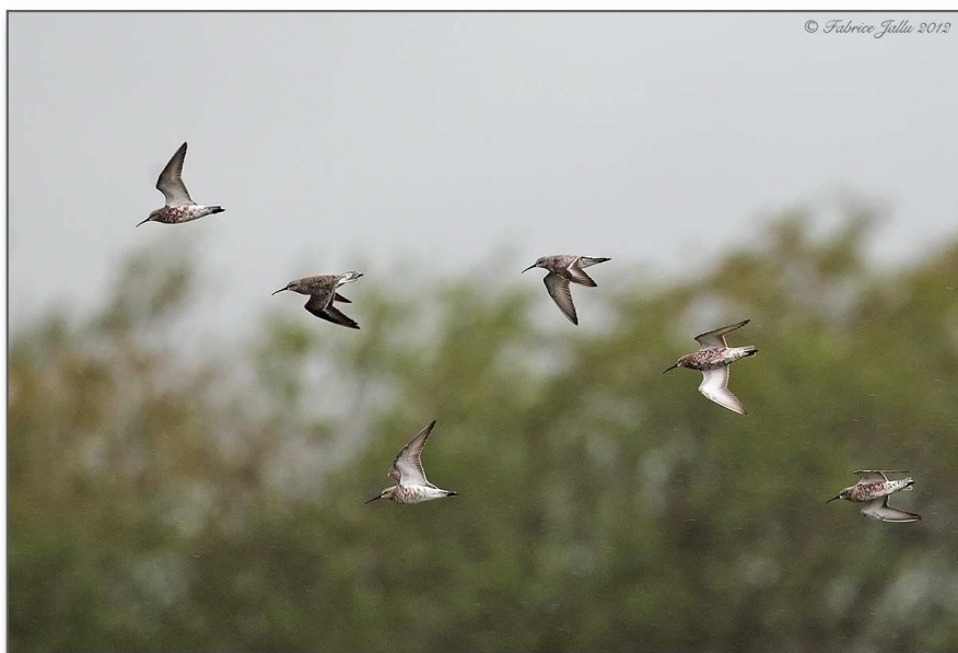
9. Bécasseaux cocorlis, La Ferté-Bernard, (Sarthe), 29 avril

Deux nouvelles données mayennaises .Une nouvelle donnée sarthoise, après celle de septembre 2008, sur le même site.