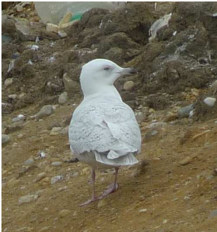
19. Goéland à ailes blanches, ssp ?, 2 ème hiver, Saint-Fraimbault (Mayenne), 24 février, (D. Madiot)

Cet afflux sans précédent a touché l'ouest de l'Europe (effectifs historiques dans les îles Britanniques et les îles Féroës, (Fray et al. 2012).), et le nord-ouest de la France, notamment la façade atlantique et la basse vallée de la Loire, qui ont recueilli la majorité des données.