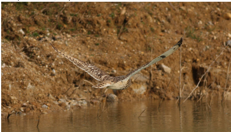
12. Hibou des marais, Maisoncelles du Maine (Mayenne), 22 janvier, (D. Madiot)

Quatre nouvelles données dans le Maine, concernant sept individus. Espèce observée chaque année, depuis la création du CH Maine.