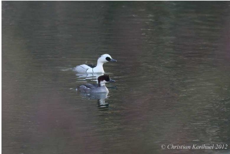
1. Harles piettes, mâle et femelle, Le Mans, 9 février, (C. Kerihuel)