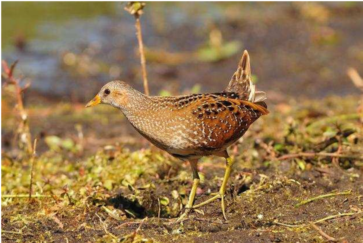
8. Marouette ponctuée, juvénile, Parigné l'Evêque (Sarthe), 6 septembre 2012

Deux données intéressantes (une en Mayenne et une en Sarthe) pour cette espèce discrète et rare contactée cette fois aux deux passages pré et post-nuptial.