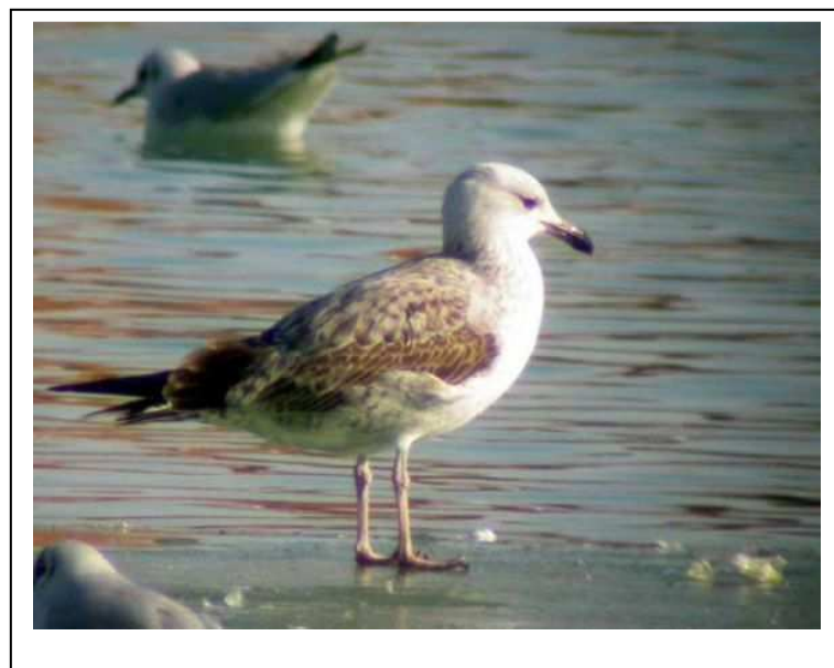
10. Goéland pontique, 1 er hiver, Saint-Fraimbault, (Mayenne), 10 février, (F. Noël)

Deux des quatre données concernent certainement deux oiseaux différents du même âge, l'un stationnant sur les sites habituels du CET et sablières de Glaintain, et lac de Haute-Mayenne, à Saint-Fraimbault, l'autre provenant de l'ouest du département. Espèce d'apparition hivernale régulière ces dernières années en Mayenne, Maine et Loire et Touraine. A noter le stationnement d'un mois et demi pour un oiseau sur les sites du nord-Mayenne. Un suivi régulier en Sarthe, notamment sur Marçon, permettrait certainement des découvertes intéressantes. Des échanges sont notés entre plusieurs sites similaires des départements cités plus haut, ainsi qu'au nord de la Loire-Atlantique pour la 2 ème année consécutive, au moins (collectif www.faune-loire-atlantique.org ). Espèce observée chaque année, depuis la création du CH Maine.