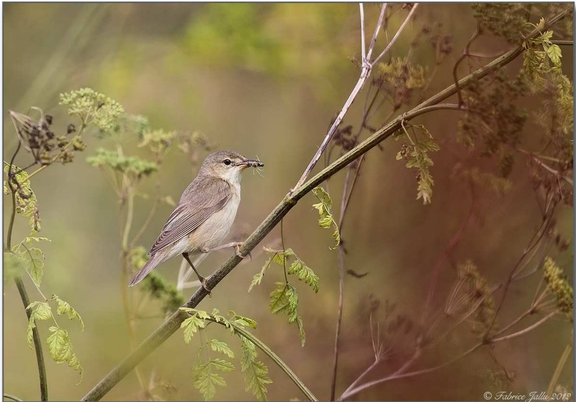
15. Rousserolle verderolle adulte, La Ferté-Bernard, (Sarthe), 15 juillet

Cinquième et sixième mentions mayennaises de l'espèce, en limite sud-ouest de son aire de répartition, dont la reproduction a pu aller à son terme, sur un site banal- talus de gravats à végétation rudérale, dont un massif d'orties- et malgré des conditions météorologiques peu favorables les premières semaines de son installation.