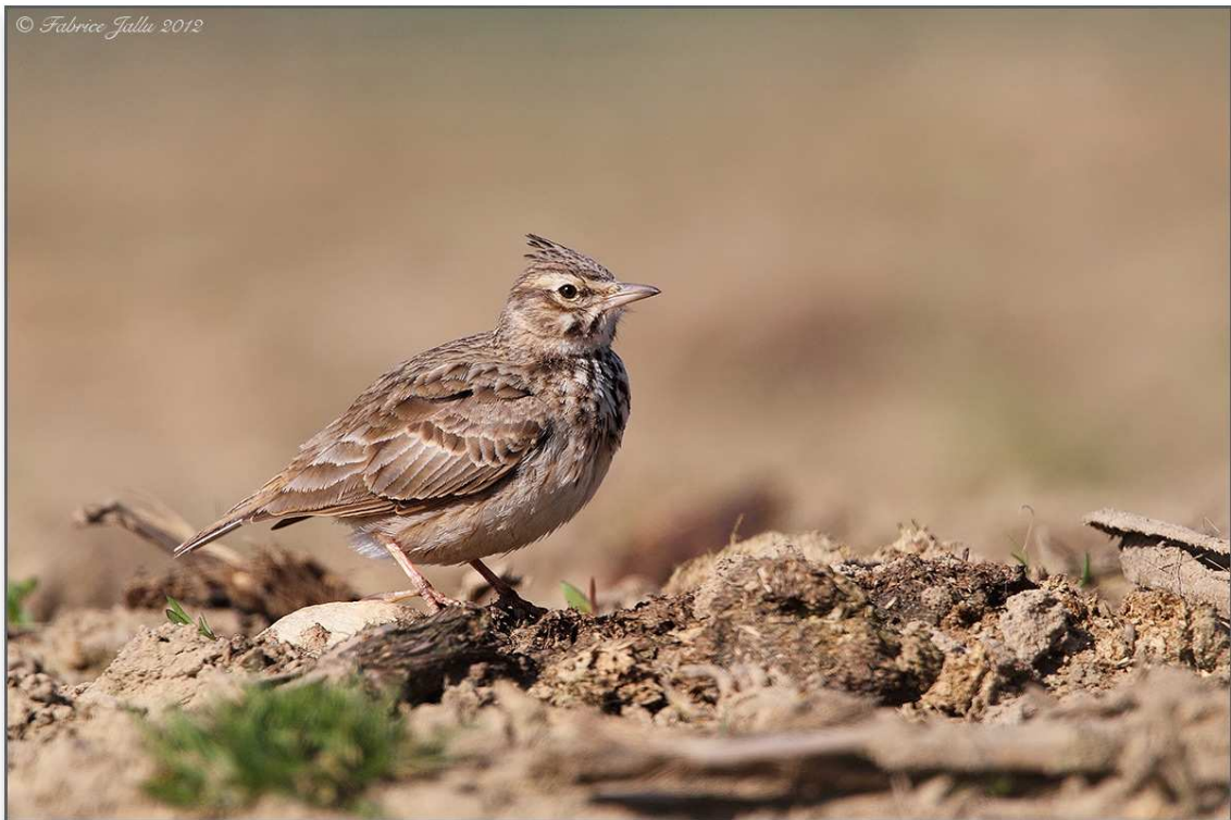
13. Cochevis huppé, Lamnay, (Sarthe), 1er avril 2012

Première donnée mayennaise intéressante, depuis la création du CH Maine, en 2008.