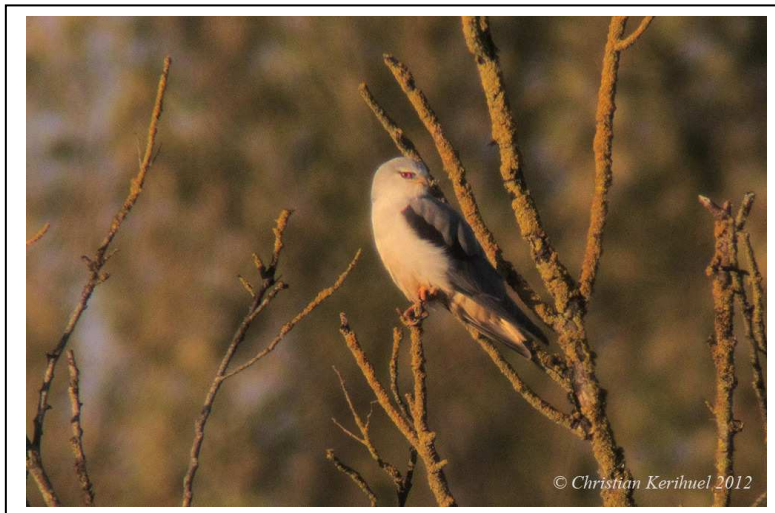
Elanion blanc, adulte, Beaumont Pied de Boeuf (Mayenne), 3 novembre, (C. Kerihuel)

Les oiseaux rares dans le Maine (Mayenne et Sarthe) en 2012