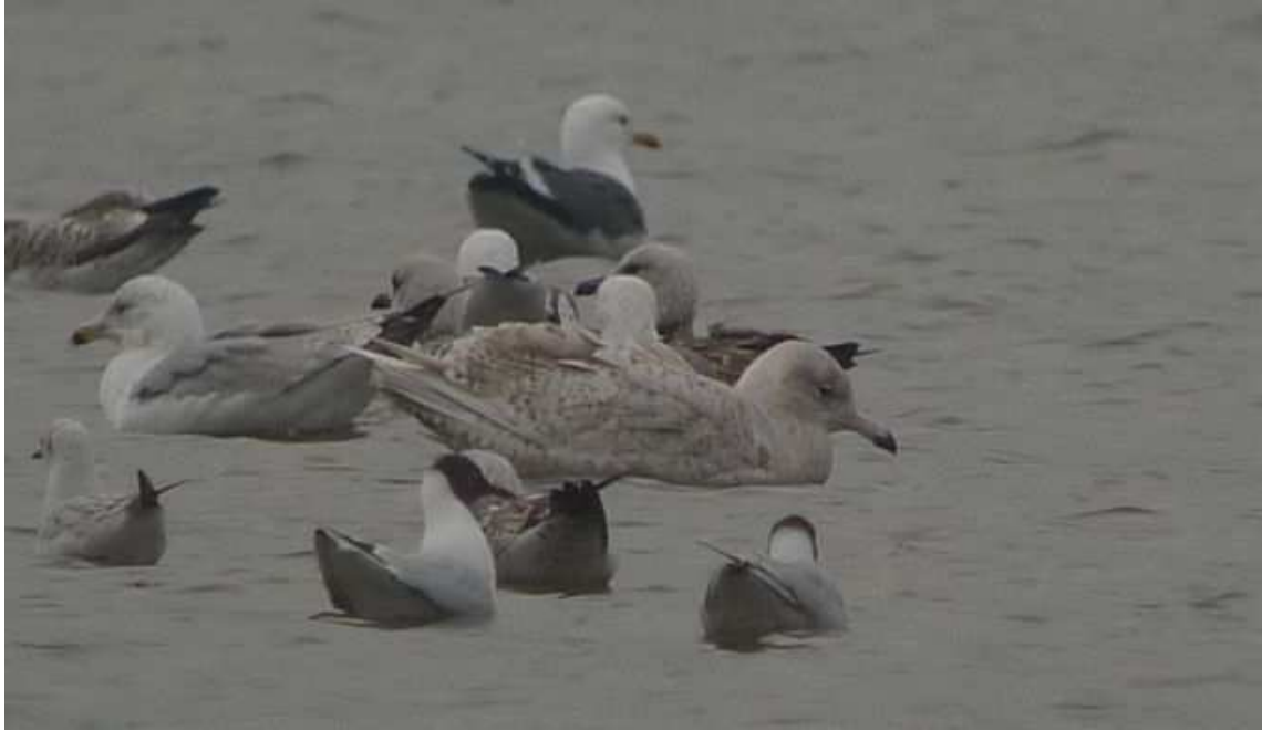
11. Goéland bourgmestre, 1 er hiver, Saint-Fraimbault, (Mayenne), 16 mars, (D. Madiot)

Deuxième observation récente remarquable, en Mayenne, après celle de 1995, d'un oiseau qui a stationné sept semaines ; probablement le même oiseau que celui observé en Sarthe, au lac des Varennes, au cours des trois semaines précédentes.