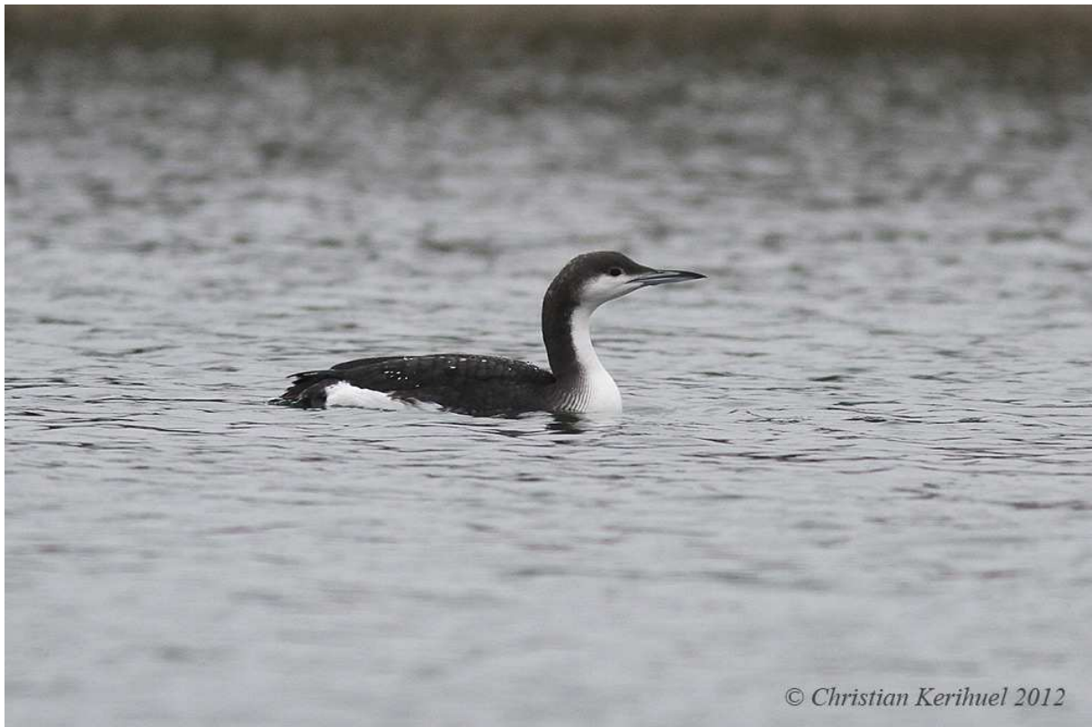
3. Plongeon arctique, adulte, Arnage (Sarthe), 23 décembre 2012

La huitième donnée sarthoise de cette espèce, après celle de 2010, à une période classique d'apparition. Hivernant peu commun le long des côtes et également à l'intérieur des terres, sur étangs, lacs, grands réservoirs et parfois sur le cours des fleuves.