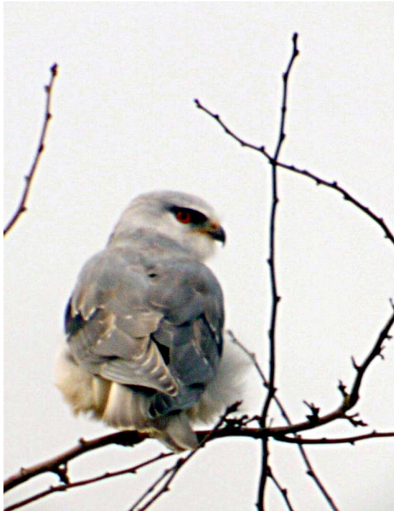
6. Elanion blanc, juvénile, Azé (Mayenne), 9 décembre, (B. Poincet)

il est probable que les oiseaux observés sur Bouessay et Beaumont Pied de Bœuf soient les mêmes, puisqu'à plusieurs reprises, les oiseaux observés sur un site n'étaient pas simultanément présents sur l'autre.