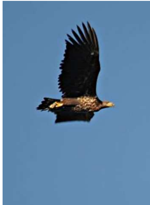
7. Pygargue à queue blanche, 3 e ou 4 e année, Thorée les Pins, (Sarthe), 14 janvier, (O. Vannucci)