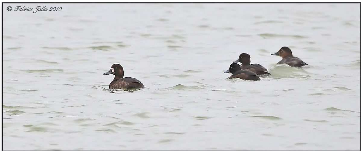
Fig.7 : Fuligule milouinan, La Ferté-Bernard (Sarthe), 25 mars 2010, (F.Jallu)

Pour mémoire, en Mayenne-Aron/étang de Beaucoudray, 1 ind. type femelle, 10 au 12 novembre, (A.Dordoigne, D.Madiot & D.Tavenon) ; Saint-Fraimbault/Lac de Hte Mayenne, m., 3 décembre,(D.Madiot)