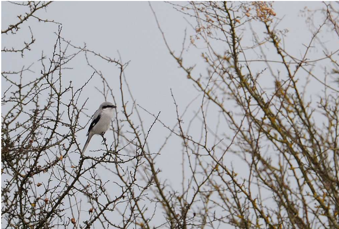
Fig.17 : Pie-grièche grise, Roullée, (Sarthe), 27 fév.2010, (F.Morazé)

Deux nouvelles données sarthoises, après la donnée mayennaise de 2008, à des dates conformes à la normale, pour une espèce certainement sous-prospectée en automne et hiver.