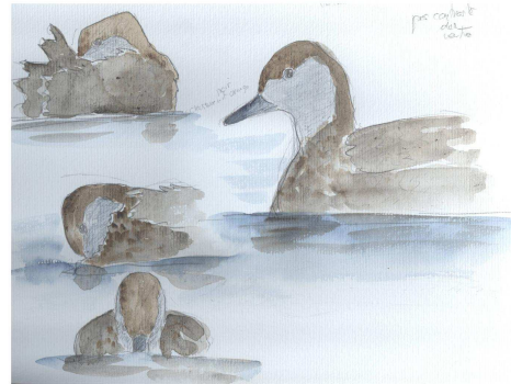
Fig.4 : Nette rousse, La Flèche (Sarthe), 4 oct. 2010, (dessin de F.Cudennec)