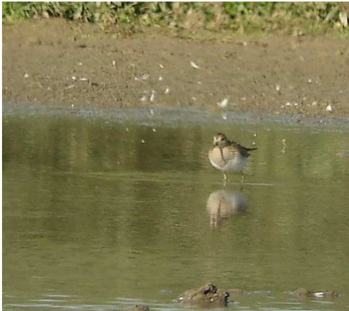
Fig.11: Bécasseau tacheté, Bourgon, (Mayenne), 21septembre 2008 (D.Madiot).

Cette observation, 9 jours après celle de l'oiseau trouvé par M.Letue sur le même site, pourrait concerner un nouvel oiseau, sans certitude, malgré la présence d'un décrochement sur les stries de la poitrine, côté gauche, qui n'existait pas sur les photos du 1 er oiseau trouvé. Ce qui porterait à trois le nombre d'oiseaux observés en Mayenne en 2008.