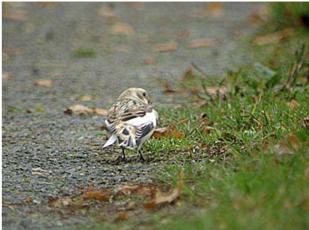
Fig.18 : Bruant des neiges, Jublains, (Mayenne), 4 nov. 2010, (D.Tavenon)

Belle observation d'un oiseau, à trois jours d'intervalle, qui constitue la troisième donnée également remarquable de cette espèce en Mayenne, à des dates conformes à la normale.