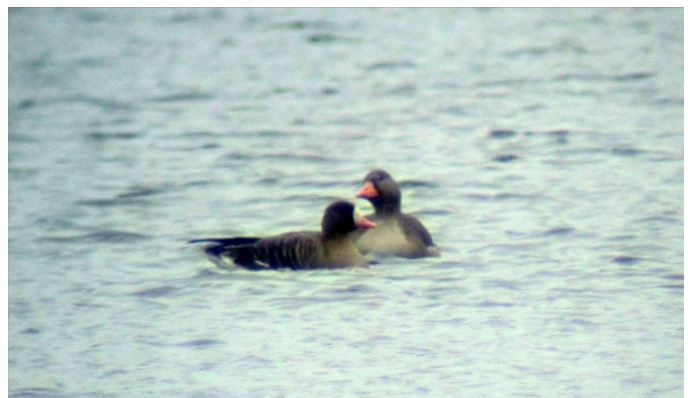
Fig.2 : Oie rieuse, Mézangers (Mayenne), 6 déc. 2010