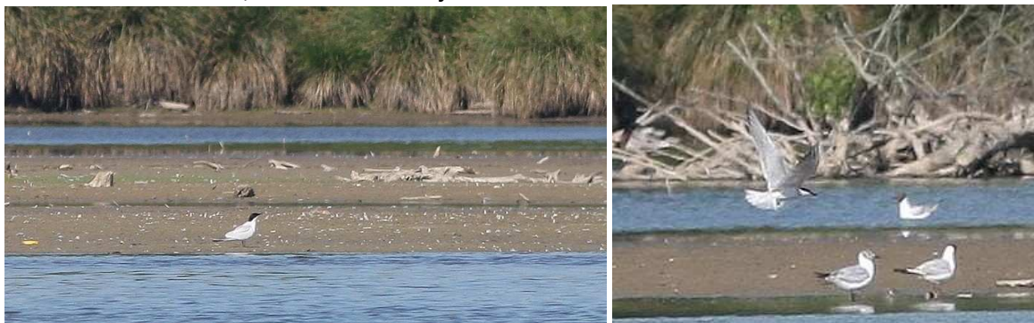
Fig.13 : Sterne hansel, posée à gauche, en vol à droite, Aron, (Mayenne), 22 mai 2010, (D.Madiot)

Première donnée mayennaise remarquable pour cette espèce migratrice, occasionnelle à l'intérieur des terres, de fin mai à mi-juillet.