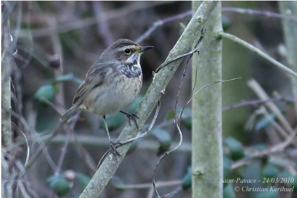
Fig.16 : Gorgebleue à miroir, Saint- Pavace, (Sarthe), 24 mars