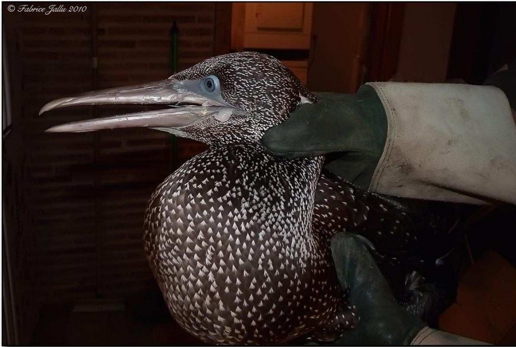
Fig.8 : Fou de Bassan, Montmirail, (Sarthe), 1 er oct.2010, (F.Jallu)