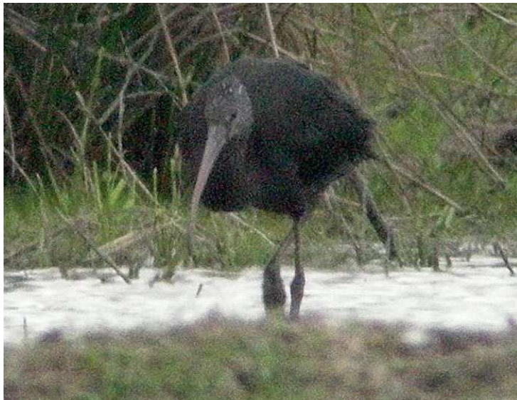
Fig.9 : Ibis falcinelle, Aron, (Mayenne), 15 mai 2010

Première mention mayennaise récente, remarquable, sur un site mayennais très attractif au printemps 2010 en raison du niveau d'eau resté suffisamment bas longtemps pour accueillir de nombreuses espèces occasionnelles en halte migratoire.