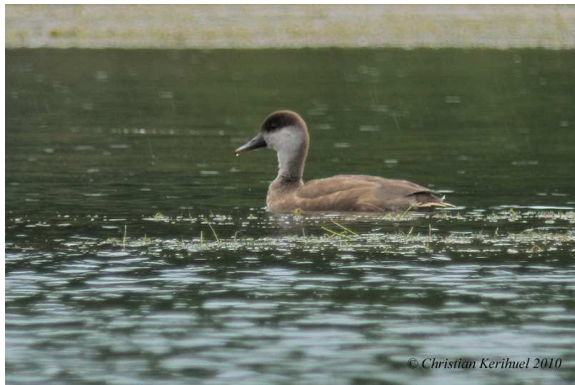
Fig.3 : Nette rousse, La Flèche (Sarthe), 5 oct. 2010

Deux nouvelles données sarthoises de cette espèce, observée chaque année, depuis la création du CH Maine.