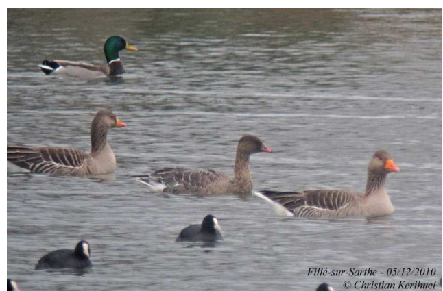
Fig.20 : Oie à bec court, Fillé sur Sarthe (Sarthe), 5 déc. 2010, (C.Kerihuel)