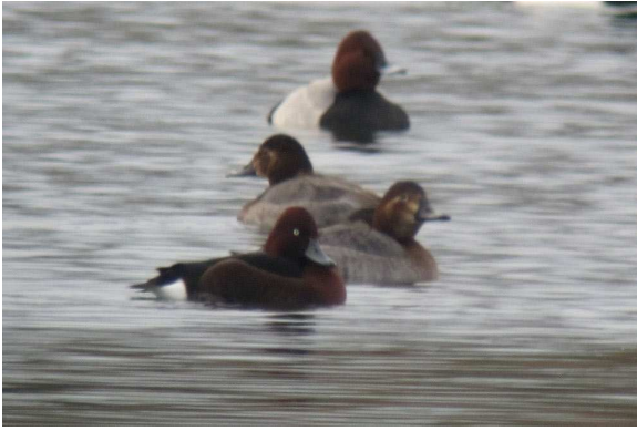
Fig.5 : Fuligule nyroca, Fillé sur Sarthe, (Sarthe) 5 déc.2010, (C.Kerihuel)