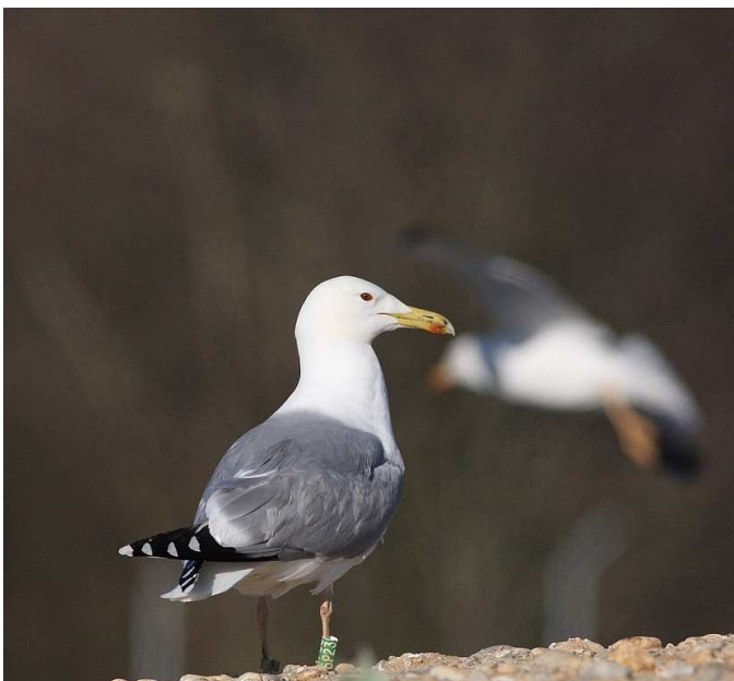
Fig.12 : Goéland pontique, Saint- Fraimbault, (Mayenne), 5 mars 2010, oiseau bagué en Pologne, (D.Madiot)

Cinq nouvelles données mayennaises, dont quatre à Saint-Fraimbault, sur les sites du CET et des sablières de Glaintain, ainsi que sur le lac de Haute-Mayenne, seulement distant de 4 à 5 km, et qui accueille l'espèce au dortoir depuis 2008. Espèce d'apparition hivernale régulière ces dernières années en Mayenne-Sarthe, Maine et Loire et Touraine. Des échanges sont notés entre plusieurs sites similaires des départements cités plus haut. Espèce observée chaque année, depuis la création du CH Maine.