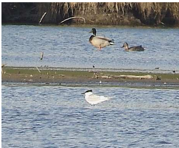
Fig.14 : Sterne caugek, Aron, (Mayenne), 25 avril 2010, (D.Madiot)

Nouvelle donnée mayennaise à une date conforme à la normale.