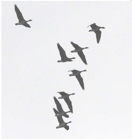
Fig.1 : Oies rieuses, Fillé sur Sarthe (Sarthe) , 5 déc.2010, (P-V.Vandenweghe)

Trois données dans une fourchette de dates qui s'inscrit bien dans le pattern d'apparition de l'espèce. Noter l'arrivée simultanée des Oies rieuses et de l'Oie à bec court, à Fillé sur Sarthe, le 5 décembre, ces deux espèces voyageant assez souvent ensemble.