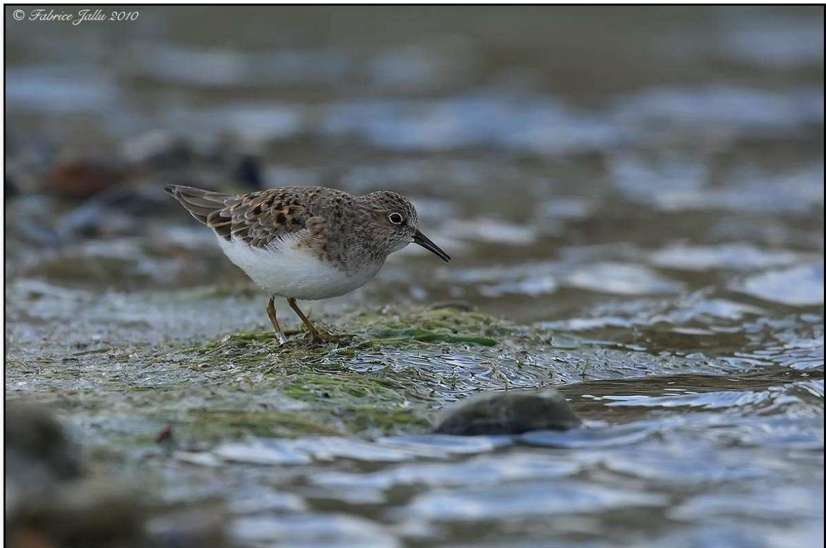
© Fabrice Jallu 2010 Bécasseau de Temminck, La Ferté-Bernard, (Sarthe), 8 mai 2010, oiseau bagué en Suède, à Ottenby, le 25 août 2008, dans sa première année, (F.Jallu).

3ème rapport du Comité d'Homologation du Maine