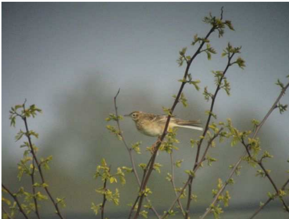
Fig.15 : Pipit de Richard, L'Huisserie, (Mayenne), 21 avril, (J-L. Reuzé)