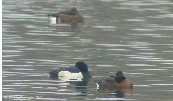
Fig .6 : Fuligules nyrocas, Spay, (Sarthe), 29 janv.2011