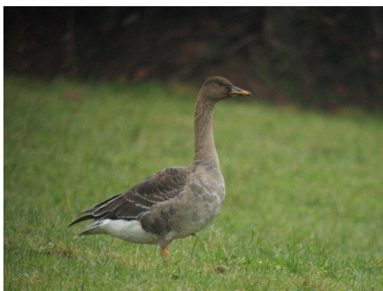
Fig.19 : Oie de la Taïga, Olivet (Mayenne), 5 déc. 2010

Première donnée mayennaise et pour le Maine, remarquable, de cette oie hivernante rare et encore mal connue.