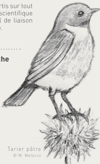
Tariet pâtre

🏠 sarthe.lpo.fr (en cours de refonte) 🌐 www.facebook.com/lposarthe