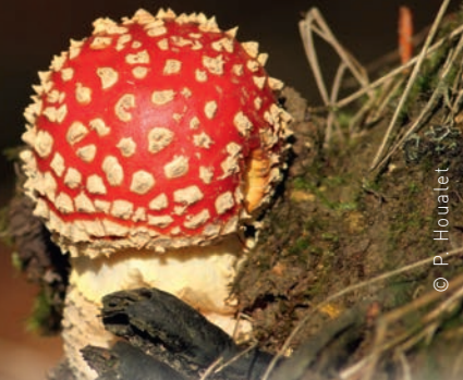
© P. Houatlet © R. Pellion