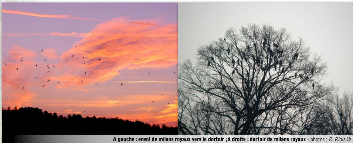
A gauche : envol de milans royaux vers le dortoir ; à droite : dortoir de milans royaux