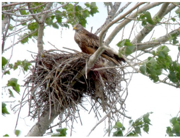
Nid de Milan Royal