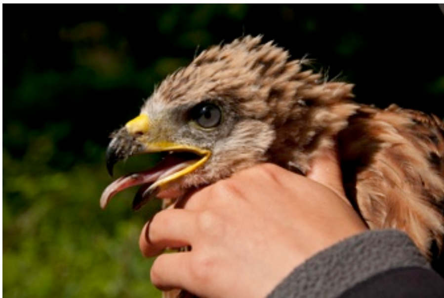
Jeune milan royal

Quelques zones géographiques n'ont pas été couvertes en 2012, un effort de prospection sera réalisé en 2013. (Secteur Neufchâteau et Sarreguemines)