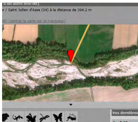
Carte de localisation faune-paca.org

Noter le maximum d'informations en remarque