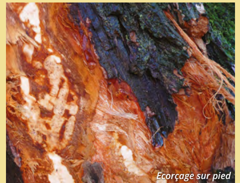
Ecorçage sur pied

Un « écorçage sur pied » est un tronc ou une branche écorcée par le castor. Attention : les ragondins pratiquent parfois aussi l'écorçage, mais seulement ponctuellement et en petite quantité.