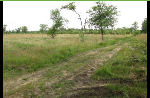
Habitat typique d' A. boabdil sur le plateau landais. (Mios – 33)

Des recherches dans le Nord-Gironde, en forêt de la Double et dans l'est du Béarn permettront de mieux cerner la zone de contact entre les deux espèces.