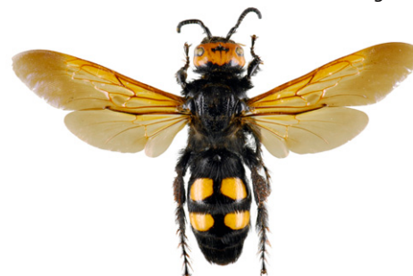
Scolie des jardins, Megascolia maculata flavifrons

La scolie des jardins fait partie des plus imposantes "guêpes" européennes. Elle est de ce fait fréquemment confondue avec le frelon asiatique. Sa pilosité est très épaisse. Son corps est noir brillant, sa tête est jaune sur le dessus et elle possède 4 zones jaunes et glabres sur l'abdomen. C'est un parasite de larves de gros Coléoptères (comme le Hanneton).