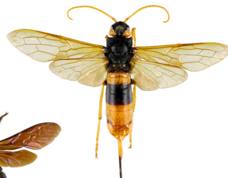
Sirex géant, Urocerus gigas

Le sirex géant est un Hyménoptère dont la larve se nourrit de bois. La femelle peut atteindre 4,5 cm, a une coloration proche du frelon asiatique, mais s'en distingue facilement par des antennes longues entièrement jaunes ainsi que par la présence d'une longue tarière lui permettant de pondre dans le bois. Cet insecte est inoffensif.