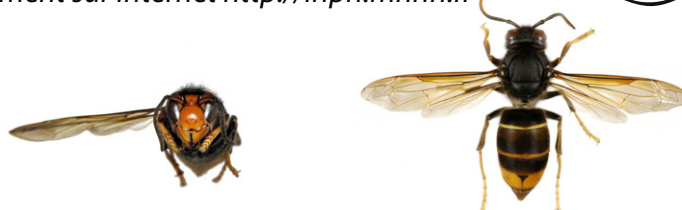
Frelon asiatique à pattes jaunes, Vespa velutina var. nigrithorax

Le frelon asiatique à pattes jaunes, Vespa velutina , est à dominante noire, avec une large bande orange sur l'abdomen et un liseré jaune sur le premier segment. Sa tête vue de face est orange, et les pattes sont jaunes aux extrémités. Il mesure entre 17 et 32mm.