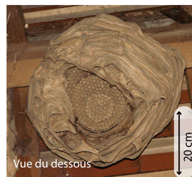
Vue du dessous