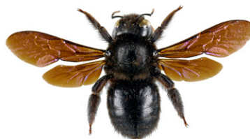
Xylocope ou abeille charpentière, Xylocopa violacea

L' abeille charpentière mesure entre 2 et 3 cm. C'est l'une des plus grandes abeilles européennes. Elle est entièrement noire avec des reflets bleu violacés. Elle construit son nid dans le bois mort et nourrit ses larves de pollen.