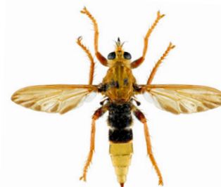
Asile frelon, Asilus crabroniformis