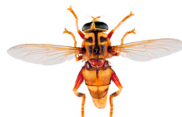
Milésie faux-frelon, Milesia crabroniformis