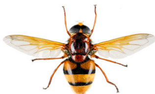
Volucelle zonée, Volucella zonaria

De nombreuses mouches (Diptères) peuvent ressembler à des guêpes ou des frelons. Mais à la différence de ceux-ci elles ne possèdent qu'une seule paire d'ailes au lieu de deux. Leurs yeux sont généralement beaucoup plus globuleux et leurs antennes plus courtes.