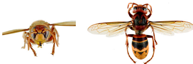
Frelon d'Europe, Vespa crabro

Le frelon d'Europe , Vespa crabro , a l'abdomen à dominante jaune clair, avec des bandes noires. Sa tête est jaune de face et rouge au dessus. Son thorax et ses pattes sont noirs et brun-rouges. Les ouvrières mesurent entre 18 et 23mm et les reines entre 25 et 35.