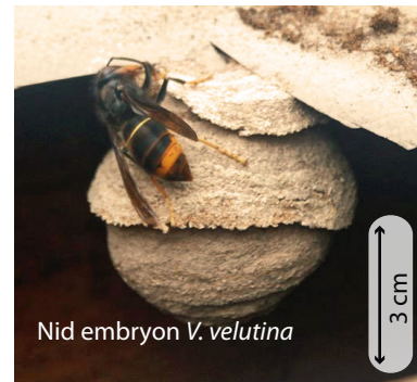
Nid embryon V. velutina

Au printemps, chaque reine fondatrice construit seule son nid dans un lieu souvent protégé. Chez la plupart des guêpes le nid embryon ressemble à une petite sphère de 5 à 10 cm de diamètre avec une ouverture vers le bas. Chez les frelons, la colonie n'hésitera pas à déménager si l'emplacement ne convient plus (manque de place, de sécurité).