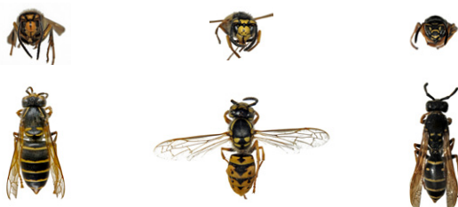
Guêpe des buissons, Dolichovespula media

Les guêpes sont plus petites que les frelons. Les ouvrières mesurent environ 15mm en fin d'été. Attention, une reine de guêpe peut dépasser légèrement 20mm, c'est-à-dire la taille du frelon asiatique représenté ici sans la tête. Au printemps les guêpes peuvent donc être plus grande que les premières ouvrières de frelon.