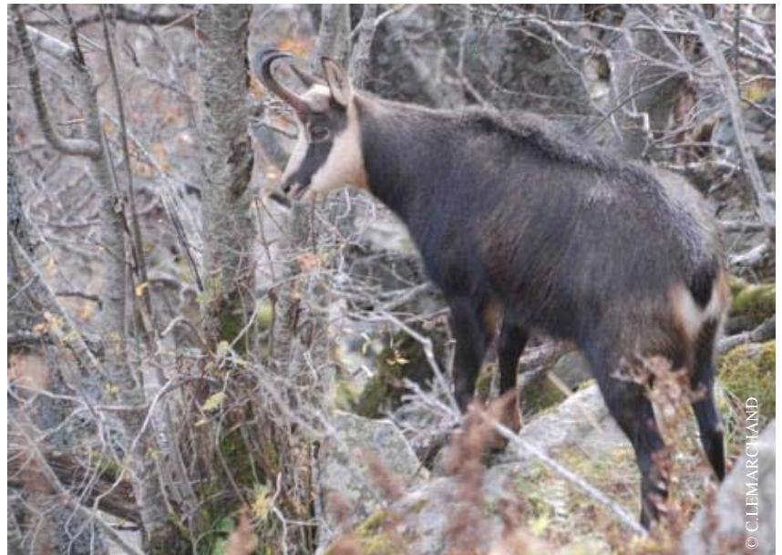
Chamois Rupicapra rupicapra

De même des groupes de chamois (jusqu'à plus de 20 individus) sont observés dans ces départements (PiR, ViM, ChL, JPD).