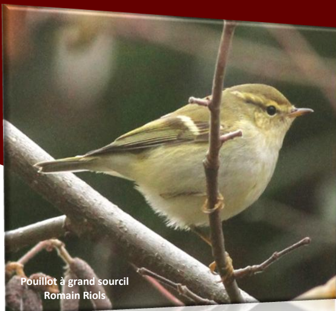
Pouillot à grand sourcil Romain Riols

Ce mois a aussi permis de voir beaucoup d'espèces avec des individus très tardifs :