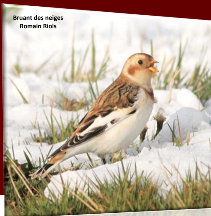
Bruant des neiges Romain Riols