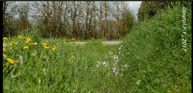
Bord de route à Cardamine des prés

A rechercher dans les milieux ouverts humides où poussent la Cardamine des prés ou diverses brassicacées : prairies de fond de vallon, clairières, bords de champs et de routes, bords de fossés humides.