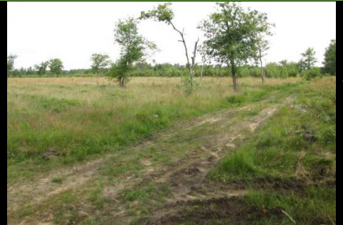
Habitat typique d' A. boabdil sur le plateau landais. (Mios – 33)

Des recherches dans le Nord-Gironde, en forêt de la Double et dans l'est du Béarn permettront de mieux cerner la zone de contact entre les deux espèces.