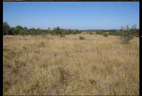
Habitat typique d' A. arethusana sur pelouses sèches. (La Rochebeaucourt- et-Argentine – 24)