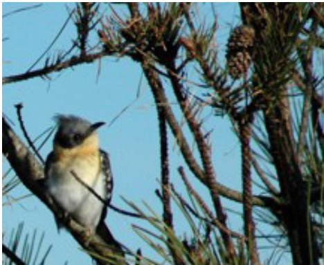
Coucou-geai adulte – Bonne Anse, Les Mathes (17), janvier 2008

récent date de cette année dans le Marais Poitevin, où 2 jeunes ont été élevés par un couple de pies entre le 27 mai et le 11 juin 2009, le nid de pie parasité étant situé dans un saule bordant une carrière, et aucun adulte n'ayant été observé au préalable sur le site (J. Sudraud com. pers. , photos sur www.faune-vendee.org ). En attendant, il semble être un migrateur pré- et post-nuptial assez régulier, et sans doute en augmentation dans la région. L'expansion en latitude et en altitude de la processionnaire du pin en France, sous l'effet du réchauffement climatique (Battisti et al. 2005), pourrait d'ailleurs lui être favorable à l'avenir.