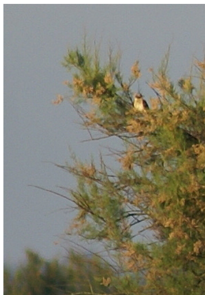
Coucou-geai adulte ou 1er été – Domaine de Certes (33), juin 2009

sés dans la région de Madrid en mars, tous ne contenaient que de la processionnaire (Valverde 1953, Hoyas & Lopez 1998). Lors des parades nuptiales qui ont lieu de mars à mai dans le sud de l'Espagne, le mâle nourrit la femelle de chenilles en majorité (42%) puis secondairement de Coléoptères (17%) et d'Orthoptères (17%) (Soler 1990). Les jeunes coucou-geais étant nourris par leurs parents adoptifs surtout de Coléoptères et d'Orthoptères (Soler et al. 1995), l'habitude de prédater les chenilles urticantes est sans doute acquise plus tard par l'oiseau adulte (Gill 1980).