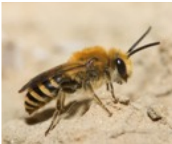
Mâle au repos