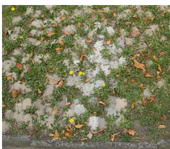
Nids de Colletes hederæ