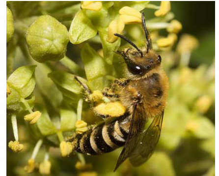
Femelle visitant des fleurs de lierre