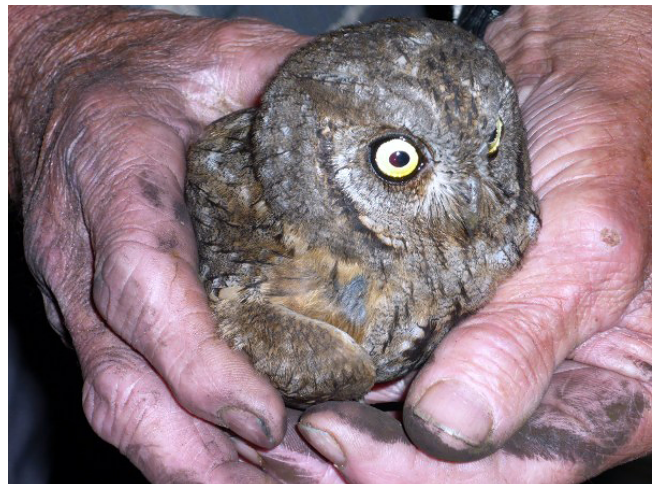
Fig. 30. — Petit-duc scops ( Otus scops ), Vaudelnay, 8 juin 2012 (Joël Guédon).