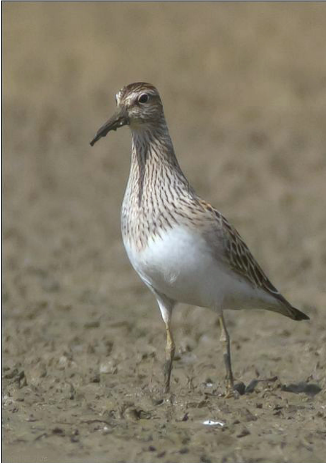
Fig. 25. — Bécasseau tacheté ( Calidris melanotos ), Vivy, 20 septembre 2012.