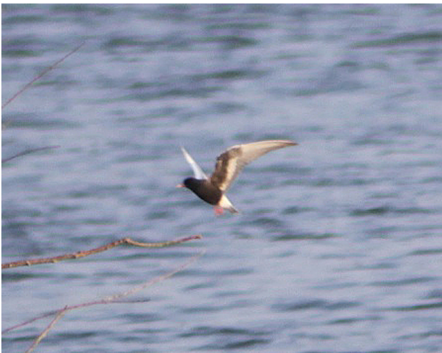
Fig. 9. — Guifette leucoptère ( Chlidonias leucopterus ), Montreuil-sur-Loir, 27 avril 2011 (Fabrice Rayet).