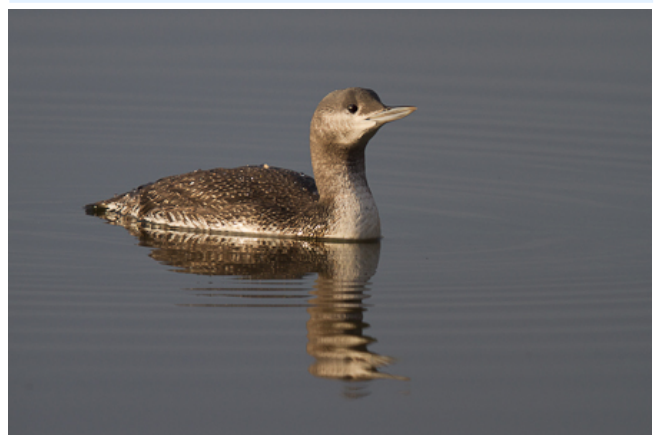
Fig. 6. – Plongeon catmarin ( Gavia stellata ), Chanteloup-les-Bois, 19 décembre 2011 (Matthieu Morier).