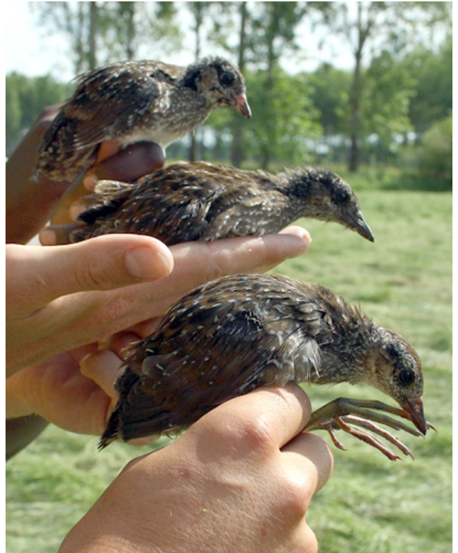
Fig. 23. — Marouettes ponctuées ( Porzana porzana ), Briollay, 21 juillet 2012.