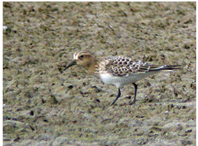
Fig. 35. — Bécasseau de Baird ( Calidris bairdii ), Vivy, 21 septembre 2012.