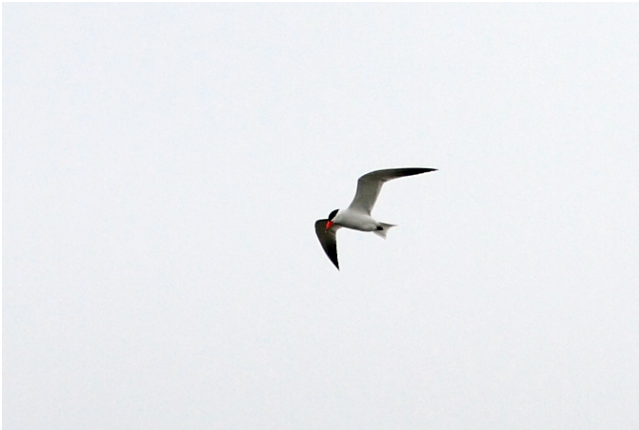
Fig. 8. — Sterne caspienne ( Hydroprogne caspia ), Le Marillais, 31 mars 2011 (Pascal Bellion).