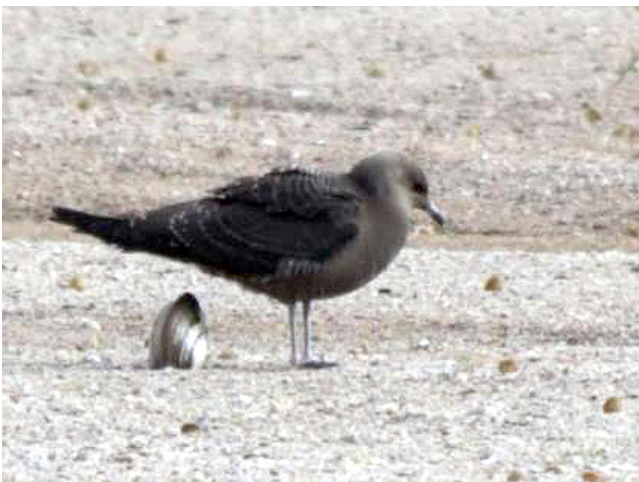
Fig. 26. — Labbe à longue queue ( Stercorarius longicaudus ), Saint-Georges-sur-Loire, 26 août 2012 (Olivier Deniau).

Montreuil-sur-Loir : 9 juillet, 1 immature, les Bretonnières (J.-L. Ronné, R. Frontin, fig. 27).