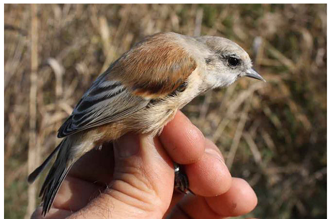
Fig. 12. — Rémiz penduline ( Remiz pendulinus ), Soulaire-et-Bourg, 1 er octobre 2011 (Gilles Mourgaud).