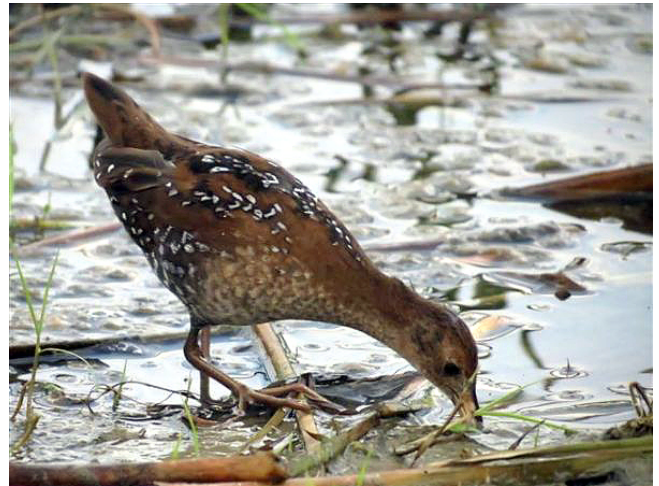
Fig. 34. — Marouette de Baillon ( Porzana pusilla ), Soulaire-et-Bourg, 11 août 2012 (Didier Bizien).

Vivy : 21 septembre, 1 juvénile, les Monteaux (Ph. J. Dubois et al. , in KAYSER Y., PAEPEGAEY B. & CHN, 2014, fig. 35).