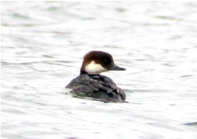
Fig. 4. – Harle piette ( Mergellus albellus ), Montreuil-sur-Loir, 6 février 2011.

Montreuil-sur-Loir : 8 janvier, 1 individu de type femelle, Bretonnières (E. Séchet, G. Mourgaud) ; 1 individu de type femelle, 1 er au 7 février (à Bré/Seiches-sur-le-Loir le 4 février), Bretonnières (F. Rayer, J.-P. Boisdron, É. Beslot, G. Barguil, R. Goupil, fig. 4).