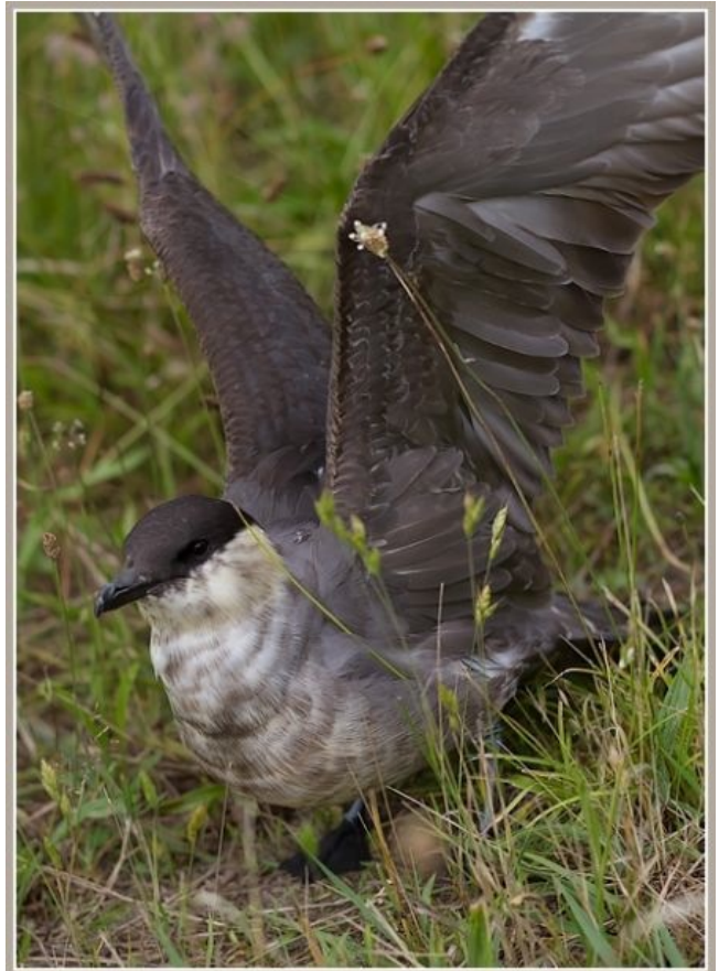
Fig. 27. — Labbe à longue queue ( Stercorarius longicaudus ), Montreuil-sur-Loir, 9 juillet 2012.