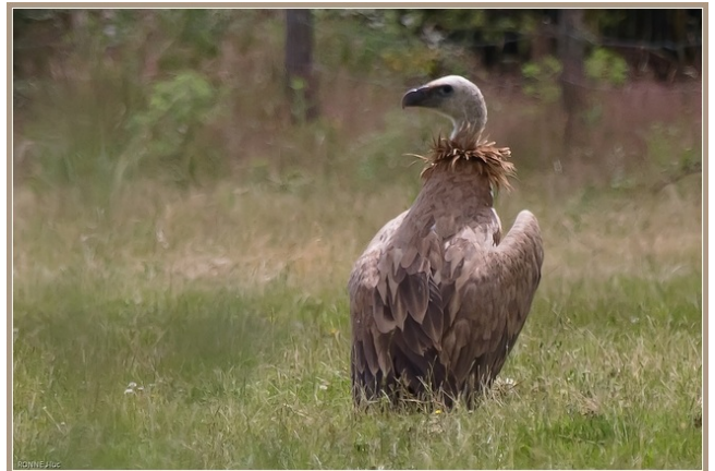
Fig. 20. — Vautour fauve ( Gyps fulvus ), Verrie, 7 juillet 2012 (Jean-Luc Ronné).

Verrie : 1 er juillet au 15 août, 1 immature, Villemolle l'Abbé (Y. Guyomard et al. , fig. 20).