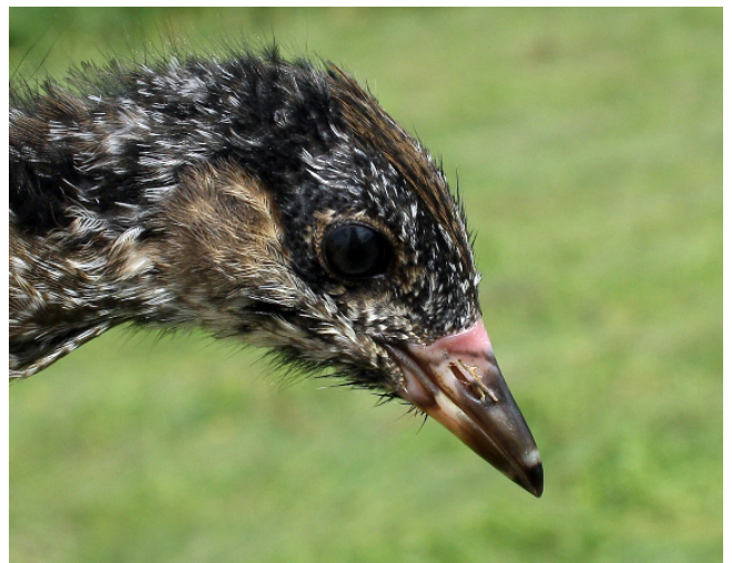
Fig. 24. — Marouette ponctuée ( Porzana porzana ), Briollay, 21 juillet 2012 (Hugo Touzé).

Bouchemaine : 26 août, 1 adulte sombre, la Pointe (D. & P. Bizien, V. Rousseau).