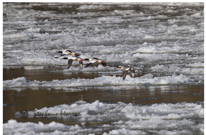
Fig. 16. – Harles bièvres ( Mergus merganser ), Chalonnnes-sur-Loire, 11 février 2012 (Stéphane Moreau).

Saumur : 26 février, 1 mâle, Beaulieu (P. Raboin, J.-M. Bottereau).