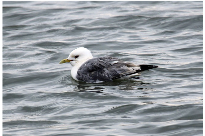
Fig. 28. — Mouette tridactyle ( Rissa tridactyla ), Montreuil-sur-Loir, 4 juin 2012.

Cholet : 23 juillet, 1 individu, le Puy Saint-Bonnet (J.-M. Logeais).