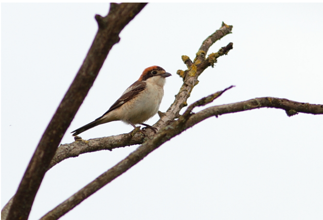
Fig. 14. — Pie-grièche à tête rousse ( Lanius senator ), Freigné, 8 mai 2011 (Pascal Bellion).