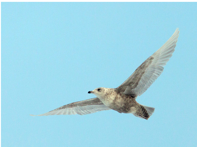
Fig. 36. — Goéland à ailes blanches ( Larus glaucooides ), La Séguinière, 8 février 2012.

Saint-Rémy-en-Mauges : 11 janvier, 1 individu de 1 er hiver, centre de compostage (L. et P. Bellion, in KAYSER Y., PAEPEGAEY B. & CHN, 2014) ; 1 er au 3 février, 1 individu de 1 er hiver, centre de compostage (L. et P. Bellion, in KAYSER Y., PAEPEGAEY B. & CHN, 2014).