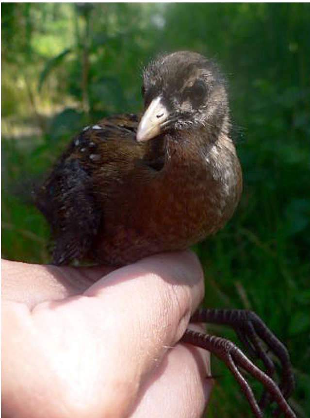
Fig. 33. — Marouette de Baillon ( Porzana pusilla ), Cantenay-Épinard, 24 juillet 2012 (Édouard Beslot).

Soulaire-et-Bourg : 31 juillet, 1 poussin, la Baillie (É. Beslot, A. Gachet, in KAYSER Y., PAEPEGAEY B. & CHN, 2014) ; 8 au 11 août, 1 juvénile, la Baillie (É. Beslot et al. , in KAYSER Y., PAEPEGAEY B. & CHN, 2014, fig. 34).