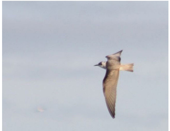
Fig. 29. — Guifette leucoptère ( Chlidonias leucopterus ), lac de Maine 16 octobre 2012 (Sébastien Bertru).