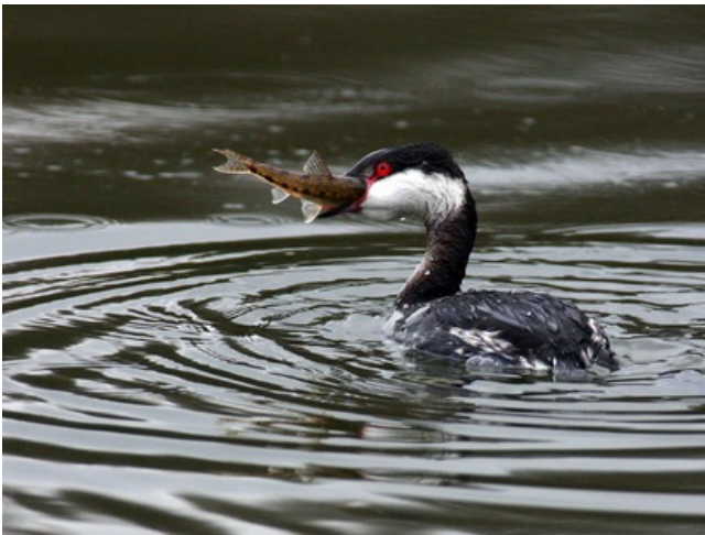
Fig. 18. — Grèbe esclavon ( Podiceps auritus), Pouancé, 16 février 2012.