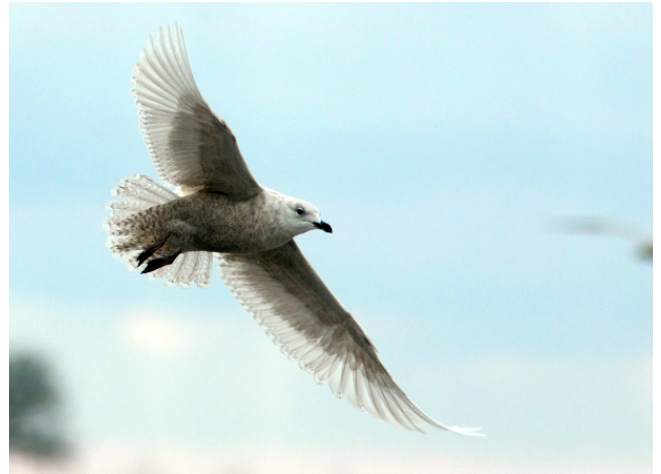
Fig. 37. — Goéland à ailes blanches ( Larus glaucooides ), La Poitevinière, 16 février 2012.

Nuaillé : 28 décembre, 1 individu « à tête blanche », centre aéré (É. Van Kalmthout, in KAYSER Y., PAEPEGAEY B. & CHN, 2014).