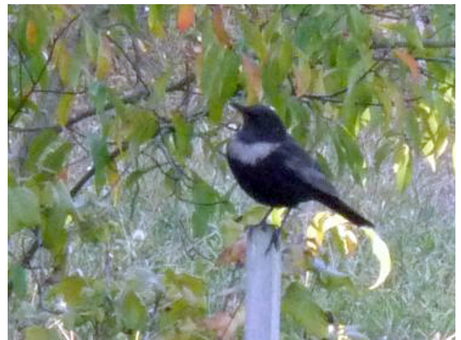
Fig. 15. — Merle à plastron ( Turdus torquatus ), Saumur, 13 octobre 2011 (Xavier Chedanne).

Saumur : 13 octobre, 1 individu, la Motte (X. Chedanne, fig. 15).