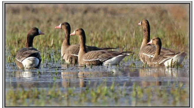
Fig. 2. — Oies rieuses ( Anser albifrons ), Sainte-Gemmes-sur-Loire, 11 février 2011 (Jean-Luc Ronné).