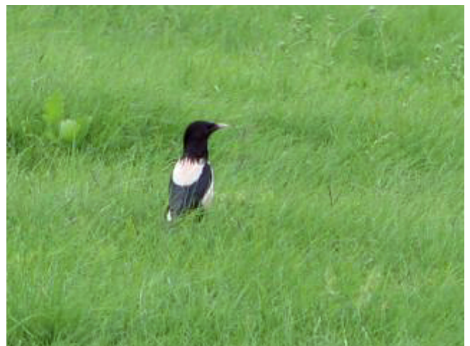
Fig. 38. — Étourneau roselin ( Pastor roseus ), Louresse-Rochemenier, 11 juillet 2012 (Thierry Printemps).

Louresse-Rochemenier : 11 juillet, 1 mâle adulte, Champ Rond (Th. Printemps, P. Dupeyraz, A. Dellière, in KAYSER Y., PAEPEGAEY B. & CHN, 2014, fig. 38).