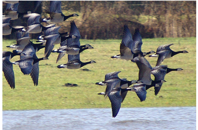
Fig. 3. — Bernaches nonnettes ( Branta leucopsis ), Champtocé-sur-Loire, 9 janvier 2011 (Laurent Terrien).

La Tessoualle-Maulévrier : 9 juin au 4 septembre, 1 individu, lac du Verdon (J.-M. Logeais et al. ).