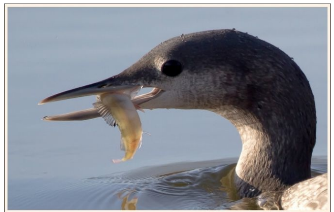
Fig. 5. – Plongeon catmarin ( Gavia stellata ), Chanteloup-les-Bois, 30 novembre 2011 (Jean-Luc Ronné).

Saumur : 17 décembre, 1 individu de 1 er hiver, île Ponneau (D. Rochier, P. Raboin).