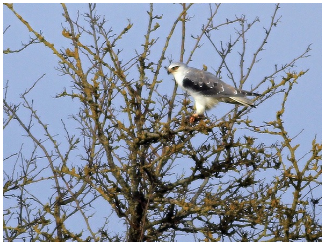
Fig. 21. — Élanion blanc ( Elanus caeruleus ), Montreuil-Bellay, 18 décembre 2012 (Thomas Duval).

Montreuil-Bellay : 28 octobre au 2 janvier, 1 juvénile, Prés Bertault (P. Raboin, J.-M. Bottereau, V. Motteau, F. Leblois, É. Beslot..., fig. 21).