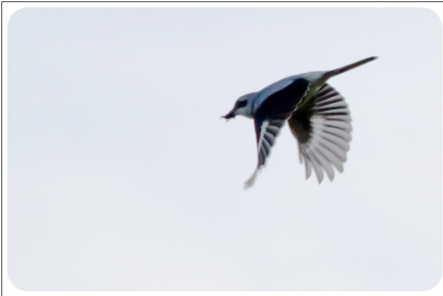
Fig. 13. — Pie-grièche grise ( Lanius excubitor ), Tiercé, 11 novembre 2011 (Jean-Luc Ronné).