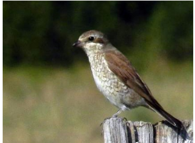
Fig. 32. — Pie-grièche écorcheur ( Lanius collurio ), Chartrené, 4 septembre 2012 (Mickaël Jumeau).

La Breille-les-Pins : 14 mars, 1 individu ssp. , le Mortier des Brise-Fouasses (Y. Guenescheau et al. ).