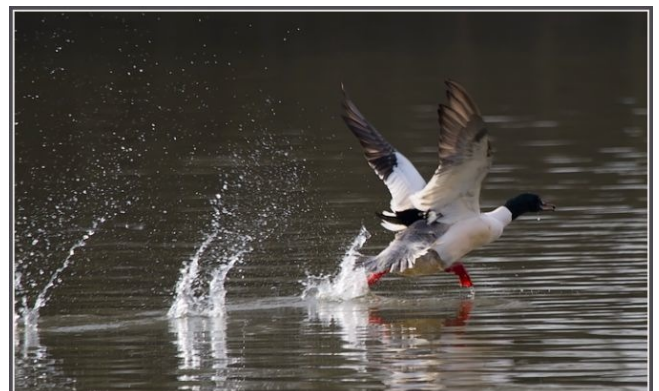
Fig. 17. – Harle bièvre ( Mergus merganser ), Cantenay-Épinard, 22 février 2012 (Jean-Luc Ronné).