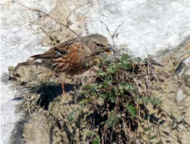
Fig. 31. — Accenteur alpin ( Prunella collaris ), Montjean-sur-Loire, 7 février 2012 (Jean-Claude Beaudoin).

Montjean-sur-Loire : 4 au 10 février, 2 à 4 individus, Châteaupanne (L. Bellion, J.-Cl. Beaudoin, D. Farges, J. Lâiné, P. Bellion, fig. 31).