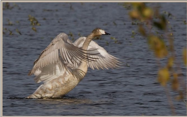
Fig. 1. — Cygne chanteur ( Cygnus cygnus ), Chênehutte-Trèves-Cunault, 14 novembre 2011.

Chênehutte-Trèves-Cunault - Saint-Clément-des-Levées - Saint-Martin-de-la-Place : 11 novembre au 23 décembre, 2 individus de 1 er hiver, Loire (F. Rayer et al. , fig. 1).