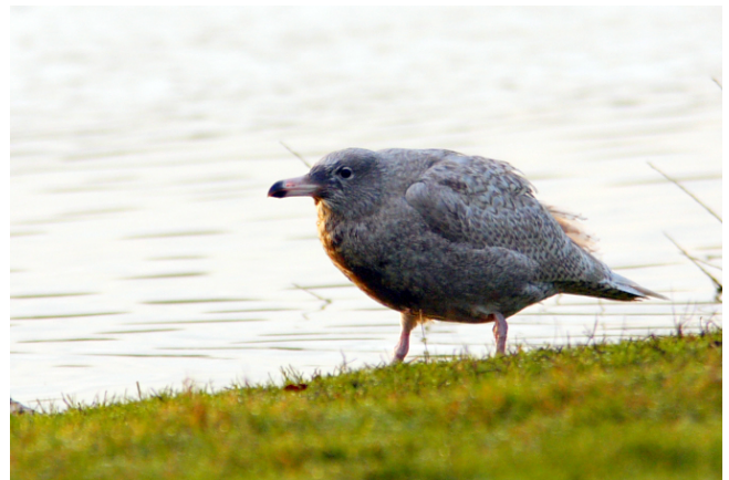
Fig. 7. — Goéland bourgmestre ( Larus hyperboreus ), Champtocé-sur-Loire, 10 janvier 2011 (Pascal Bellion).

Saint-Germain-des-Prés : 27 mars, 1 individu de 1 er hiver, boire Boileau (Fr. Recoquillon).