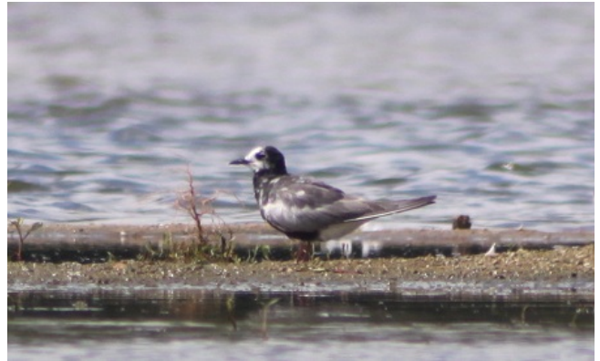
Fig. 10. — Guifette leucoptère ( Chlidonias leucopterus ), La Ménitré, 12 août 2011 (Fabrice Rayet).

Angers : 13 au 22 novembre, 1 individu, cathédrale (É. Beslot, J.-Cl. Beaudoin, A. Fossé, O. Loir, P. Bizien).