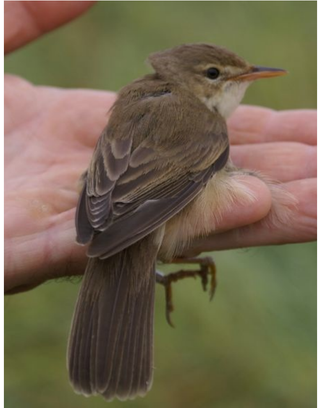
Fig. 11. — Rousserolle verderolle ( Acrocephalus palustris ), Soulaire-et-Bourg, 12 juin 2011 (Édouard Beslot).

Verrie : 26 novembre, 1 mâle, hippodrome (S. Courant, S. Desgranges, D. Sarrey, M. Guet, M. Jumeau).