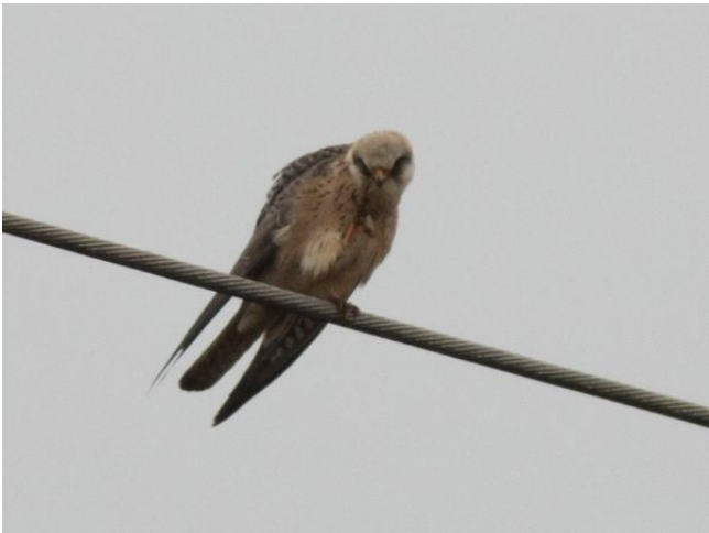
Fig. 22. — Faucon kobez ( Falco vespertinus ), Montreuil-Bellay, 19 mai 2012 (Willy Maillard).

Montreuil-Bellay : 19 au 22 mai, 1 femelle, ruines du Touraga (Fr. Recoquillon, W. Maillard, E. Guillou, fig. 22).