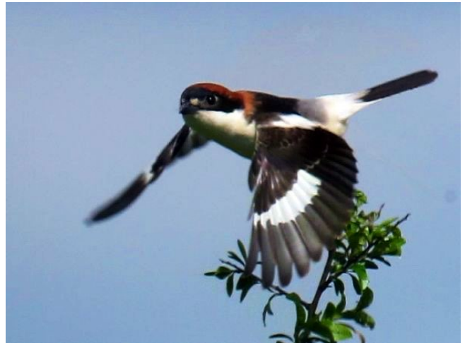
Fig. 49. — Pie-grièche à tête rousse ( Lanius senator ) Morannes, 28 avril 2014 (Alain Fossé).

Saint-Christophe-la-Couperie : 12 avril au 1 er mai, 1 chanteur, le Lattay (L. Bellion et al. , fig. 48 ).