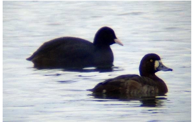
Fig. 2. — Fuligule milouinan ( Aythya marila ), Longué-Jumelles, 28 novembre 2013 (Mickaël Jumeau).

Longué-Jumelles - Vivy : 22 novembre au 2 mar, 1 femelle, les Youis-les Monteaux (J. Pelé et al. , fig. 2 ).