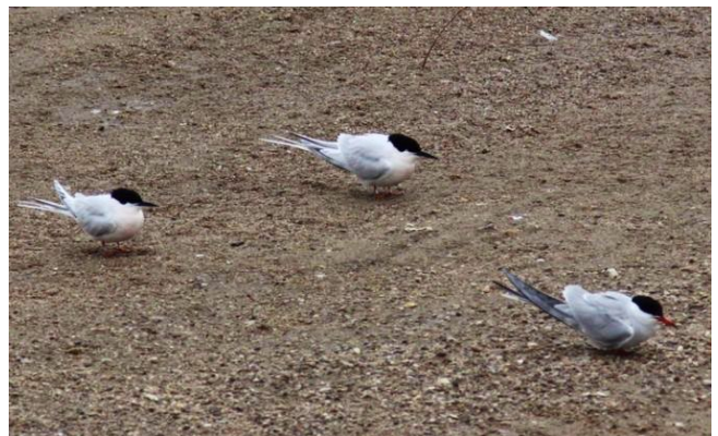
Fig. 16. — Sternes de Dougall ( Sterna dougallii ), Montsoreau, 14 mai 2013 (Jean-Claude Beaudoin).

Montsoreau : 14 mai, 2 adultes, île (D. Rochier et al. , fig. 16 ).