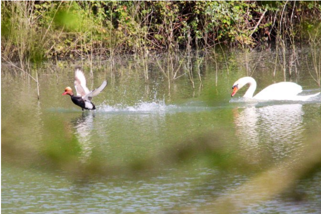
Fig. 25. – Nette rousse ( Netta rufina ) Montreuil-sur-Loir, 12 avril 2014 (Jean-Paul Le Mao).

Thorigné-d'Anjou : 24 septembre, 1 type femelle, carrière de Chauvon (Br. Charpentier).