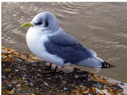
Fig. 41. — Mouette tridactyle ( Rissa tridactyla ) Saumur, 2 février 2014.