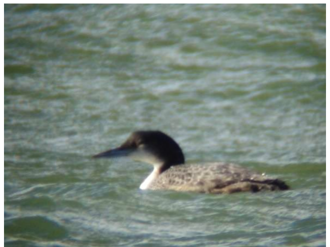
Fig. 32. — Plongeon imbrin ( Gavia immer ) Longué-Jumelles, 8 février 2014.