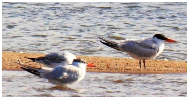
Fig. 43. — Sternes caspiennes ( Hydroprogne caspia ) Saint-Mathurin-sur-Loire, 28 août 2014 (Gilbert Mauchauffée).