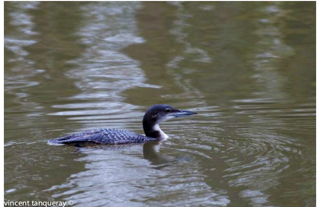
Fig. 31. — Plongeon imbrin ( Gavia immer ) Angers-Bouchemaine, 20 janvier 2014 (Vincent Tanqueray).

Ingrandes : 21 décembre, 1 ind., Loire (Fr. Recoquillon).