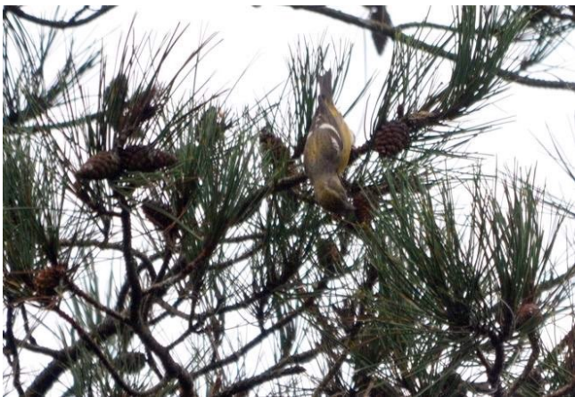
Fig. 22. — Bec-croisé bifascié ( Loxia pytyopsittacus ) Savennières, 13 novembre 2013.

Savennières : 10 au 15 novembre, 1 femelle, bois du Ricohet (D. et P. Bizien et al. , in KAYSER, VERNEAU, CHN, 2015, fig. 22 ).