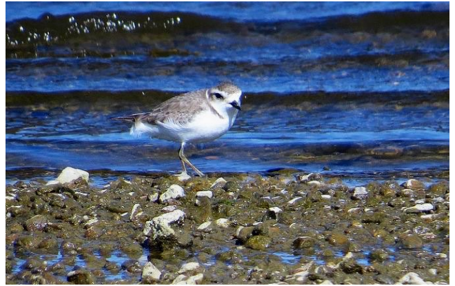
Fig. 35. — Gravelot à collier interrompu ( Charadrius alexandrinus ) Béhuard, 16 mai 2014 (Didier Bizien).

Béhuard : 15 au 17 mai, 1 femelle, plage (D. et P. Bizien et al. , fig. 35 ).