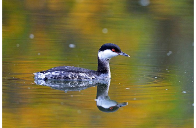
Fig. 6. — Grèbe esclavon ( Podiceps auritus ), Angers-Bouchemaine, 4 décembre 2013 (Patrick Bironneau).

Angers-Bouchemaine : 27 novembre au 12 décembre, 1 ind. (2 le 3 février), lac de Maine (O. Loir et al. , fig. 6 ).