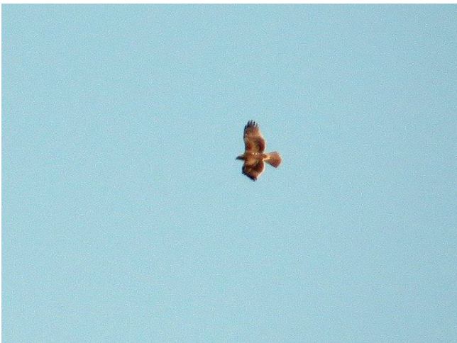
Fig. 9. — Aigle de Bonelli ( Aquila fasciata ), Saint-Georges-sur-Loire, 3 novembre 2013 (Didier Bizien).

Saint-Georges-sur-Loire : 3 novembre, 1 juvénile, Chevigné (D. et P. Bizien, A. Ruchaud, fig. 9 ).