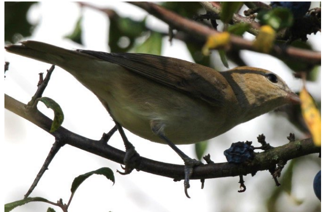
Fig. 52 – Fauvette des jardins ( Sylvia borin ) Sainte-Georges-des-Gardes, 21 septembre 2014 (Jean-Paul Le Mao).

Écouflant : 3 février, 1 ind., la Pinterie (S. Bertru).