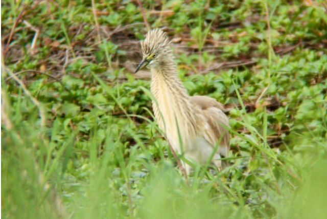
Fig. 51 – Crabier chevelu ( Ardeola ralloides ) Sainte-Gemmes-sur-Loire, 17 septembre 2014.

Sainte-Gemmes-sur-Loire : 16 au 19 septembre, 1 ind., Port Thibault (S. Bertru, fig. 51 ).