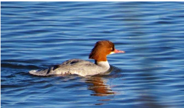
Fig. 5. — Harle bièvre ( Mergus merganser ), Angers-Bouchemaine, 29 décembre 2013 (Didier Bizien).

Angers-Bouchemaine : 26 décembre au 6 janvier, 1 type femelle, lac de Maine (P. Bizien et al. , fig. 5 ).