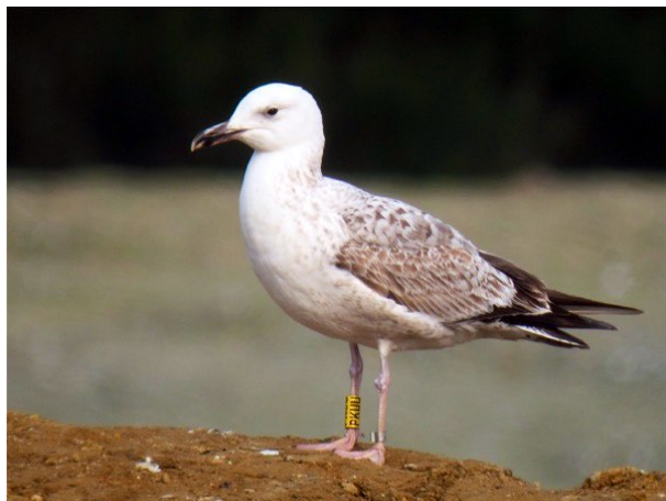
Fig. 13. — Goéland pontique ( Larus cachinnans ), Champteussé-sur-Baconne, 28 mars 2013 (Alain Fossé).

28 janvier au 5 février, 1 3A, CET (A. Fossé); 5 février, 1 adulte, CET (A. Fossé); 5 au 18 février, 1 4A, CET (A. Fossé); 5 mars, 1 2A, CET (A. Fossé, J.-Cl. Beaudoin); 13 mars au 15 juillet, 1 ind. 3A bagué jaune PHLD en Pologne, CET (A. Fossé, Fr. Recoquillon); 15 mars, 1 ind. 2A non bagué, CET (A. Fossé, J.-Cl. Beaudoin); 15 au 20 mars, 1 ind. 2A non bagué, CET (A. Fossé, J.-Cl. Beaudoin); 15 mars au 11 avril, 1 ind. 3A non bagué, CET (A. Fossé, J.-Cl. Beaudoin); 20 au 28 mars, 1 ind. 2A bagué métal à G, CET (A. Fossé, Fr. Recoquillon); 20 mars, 1 ind. 2A non bagué, CET (A. Fossé); 20 mars, 1 ind. 2A non bagué, CET (A. Fossé); 28 mars, 1 ind. 2A bagué jaune PKUU en Pologne, CET (A. Fossé, Fr. Recoquillon, fig. 13 ); 28 mars, 1 ind. 3A non bagué, CET (A. Fossé, Fr. Recoquillon); 4 au 11 avril, 1 2A, revu le 13 avril au lac de Maine, CET (W. Raitière, A. Fossé); 4 avril, 1 2A bagué vert XNCD en Allemagne, CET (W. Raitière); 4 avril 1 3A, CET (W. Raitière); 13 novembre, 1 H3, CET (Fr. Recoquillon); 19 novembre, 1 1A bagué jaune PNNL en Pologne, CET (A. Fossé, D.Bizien).