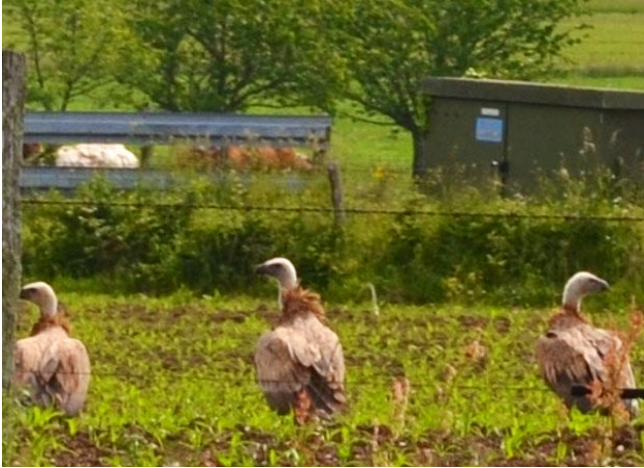
Fig. 8. — Vautour fauve ( Gyps fulvus ), Bourgneuf-en-Mauges, 8 juin 2013 (Dominique Drouet).

Sainte-Christine : 10 juin, 2 ind., Martreil (G. de Rougé).