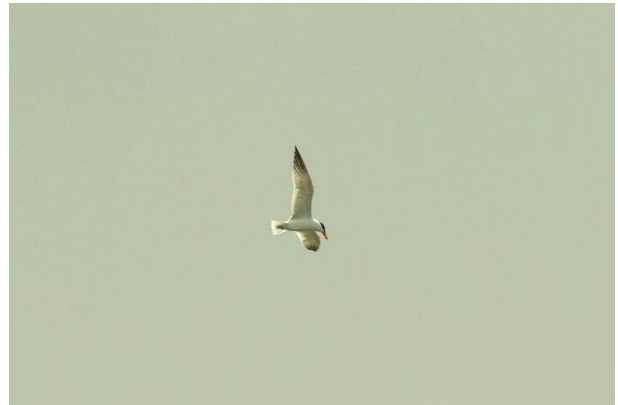
Fig. 15. — Sterne caspienne ( Hydroprogne caspia ), La Possonnière, 6 avril 2013 (Francky Recoquillon).

Sainte-Gemmes-sur-Loire : 12 septembre, 1 ind., école militaire (D. Bizien).