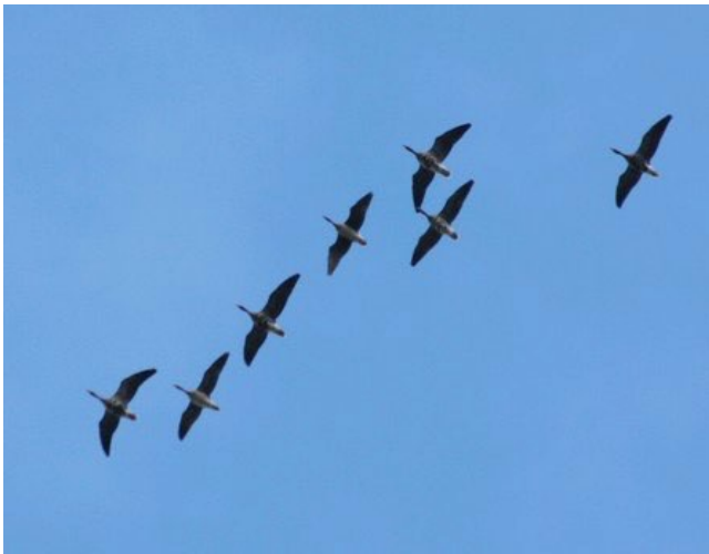
Fig. 1. — Oies rieuses ( Anser albifrons ), Angers, 15 novembre 2013 (Sébastien Bertru).

Angers : 15 novembre, 23 ind., la Tournerie (S. Bertru, fig. 1 ).