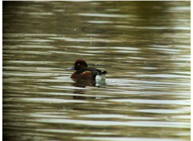
Fig. 27. – Fuligule nyroca ( Aythya nyroca ) Angers-Bouchemaine, 22 novembre 2014 (Jean-Luc Reuzé).