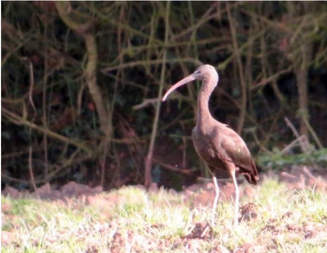
Fig. 33. — Ibis falcinelle ( Plegadis falcinellus ) Angers-Bouchemaine, 13 février 2014 (Didier Bizien).

Sainte-Gemmes-sur-Loire - Angers - Bouchemaine : 17 mars au 7 mai, 1 2A, la Baumette-lac de Maine (Th. Ott et al. , fig. 34 ).