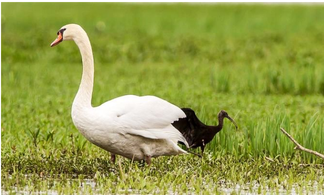
Fig. 34. — Ibis falcinelle ( Plegadis falcinellus ) Angers-Bouchemaine, 4 avril 2014 (Stéphane Nevier).