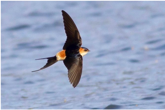
Fig. 17. — Hirondelle rousseline ( Cecropis daurica ), Bouchemaine, 9 avril 2013 (Jean-Luc Ronné).

Bouchemaine : 9 et 10 avril, 1 individu, la Pointe (É. Beslot et al. , fig. 17 ).