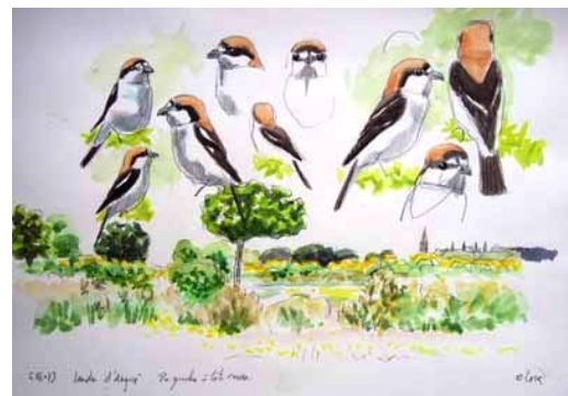
Fig. 19. — Pie-grièche à tête rousse ( Lanius senator ) Angrie, 6 juin 2013.

Angrie : 6 juin, 1 ind., la Casnière (O. Loir, fig. 19 ).