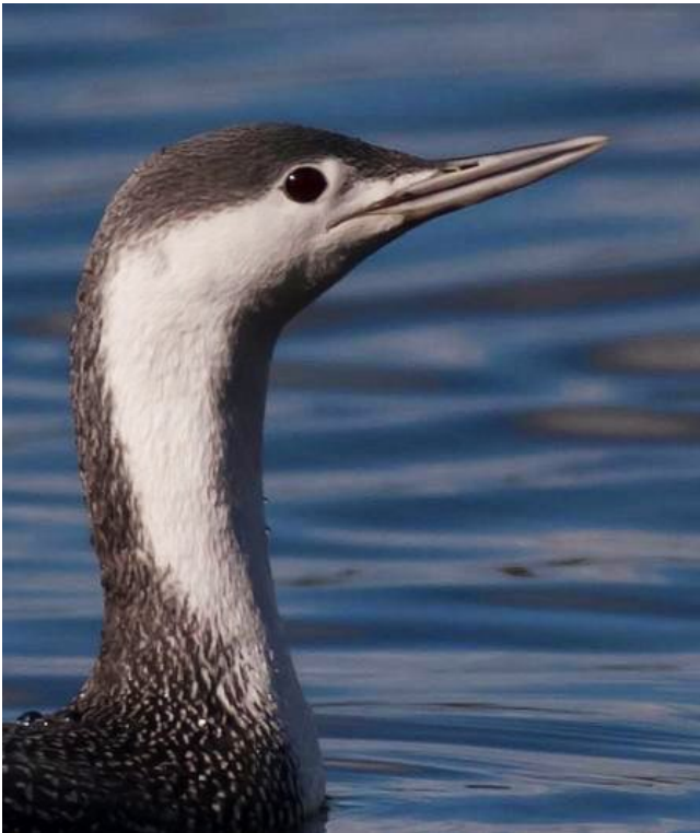
Fig. 29. — Plongeon catmarin ( Gavia stellata ) Saint-Georges-sur-Loire, 26 février 2014.

Saint-Georges-sur-Loire : 4 février au 29 mars, 1 adulte, étang de Chevigné (D. Bizien et al. , fig. 29 ).