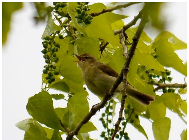
Fig. 48. — Pouillot ibérique ( Phylloscopus ibericus ) Saint-Christophe-la-Couperie, 18 avril 2014 (André Robert).