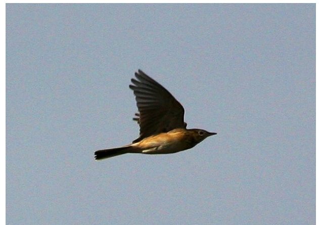
Fig. 46. — Pipit de Richard ( Anthus richardi ) Montreuil-Bellay, 24 octobre 2014 (Grégoire Duffez).