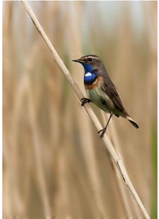
Fig. 47. — Gorgebleue à miroir ( Luscinia svecica ) Soulaire-et-Bourg, 5 mai 2014 (Jean-Luc Ronné).

Saumur : 18 janvier, 1 ind., Beaulieu (Fl. Berjamin).