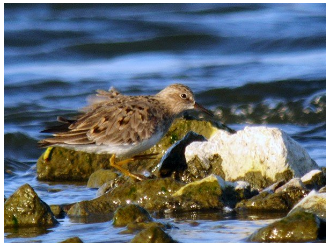
Fig. 36. — Bécasseau de Temminck ( Calidris temminckii ) Béhuard, 17 mai 2014 (Alain Fossé).

Montjean-sur-Loire : 2 au 7 septembre, 1 juvénile, pont (D. Bizien et al. , fig. 37 ).