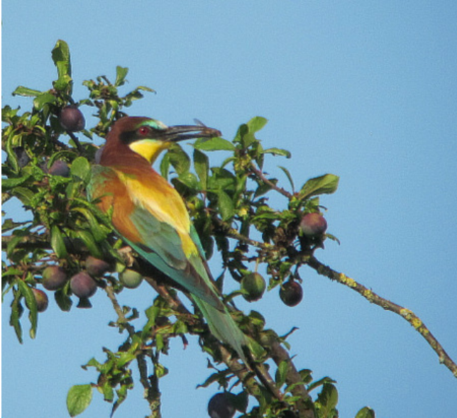
Fig. 45. — Guêpier d'Europe ( Merops apiaster ) Gennes, 17 juillet 2014.

Gennes : 9 juin au 15 août, 1 couple et 5 poussins, le Ragot (J. Tudoux et al. , fig. 45 ).