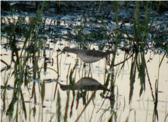
Fig. 11. — Chevalier stagnatile ( Tringa stagnatilis ), Chalonnnes-sur-Loire, 24 avril 2013.

Chalonnnes-sur-Loire : 24 avril, 2 ind., l'Onglée (G. Gaschet et al. , fig. 11 ).