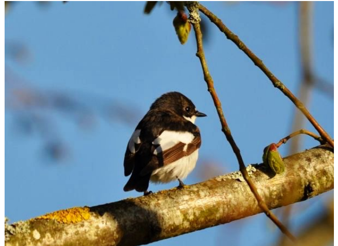
Fig. 21. — Gobemouche noir ( Ficedula hypoleuca ) Montreuil-Bellay, 14 avril 2013 (Joël Tudoux).

Montreuil-Bellay : 14 avril, 1 mâle, la Houdinière (J. Tudoux, fig. 21 ).