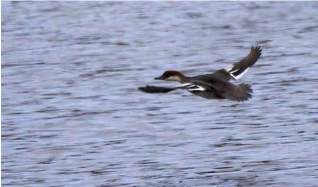
Fig. 4. — Harle piette ( Mergellus albellus ), Montreuil-sur-Loir, 7 février 2013 (Jean-Luc Ronné).

Montreuil-sur-Loir : 23 janvier au 18 février, 1 puis 2 (à partir du 3 février) type femelle, la Charpenterie (S. Bertru et al. , fig. 4 ).