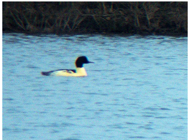
Fig. 28. – Harle bièvre ( Mergus merganser ) Montjean-sur-Loire, 7 décembre 2014.

Montjean-sur-Loire : 7 décembre, 1 mâle, le Sol de Loire (Fr. Recoquillon, fig. 28 ).