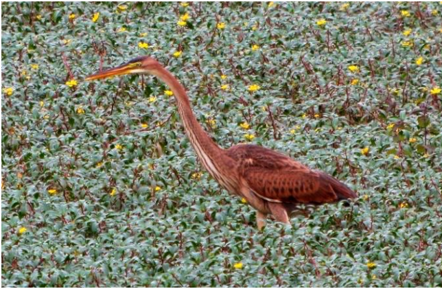
Fig. 20. — Héron pourpré ( Ardea purpurea ) La Possonnière, 2 octobre 2013 (Guy Gaschet).