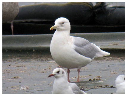
Fig. 40. — Goéland à ailes blanches ( Larus glaucooides ) Champteussé-sur-Baconne, 15 janvier 2014 (Alain Fossé).