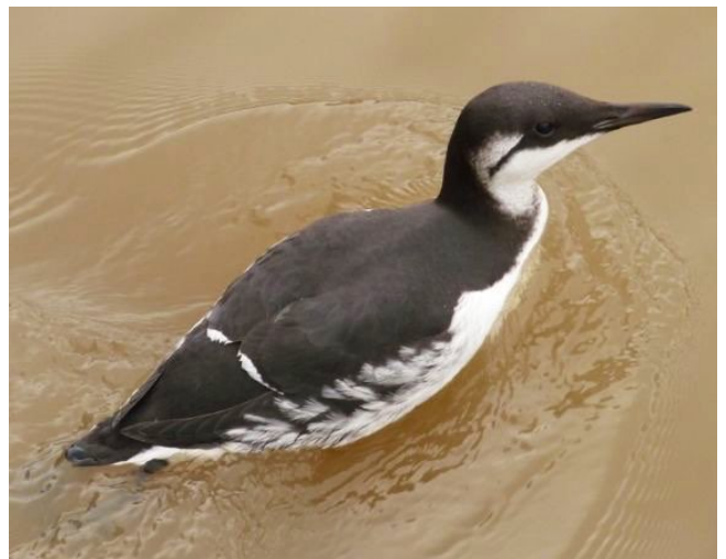
Fig. 44. — Guillemot de Troil ( Uria aalge ) La Varenne, 15 février 2014 (M. et T. Pluchon).

Bouchemaine : 14 février, 1 adulte, la Pointe (S. Havet, É. Beslot, B. Marchadour).