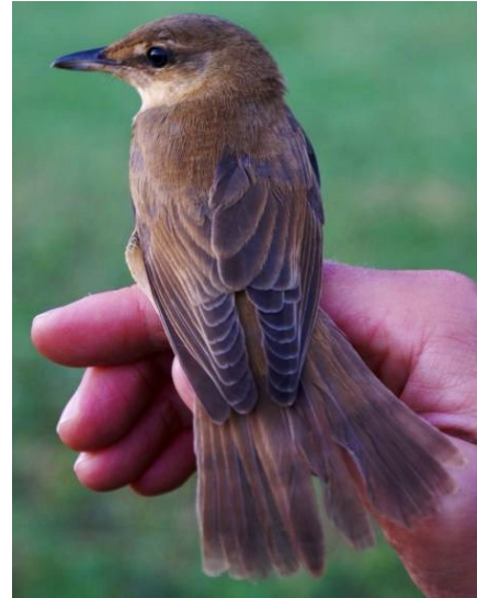
Fig. 18. — Rousserolle turdoïde ( Acrocephalus arundinaceus ), Soulaire-et-Bourg, 15 août 2013 (Édouard Beslot).