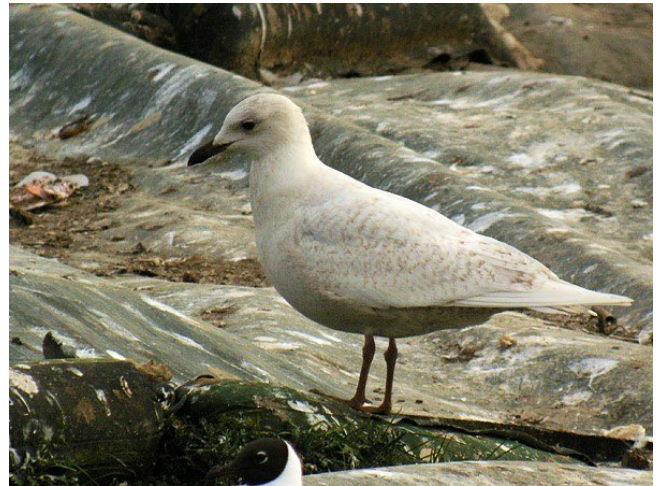
Fig. 14. — Goéland à ailes blanches ( Larus glaucooides ), Champteussé-sur-Baconne, 5 mars 2013 (Alain Fossé).

Angers-Bouchemaine - Champteussé-sur-Baconne : 23 février au 10 mars, 1 2A, lac de Maine et CET (Fr. Recoquillon et al. , fig. 14 ).