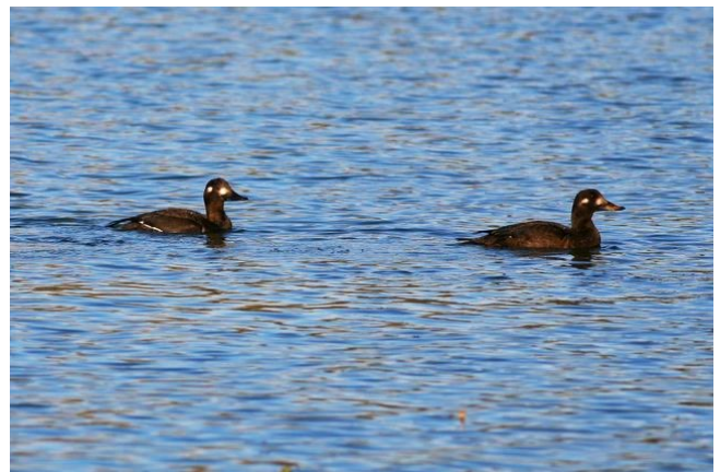
Fig. 3. — Macreuses brunes ( Melanitta fusca ), Angers-Bouchemaine, 26 novembre 2013 (Grégoire Duffez).

La Tessoualle-Maulévrier : 27 janvier, 1 femelle adulte, lac du Verdon (J.-D. Vrignault, J.-M. Logeais, É. Van Kalmthout).