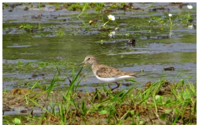
Fig. 10. — Bécasseau de Temminck ( Calidris temminckii ), Saint-Germain-des-Prés, 3 mai 2013 (Didier Bizien).

Varenes-sur-Loire : 3 octobre, 1 ind., Gaure (S. Courant).