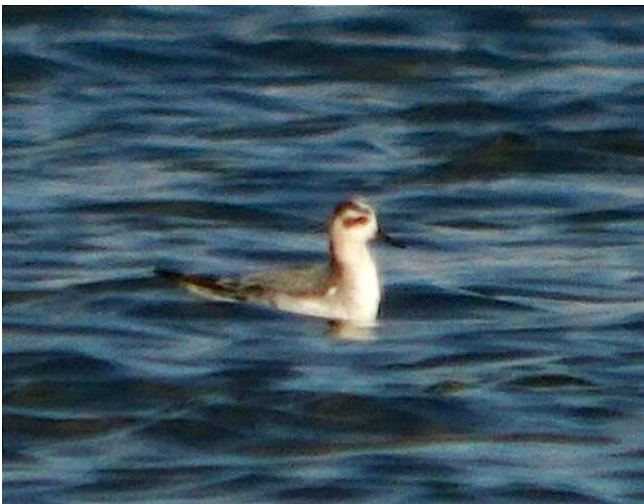
Fig. 38. — Phalarope à bec large ( Phalaropus fulicarius ) Angers-Bouchemaine, 10 novembre 2014.

Angers-Bouchemaine : 9 au 11 novembre, 1 ind., lac de Maine (D. Bizien et al. , fig. 38).