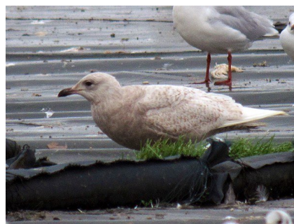
Fig. 39. — Goéland à ailes blanches ( Larus glaucooides ) Champteussé-sur-Baconne, 15 janvier 2014 (Alain Fossé).

La Tessoualle-Maulévrier : 2 février, 1 adulte (celui du lac de Maine ?), lac du Verdon (A. Fossé et al. ).