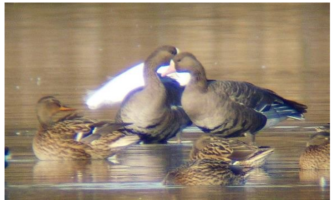
Fig. 23. — Oies rieuses ( Anser albifrons ) Brion - Longué-Jumelles, 23 novembre 2014 (Mickaël Jumeau).

Angers : 30 décembre au 7 janvier, 5-9 ind., l'île Saint-Aubin (Ch. Tessier, J.-Cl. Beaudoin, M. Aubry).