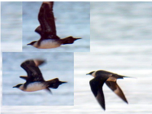
Fig. 12. — Labbe parasite ( Stercorarius parasiticus ), La Daguinière, 9 juillet 2013.

La Bohalle-La Daguinière : 9 au 14 juillet, 1 +3A, Loire (A. Fossé et al. , fig. 12 ).