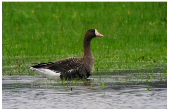
Fig. 24. — Oie rieuse ( Anser albifrons ) Sainte-Gemmes-sur-Loire, 23 novembre 2014.