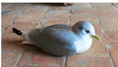
Fig. 42. — Mouette tridactyle ( Rissa tridactyla ) Briollay, 9 février 2014.