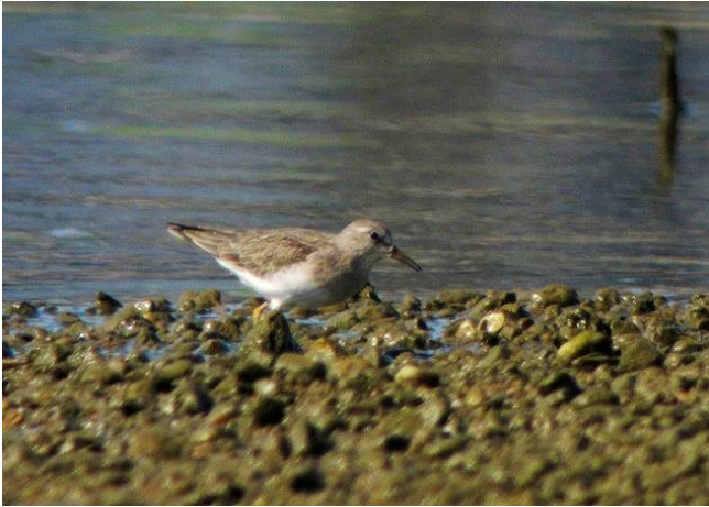
Fig. 37. — Bécasseau de Temminck ( Calidris temminckii ) Montjean-sur-Loire, 2 septembre 2014 (Didier Bizien).