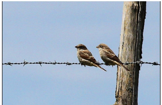
Fig. 50. — Pie-grièche à tête rousse ( Lanius senator ) La Tessoualle, 14 juillet 2014.