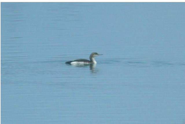
Fig. 30. — Plongeon arctique ( Gavia arctica ) Montjean-sur-Loire, 8 décembre 2014.

Montjean-sur-Loire : 8 décembre, 1 1A, le Sol de Loire (Fr. Recoquillon, fig. 30 ).