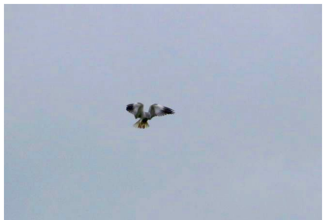
Fig. 7. — Élanion blanc ( Elanus caeruleus ), Le Louroux-Béconnais, 23 avril 2013 (Didier Bizien).

Cléré-sur-Layon : 1 er juin au 25 août, 1 couple élève 3 jeunes (J.-M. Logeais et al. ).