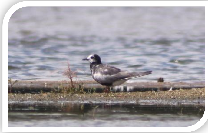
Guifette leucoptère, La Ménitré, le 12.8.2011

Guifette leucoptère Chlidonias leucopterus * : 1 ad. du 12 au 14.8 à l'aval de l'île de Baure/La Ménitré-Le Thoureil (CHD+).