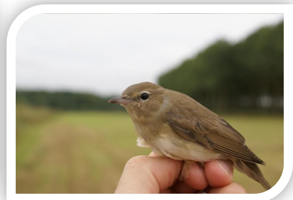
Fauvette des jardins

Soulaire-et-Bourg, août 2011