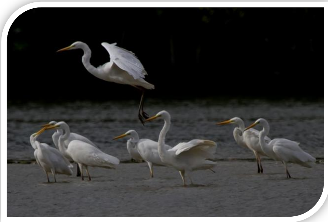
Grandes Aigrettes, Seiches-sur-le-Loir, 10.9.2011

Grande Aigrette Casmerodius albus : maximum de 30 ind. à Bré le 10.9. Les lectures de bagues concernent 22 oiseaux d'origine française.