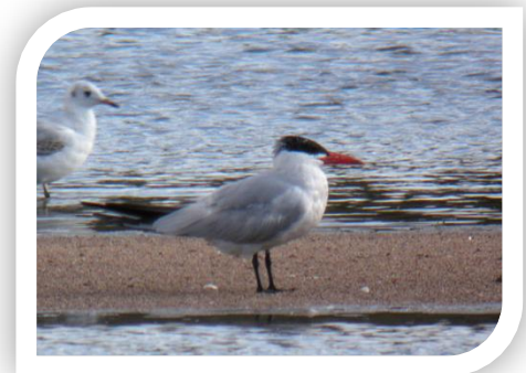
Sterne caspienne, Denée, 28.8.2011

Sterne caspienne Hydroprogne caspia * : au moins 9 individus : à la Pointe/Bouchemaine — Sainte-Gemmes-sur-Loire — Denée, 1 adulte du 28.8 au 1.9 (CHD+), 1 autre adulte le 2.9 au même endroit (CHD+), 1 ind. le 16.9 (CHD+) ; au lac du Verdon, 2 individus du 1 au 4.9 (CHD+), 1 adulte bagué du 6 au 10.9 (CHD+), 1 ind. non bagué les 14-15.9 (CHD+) ; à l'étang de la Godinière, 1 ad. et 1 imm. le 15.9 (CHD+).