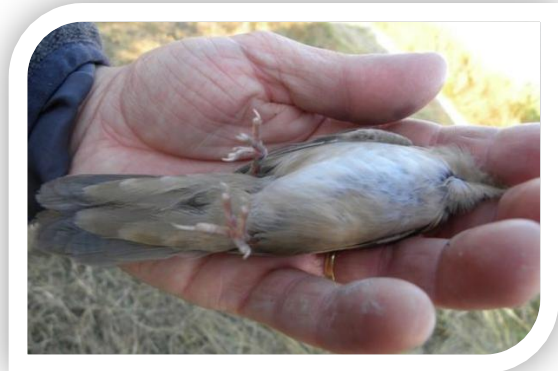
Locustelle lusciniöide, Soulaire-et-Bourg, 1.8.2011 Notez la longueur des sous-caudales et l'absence de taches.