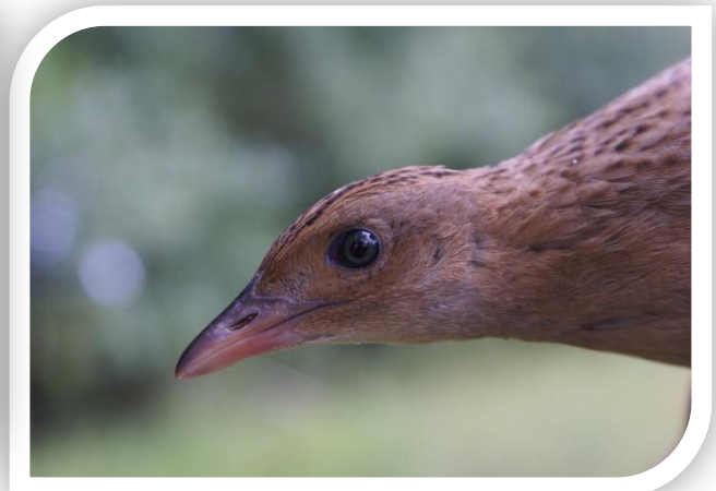
Jeunes Râles des genêts sauvés lors des fauche dans les BVA, juillet 2011 – É. Beslot (à g. poussins de 15 jours ; à d. jeune âgé de 30-35 jours)