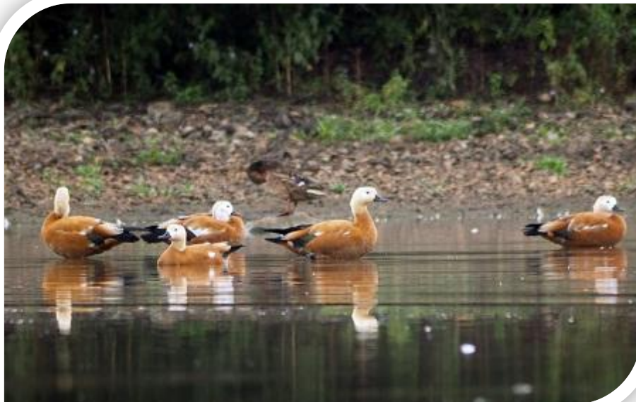
Tadornes casarcas, Seiches-sur-le-Loir, 17.8.2011

Tadorne casarca Tadorna ferruginea : 5 à 6 ind. à Bré entre les 16 et 22.8.