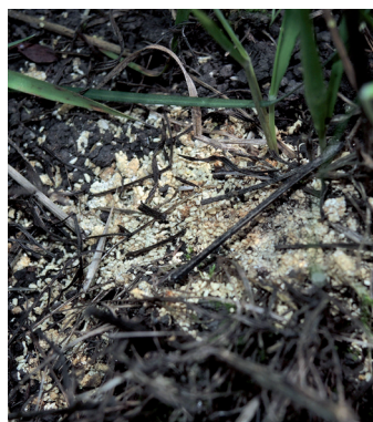
Fèces de chenille