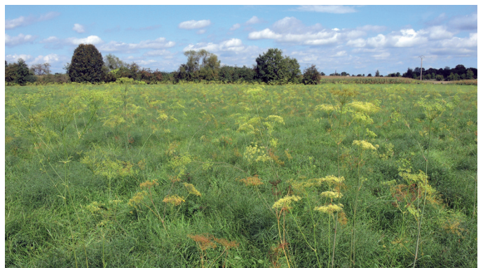
Habitat de la Noctuelle des Peucédans dans le Ried du Dachsbach (67)