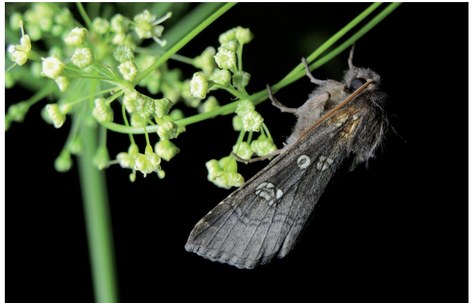
Papillon adulte sur un pied de Peucedan officinal