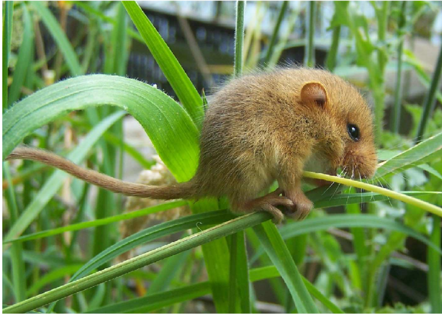
Photo: muscardin sur la commune de Versailleux 2008