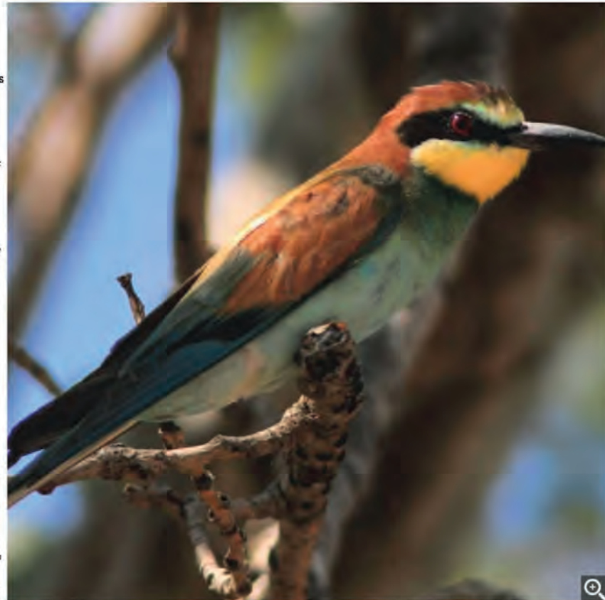
Le guépier d'Europe, un oiseau au plumage magnifique visible au plan d'eau de Saint-Cyr.