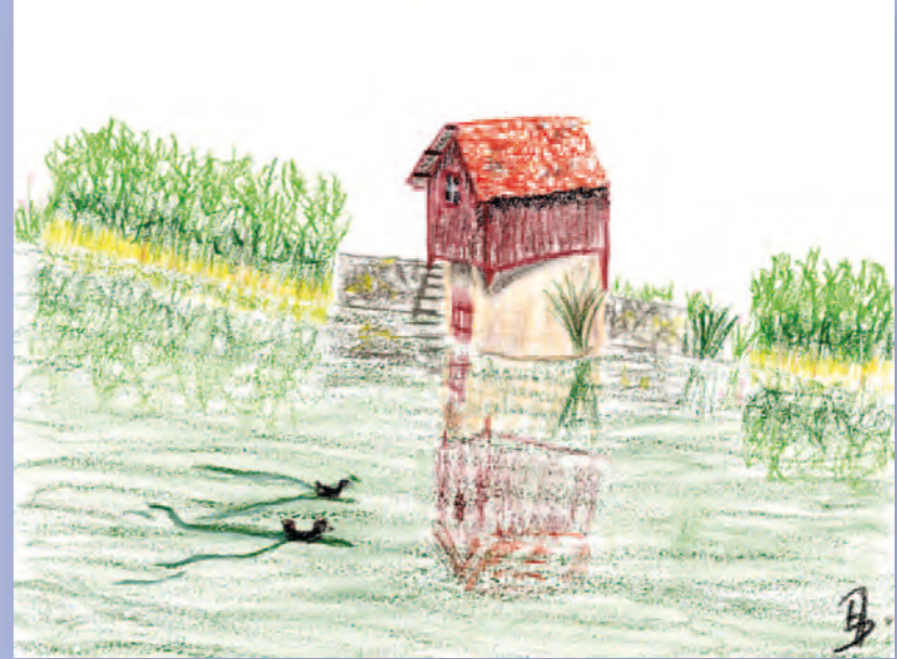
▲ Catégorie enfants 1 er prix - Chaussée d'étang Adélie Dubois (11 ans)