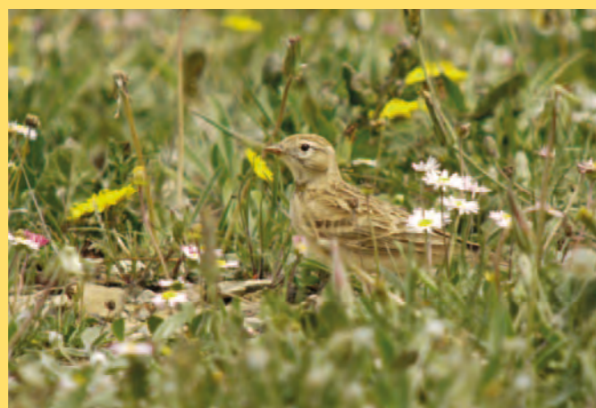
Alouette calandrelle. Texte : Thomas Williamson

Les courtes strophes de la calandrelle sont déjà repérées alors que la voiture roule encore lentement sur un petit chemin de terre... Nous sommes le 4 juillet par une belle fin d'après-midi. Quelle surprise de la retrouver aussi facilement au même endroit que le 26 mai ! La reproduction de cette petite alouette des zones arides a pu être prouvée aux alentours de Neuville-de-Poitou dans les années 1990. Depuis, son statut reste flou faute de recherches spécifiques.