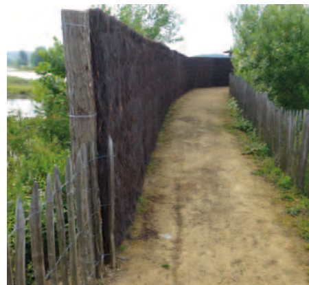
Accès au 2 e observatoire du sentier libre de la réserve ornithologique de Saint-Cyr.