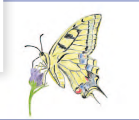
Catégorie adultes/ados Machaon ▼ Alain Boullah