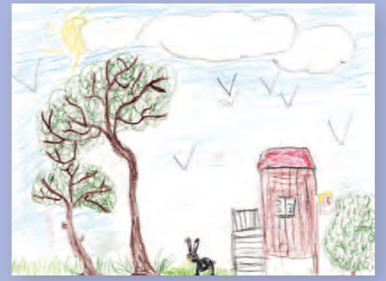
Catégorie enfants Paysage Cosima Dubois (7 ans)