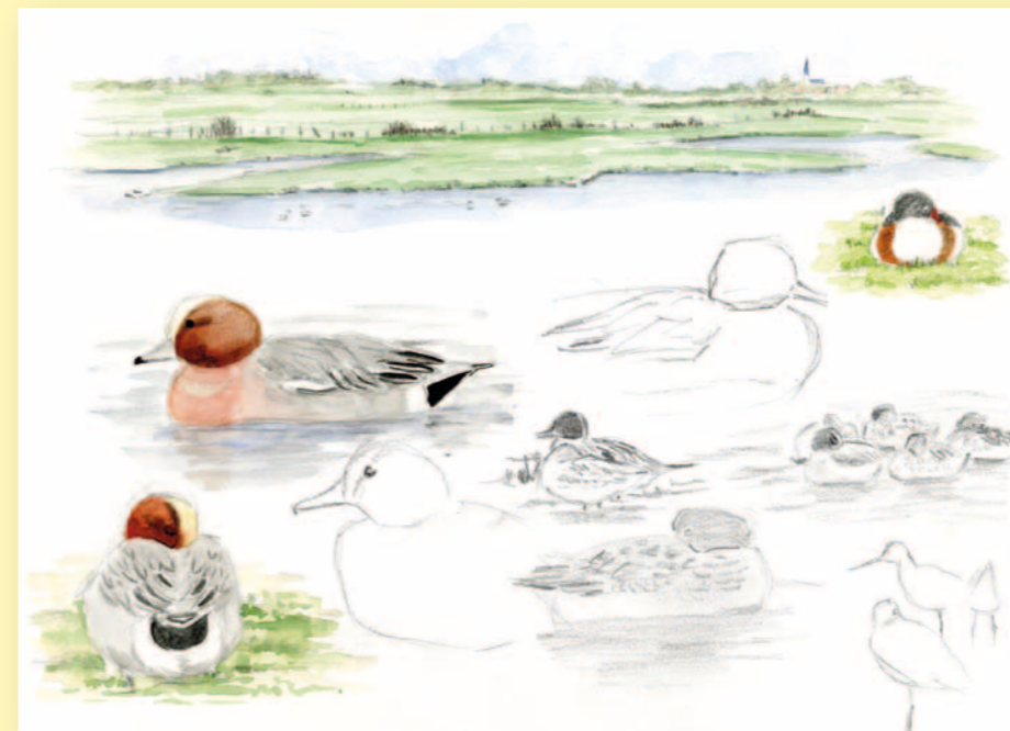
Canards siffleurs et tadorne de Belon, dessinés lors d'un stage de dessin avec Olivier Loir à la réserve de Saint-Denis-du-Payré en Vendée. Dessin : Katia Lipovoï

Je me souviens que ma première illustration pour le bulletin du GOV était une buse que j'ai réalisée à l'encre de Chine, en n'oubliant aucun détail, sur un format A4 ! J'ai dû mettre plusieurs mois à le réaliser. Mon rêve ? Arriver à dessiner les oiseaux dans la nature. Mais il faut beaucoup beaucoup de pratique. J'ai la chance de faire de nombreuses sorties, des voyages, mais il y a tellement de choses à découvrir, à observer, que je ne peux que prendre des photos, de paysages, d'oiseaux qui me plaisent ; ces photos, même ratées, me serviront plus tard à reproduire un instant de nature qui m'a particulièrement émue.