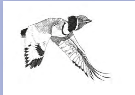
▲ Catégorie adultes/ados Outarde canepetière Laurent Bourdin