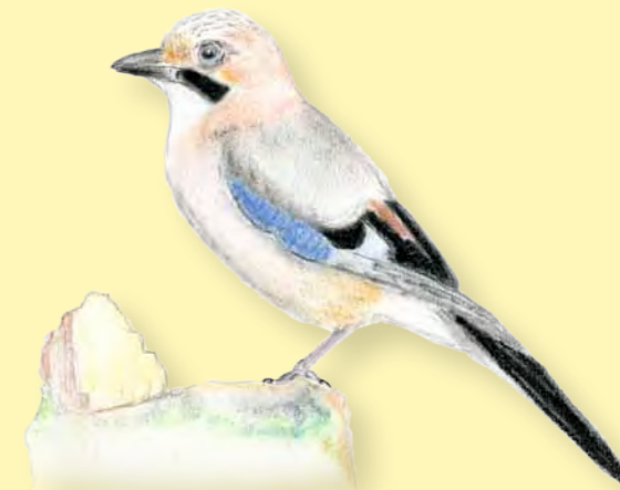
Geai des chênes. Dessin: Elizabeth Moreau

Furtif, l'oiseau a disparu dans la frondaison, nous gratifiant d'un ricanement rauque. Gros comme un pigeon, le geai est passé, insaisissable. Son patronyme latin, Garrulus glandarius , le dénonce comme un « bavard » impénitent ( garrulus ) et un « producteur de glands » ( glandarius ).