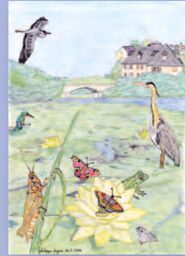
▲ Catégorie adultes/ados Paysage Philippe Doyen