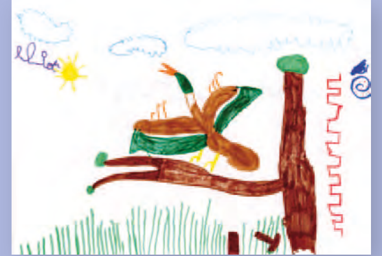
▲ Catégorie enfants Archéoptéryx - Eliot Ventroux (5 ans)