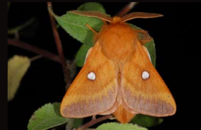
Laineuse du prunellier