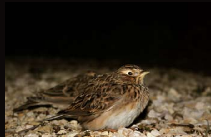
Alouettes des champs posées, en migration de nuit