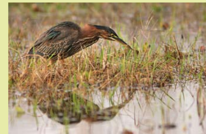
Héron vert à la recherche de lombrics.

Du 24 novembre au 4 janvier, les alentours d'Iteuil ont eu comme visiteur singulier un petit ardeïde américain, amené sans doute par une tempête : un splendide héron vert de première année. Opportuniste, il s'est gavé d'alevins dans la jussie au bord du Clain, de beaux gardons dans l'étang communal, et s'est offert des festins de lombrics dans la prairie inondée. Pour le plus grand bonheur de dizaines d'ornithologues venus des quatre coins... de l'hexagone, et même au-delà!