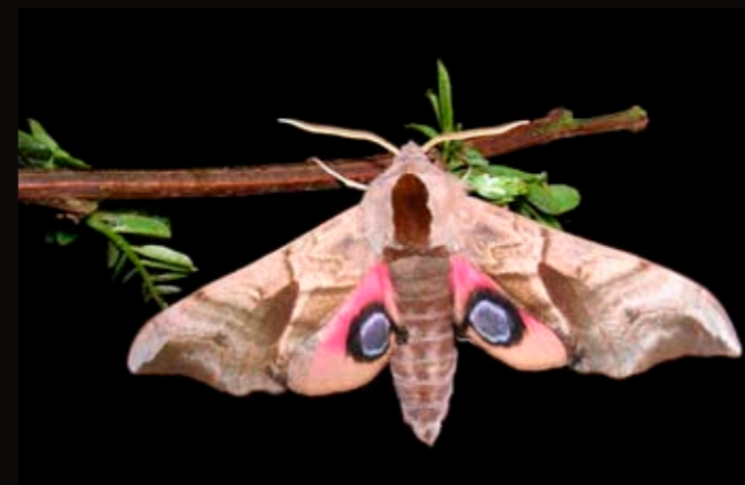
Sphinx demi-paon