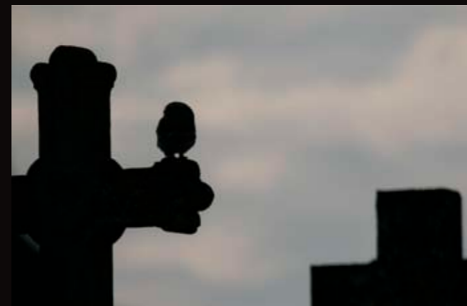
Chevêche d'Athéna