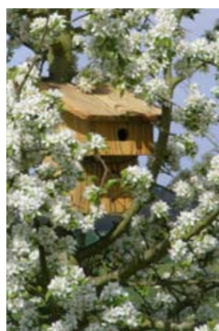
Nichoir dans un cerisier en fleurs