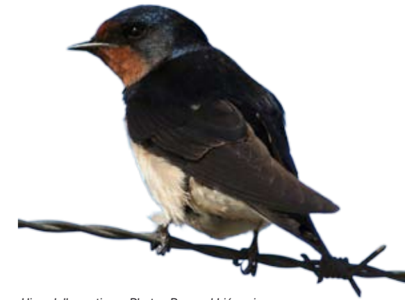
Hirondelle rustique.

Une enquête nationale sur les hirondelles débute en 2012. Objectifs : actualiser le statut de ces espèces, inciter le grand public à participer et le sensibiliser à leur protection, constituer un réseau d'observateurs réguliers pour les années à venir. Sur le terrain, pour l'hirondelle de rivage, il est prévu de visiter toutes les colonies connues mais aussi d'en rechercher de nouvelles. L'hirondelle rustique et l'hirondelle de fenêtre feront quant à elles