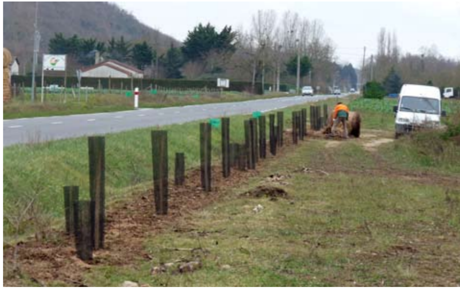
Plantation d'une haie champêtre au bord de la carrière des Terres du Vieux-Bellefonds.

4 et 5 novembre : au séminaire national de la LPO à Nancy, compte-rendu de notre participation au programme « Oiseaux des bois ». ■ 12 et 13 novembre : journées des coordinateurs « Refuges » à Paris : presque 11 000 refuges en France, représentant environ 16 000 hectares. ■ 14 novembre : rédaction du cahier des charges « mesures d'accompagnement » concernant le dérangement d'une colonie de busards cendrés proche du futur Center Parcs, dans le Loudunais. ■ 23 novembre : chantier de débardage des saules sur la prairie humide du Chambon (Lathus). ■ 23 novembre : Grandes Brandes de Lussac : 2 e phase du chantier de rajeunissement des landes sur 1 hectare. ■ 28 novembre : rencontre