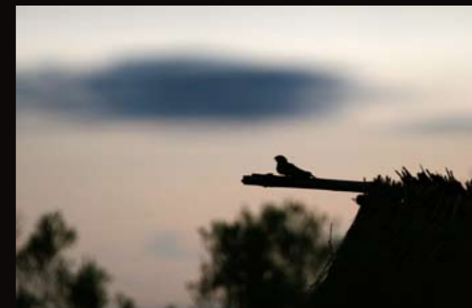
Engoulevent d'Europe