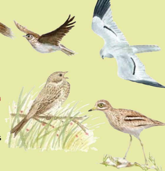
Alouettes, busards, bruants, oedicnème... tout un cortège d'oiseaux de plaine également menacés, bénéficie des mesures mises en œuvre en faveur de l'outarde. Dessins : Véronique Gauduchon et Katia Lipovoi