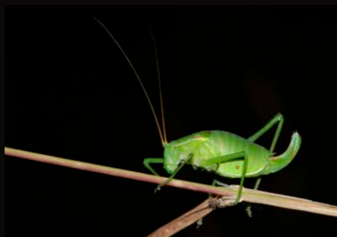
Barbitiste des Pyrénées

Retrouvez en images tous les papillons de nuit (et de jour) de la Vienne sur le site http://www.6pattes.fr/