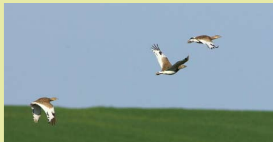
Outardes canepetières en vol.

Savez-vous que l'outarde canepetière, à l'instar du macareux pour la LPO, était l'emblème du Groupe Ornithologique de la Vienne ? Notre Poitou-Charentes est le dernier bastion français de cet oiseau migrateur et c'est là un véritable enjeu.