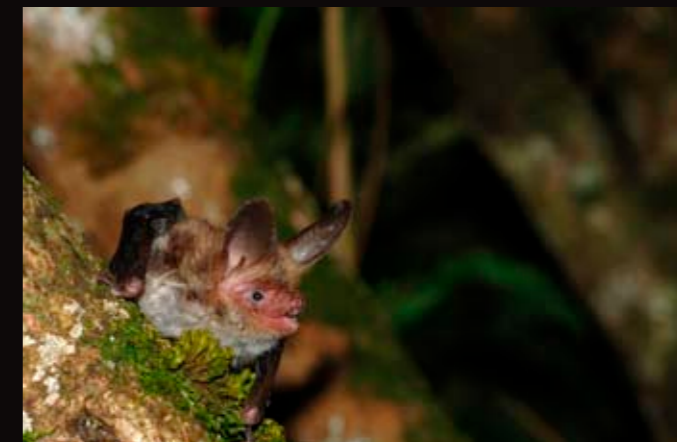
Murin de Bechstein