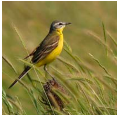
Bergeronnette printanière.

Vous recevrez bientôt une invitation et le programme complet avec le rapport d'activités de 2011. ■