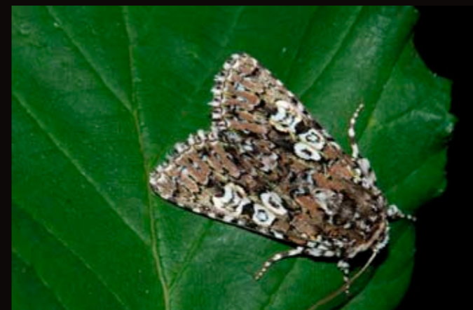
Noctuelle soignée