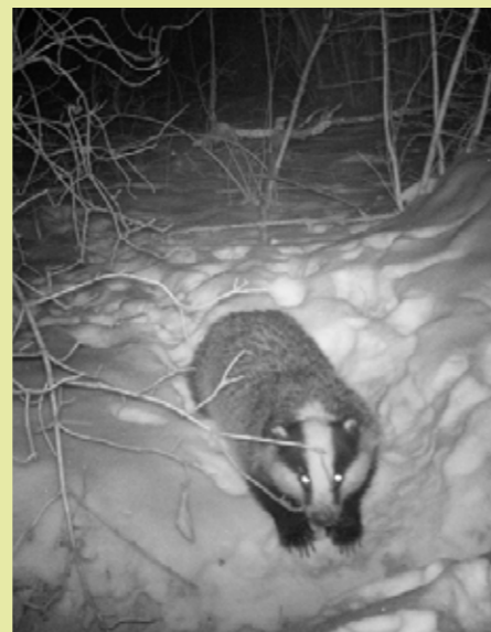
Blaireau saisi au piège photographique. Installation : Alban Pratt (Vienne Nature)

Un volet de ce projet sera entièrement dédié aux scolaires. Dix classes seront sollicitées à partir de septembre 2012 pour envisager l'étude de la faune et de ses comportements dès la nuit venue. Migrations nocturnes ; modes de chasse et de déplacements ; comment les oiseaux s'abritent pour passer la nuit ; ou comment ils gèrent l'alternance jour/nuit... sont quelques-uns des thèmes qui seront abordés. Chaque classe recevra un dossier pédagogique réalisé par Vienne Nature et la LPO