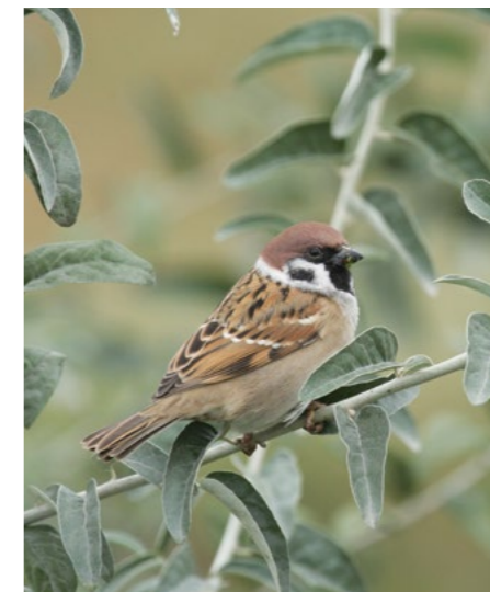
Moineau friquet.

La première année de cette enquête s'est achevée avec des promesses mais également quelques craintes. Dans la Vienne, le moineau friquet paraît de plus en plus rare (seulement une vingtaine de couples observés) mais certains secteurs semblent lui être encore favorables et méritent d'être mieux prospectés. Des demi-journées de recherche collective seront organisées au printemps. Le moineau