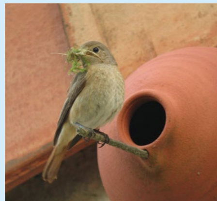
Une femelle de rougequeue à front blanc a installé ici sa nichée dans un pot à moineaux.

L'hiver est généralement le meilleur moment pour la pose ou l'entretien des niochirs afin de préparer l'installation des oiseaux au printemps suivant. Ils auront en effet le temps de repérer les lieux et de s'en accommoder. Avant toute opération d'entretien, assurez-vous que le niochir ne sert pas de gîte hivernal à des chauves-souris, des loirs ou des lérots. Le cas échéant, il ne faut surtout pas les déranger ! Sinon, si le niochir a été occupé, retirez les matériaux et faites place nette car les passereaux ne réutilisent généralement pas un ancien nid. Cela préviendra les risques de maladies ou d'invasion de parasites dans les brindilles. C'est également l'occasion de