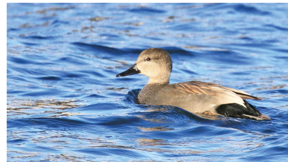
Canard chipeau mâle.

Chaque année, deux comptages sont effectués par des bénévoles de la LPO et deux par des agents de l'ONCFS. Pour l'outarde, légère diminution de l'effectif maximum : 332 en simultané le 30 septembre sur les plaines du Mirebalais-Neuvillois (86) et d'Oiron-Thénac (79), contre 366 le 1 er octobre 2016. Pour l'œdicnème, après la forte baisse enregistrée en 2016 (maximum de 1 359 individus le 13 septembre, alors que plus de 2 000