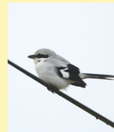
Pie-grièche grise.

Découvrez aussi toute l'année les « obs' récentes » sur viennel.lpo.fr .