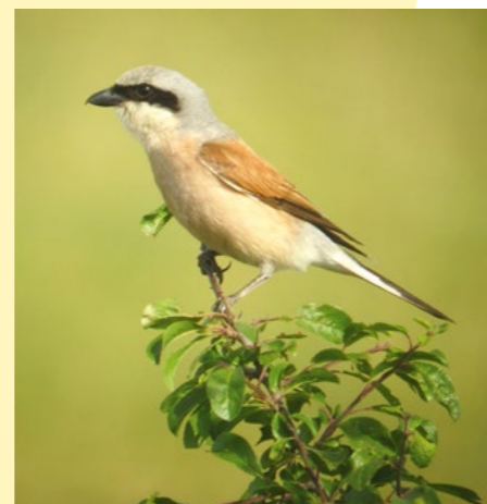
Pie-grièche écorcheur mâle.