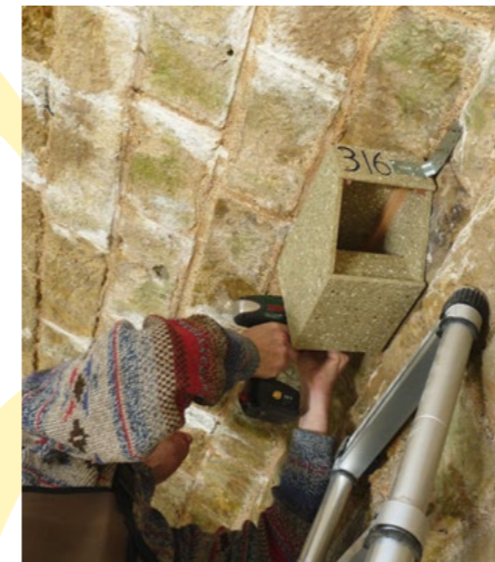
Installation d'un nichoir à bergeronnettes.