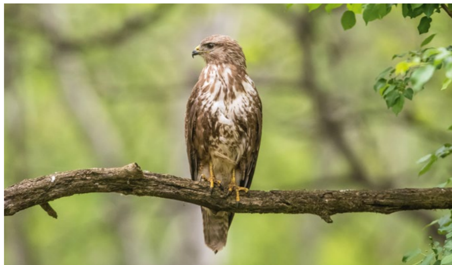
Buse variable.

Cette année, pour la première fois, les cinq carrés tirés au sort ont été prospectés, mobilisant une vingtaine de bénévoles sur les communes de Fontaine-le-Comte, Berthegon, Civray, Chauvigny et Bouresse. Au total, ce sont 25 cantonnements de rapaces (nicheurs probables ou certains) qui ont été dénombés. Une matinée de formation a eu lieu, sous le soleil, le 9 avril à Fontaine-le-Comte, permettant la participation de quelques jeunes ornithologues. Cette sortie collective sera reconduite en 2018, tout comme la réunion de février au