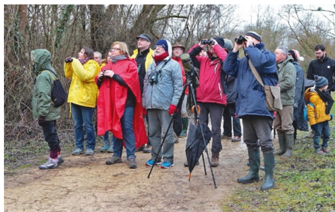
En 2017, malgré le mauvais temps, la Fête des oiseaux a attiré près de 300 personnes.

Cette fête est organisée en collaboration avec Évian, avec l'appui du Parc de Saint-Cyr et d'éthic étapes Archipel, et avec le soutien financier du Conseil départemental de la Vienne, de la Région Nouvelle-Aquitaine et de l'Union Européenne (FEDER).