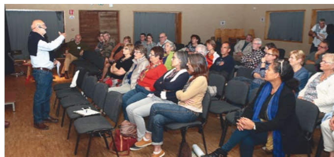
Le lancement officiel des conférences « Agir pour la biodiversité au jardin » a eu lieu vendredi 13 octobre à la Maison de la Gibauderie à Poitiers.

Depuis septembre 2017, dix conférences « Agir pour la biodiversité au jardin », se sont succédé sur le territoire de Grand Poitiers mais aussi dans des lieux plus éloignés comme Bournand (près de Loudun). Nous tenons à remercier les structures qui nous ont accueillis ainsi que les associations co-organisatrices (Cultivons la Bio-Diversité, le GAP de La Puye, le Triton de Vouneuil, Les Amis de la Pallu). Plus de 270 personnes ont été sensibilisées par cette action, ce qui est un bon début ! Pour le moment, une seule conférence est prévue en 2018 : elle aura lieu vendredi 23 février à la salle des fêtes d'Archigny à 20h . Si vous êtes intéressés pour animer cette conférence, n'hésitez pas à nous contacter à viennel@lpo.fr .