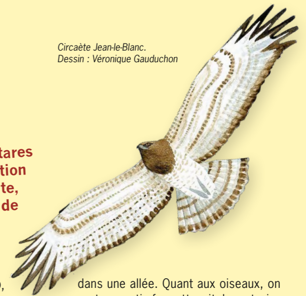
Circaète Jean-le-Blanc. Dessin : Véronique Gauduchon

Jusqu'au XIX e siècle, plusieurs dizaines de milliers d'hectares de brandes couvraient le Poitou, elles ont fait naître la notion paysagère de « terres de brandes ». C'est à leur découverte, au cœur d'un ensemble majeur de 600 hectares, au nord de la forêt de Moulière, que nous partons.