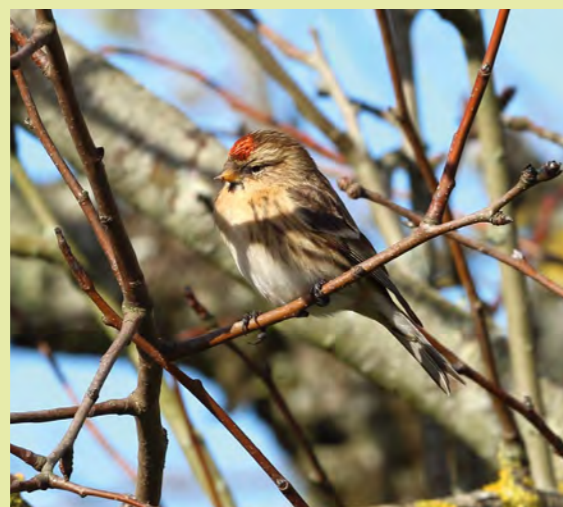
Sizerin cabaret.

Cet hiver, un afflux particulièrement important de sizerins a marqué l'actualité ornithologique en France. À cette occasion, nous avons publié un article sur le site viennne.lpo.fr pour faire le point sur les récentes modifications de statut des deux espèces susceptibles d'être observées chez nous : le sizerin cabaret et le sizerin flammé boréal (beaucoup plus rare). Dans la Vienne, d'importants groupes de sizerins cabarets, au sein desquels se sont glissés quelques sizerins boréaux, ont été observés depuis la mi-décembre. L'essentiel des observations ont été faites dans des bouleaux, dont ces oiseaux affectionnent particulièrement les fruits.