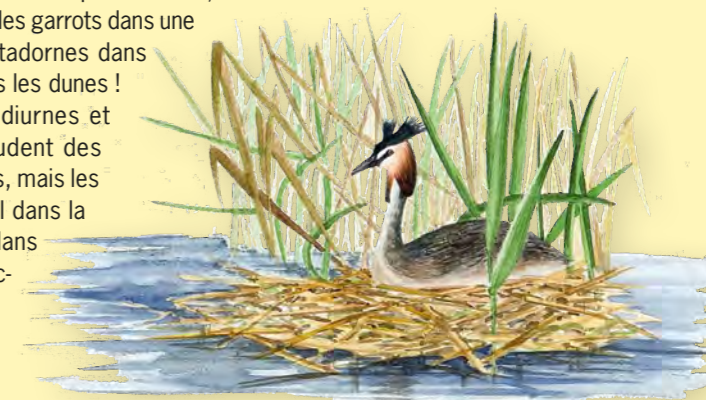
Les grèbes optent pour le nid flottant. Dessin : Véronique Gauduchon