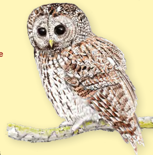
Dessin : Katia Lipovoi

Au cœur de l'hiver, nuit noire et glaciale. Du vallon boisé monte un hululement lancinant, répété au loin en écho. Soudain, des cris stridents transpercent la nuit, et une ombre furtive glisse silencieusement dans les ténèbres vers les appels du mâle. Les vacances de Monsieur Hulotte sont terminées !