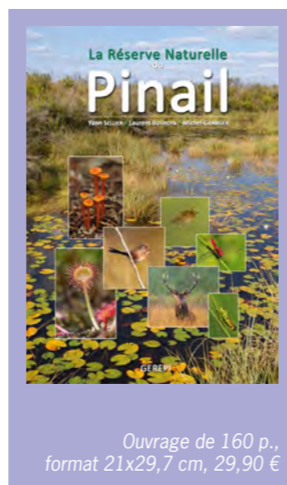
Ouvrage de 160 p., format 21x29,7 cm, 29,90 €

Y. Sellier, L. Bourdin, M. Granger GEREPI Tous les naturalistes poitevins connaissent les brandes du Pinail, au cœur desquelles se niche la réserve naturelle du même nom, au nord de la forêt de Moulière... Sinon ils doivent s'empresser d'aller y promener leurs jumelles. C'est à décrypter avec passion les richesses des 142 hectares (surface actualisée !) de la RNN du Pinail que s'attachent les auteurs de ce livre, magnifiquement illustré. Même ceux qui « connaissent » les lieux ne perdront pas leur temps à sa lecture, et ils y découvriront à coup sûr bien des choses qu'ils ignorent. Avec 2 443 espèces de faune, de flore et de fonge identifiées à ce jour – un inventaire toujours en