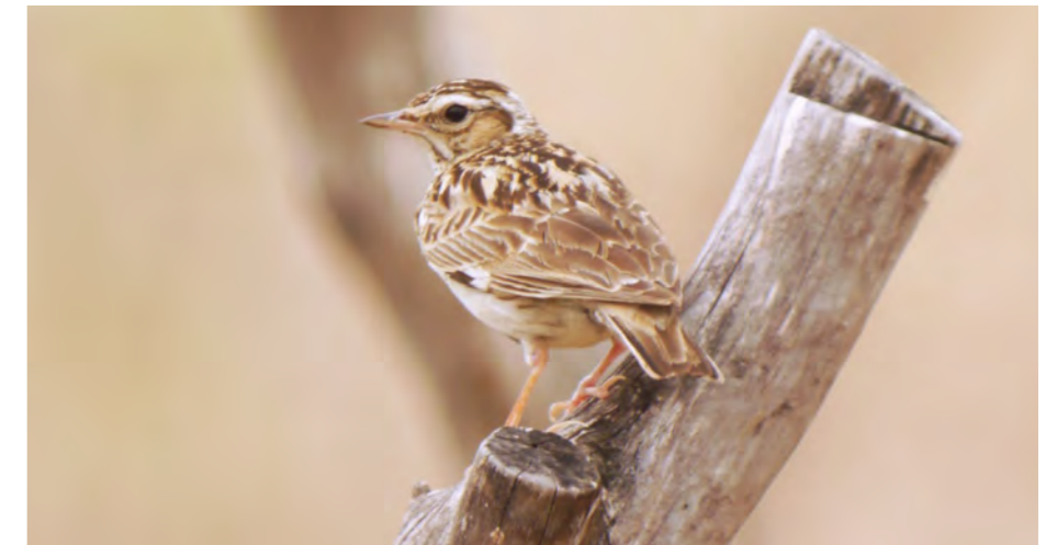
Il n'est pas rare d'apercevoir l'alouette lulu dans les vignes.

Par ailleurs, nous recherchons une personne pour s'occuper de la bibliothèque . Le travail est simple et demande peu d'engagement : il s'agit de couvrir les nouveaux ouvrages et de les enregistrer sur un fichier informatique, mais aussi d'examiner ponctuellement les emprunts en cours pour éviter les pertes d'ouvrages, et de s'assurer que les rayons restent rangés. Bien qu'il y ait peu de travail sur ordinateur, l'idéal est de ne pas être effrayé par l'informatique.