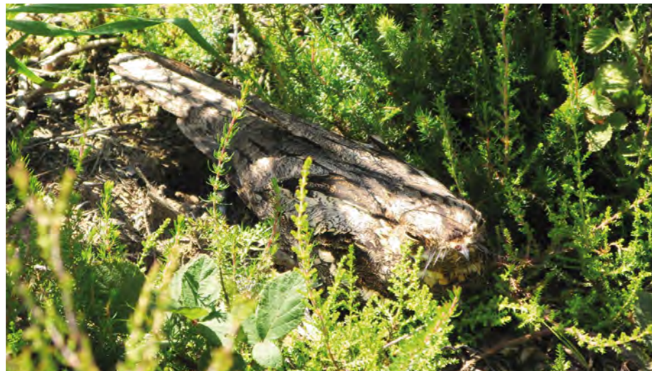
Quand il dort durant le jour, l'engoulevent d'Europe est quasi indétectable.

Enfin, trois nouvelles enquêtes vous attendent : - Oiseaux des carrières : prospection des carrières du département à la recherche d'espèces emblématiques comme le guépier d'Europe et l'hirondelle de rivage.