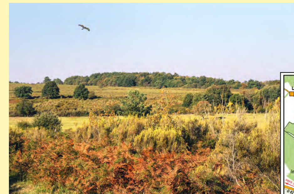
Les brandes de la Gassotte.

Accès : suivre l'itinéraire d'accès à la réserve naturelle du Pinail et stationner sur le parking. Balade : 5,5 km, sans difficultés particulières, hormis la présence potentielle de flaques d'eau et/ou d'ornières humides. Préférez le matin ou la fin d'après-midi.