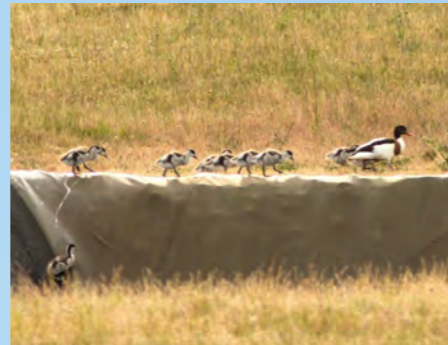
Dans la Vienne, les rares cas de reproduction du tadorne de Belon ont tous été observés sur des stations de lagunage.

Eaux de Vienne souhaite mieux connaître les espèces présentes sur les sites et être conseillé pour mettre en place une gestion plus écologique. Pour cela, quatre sites de typologies différentes ont été sélectionnés : la station d'eau potable des Jolines à Archigny, la station de lagunage de Champigny-en-Rochereau, la station d'alimentation en eau potable de Massognes et la station de filtre à roseaux de L'Isle-Jourdain. Une visite de terrain a été organisée sur chacun, en présence du responsable et parfois d'élus, afin de parler fonctionnement, modalités actuelles de gestion et possibilités de nouveaux aménagements. La station de L'Isle-Jourdain a également fait l'objet de plusieurs prospections par Éric Jeamet et Sébastien Baillargeat, deux bénévoles locaux. Ils ont observé 45 espèces d'oiseaux, dont la rousserole effarvate dans les roselières de la station ou le pouillot siffler dans le boisement qui jouxte le site. À l'issue des visites, une notice de gestion a été rédigée puis chaque mesure a été discutée. La pose de nichoirs et la mise en place d'une gestion différenciée des surfaces enherbées ont été acceptées tandis que les plantations de haies arbustives ont été refusées par crainte d'augmenter les coûts de gestion.