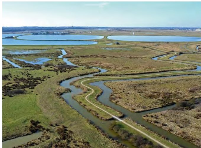
Vue de la station de lagunage et des marais périurbains de Rochefort.

Vous souhaitez participer à ce moment important de la vie de votre association ? Inscrivez-vous sur https://goo.gl/WLWsoq ou par téléphone au 05 49 88 55 22. ■