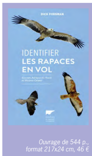
Ouvrage de 544 p., format 21x24 cm, 46 €

D. Forsman Delachaux et Niestlé Excellente initiative que cette traduction en français, par Marc Duquet, de cet ouvrage essentiel à la connaissance des rapaces. Titre oblige, il est exclusivement consacré à l'identification de ces oiseaux dans le contexte le plus fréquent de leur observation, le vol. Si c'est un véritable guide, ce n'est cependant pas un format « poche » eu égard à sa taille et à son poids, éléments qui a contrario l'autorisent à offrir une masse considérable d'informations. Soixante espèces fréquentant l'Europe, l'Afrique du Nord et le Moyen-Orient y sont présentées à travers quelque 1 100 photographies, qui montrent notamment les différents plumages de