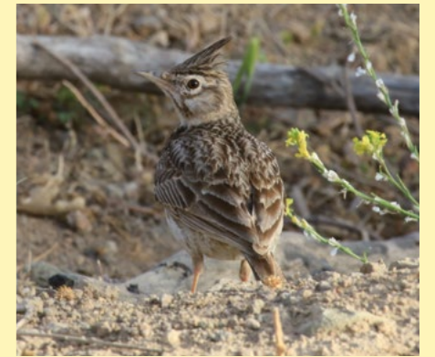
Cochevis huppé.

À dix kilomètres à l'est de Poitiers et au sud immédiat des 4 000 hectares de la forêt domaniale de Moulière, partons autour du village à la rencontre de la nature et des oiseaux qui trouvent là des milieux qui leur sont favorables.