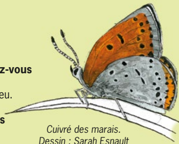
Cuvrè des marais. Dessin : Sarah Esnault

À 6 km au sud-est de Montmorillon : par la D117, prendre à droite vers La Pierre Soupèze, ou par la D54, prendre à gauche vers Sainte-Marie.