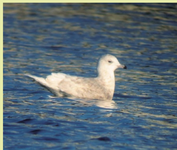
Texte : Thomas Chevalier.

Ce jeudi 2 février, c'est une bien belle découverte que Johan Tillet a faite : à 16h20, un goéland à ailes blanches était posé sur la partie nord du plan d'eau de Saint-Cyr, en train de lisser son plumage. Plus tard, il est venu se poser à proximité de la plage et il a vraisemblablement passé la nuit sur le site. Il s'agit de la toute première mention de l'espèce pour le département de la Vienne. En hiver, cet oiseau marin originaire du Nord se rapproche des côtes et peut-être observé occasionnellement dans le nord de la Bretagne, dans les ports de pêche, mais rarement à l'intérieur des terres.