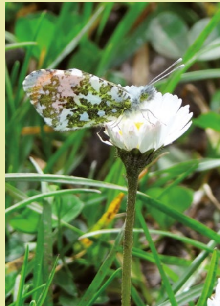
L'aurore est l'une des 17 espèces de papillons de référence pour étudier la biodiversité de la haie. Elle a été observée sur 6 % des haies. Plus une haie est volumineuse et ancienne, plus elle abrite de biodiversité.

*Vienne Nature, Groupe Ornithologique des Deux-Sèvres, Deux-Sèvres Nature Environnement, Nature Environnement 17, Charente Nature, Poitou-Charentes Nature, LPO Charente-Maritime.