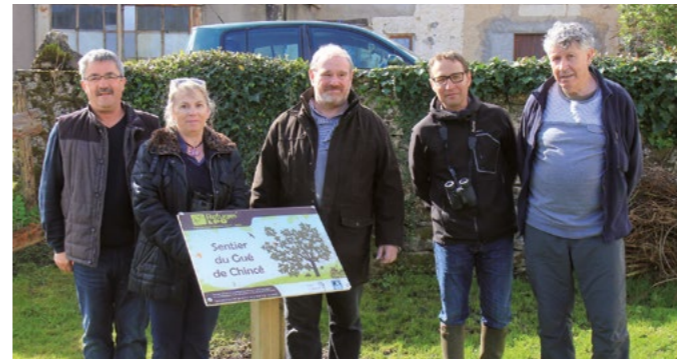
Le refuge LPO de Celle-l'Évescault a été inauguré à la fin de la balade du matin.

La LPO Vienne a tenu son assemblée générale le 1 er avril, à Celle-l'Évescault où elle a accompagné la commune pour la création d'un refuge LPO.