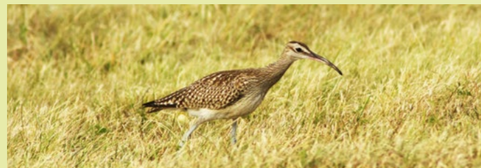
Courlis corlieu.