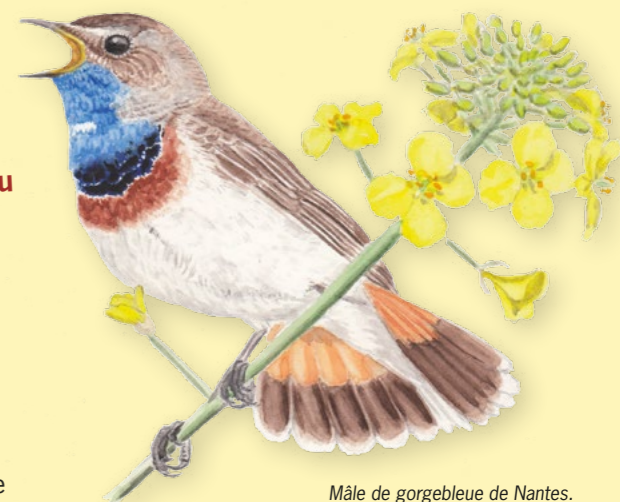
Mâle de gorgebleue de Nantes. Dessin : Katia Lipovoi

Bien campé sur ses longues pattes au sommet d'une fine tige de colza, balancé par la légère brise d'une belle journée de printemps, un petit oiseau au plastron d'un bleu éclatant lance ses trilles mélodieux. Une occasion rare d'admirer ce magnifique oiseau.