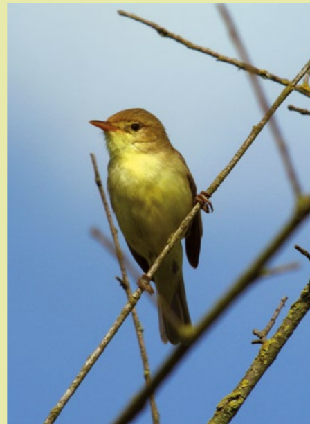
L'hypolaïs polyglotte est une migratrice. Elle construit son nid au cœur d'une haie, mais se perche bien en vue pour chanter.

En revanche, le nombre d'espèces d'oiseaux, mais aussi de papillons et de chauves-souris qui fréquentent une haie apparaît lié à l'âge de la haie et à sa typologie. En effet, la diversité est plus grande dans les haies de plus de quinze ans et dans celles constituées de plusieurs niveaux, avec strate arbustive et strate arborée. Cela tient certainement au fait que les haies en vieillissant, et dans la mesure où elles sont entretenues de manière douce (et non coupées au carré), développent des micro-habitats de toutes sortes, ce qui n'est évidemment pas le cas des jeunes haies. Cette constatation prouve qu'une haie arrachée, ce n'est pas simplement un linéaire de végétaux qui disparaît, mais tout un micro-univers qui est bouleversé, et la plantation de jeunes arbres ou arbustes ne peut compenser la destruction d'une haie ancienne : il faut attendre de nombreuses années pour qu'une haie nouvelle offre des conditions de vie équivalentes.