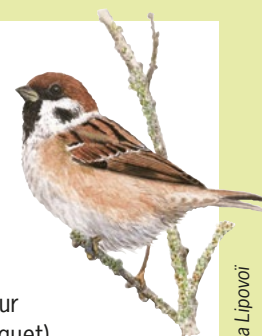
Moineau friquet. Dessin : Katia Lipovoi

N'oubliez pas votre pique-nique si vous souhaitez rester après la remise du trophée aux gagnants ! En cas de mauvais temps, le rendez-vous sera reporté au lendemain dimanche 7 mai.