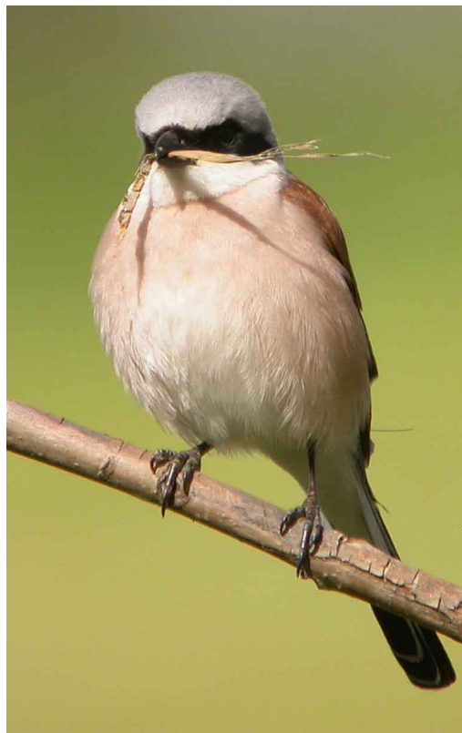
Pie-grièche écorcheur (J Bisetti)

Ce compte-rendu, accompagné de photos, est disponible sur le site Internet de la LPO Haute-Savoie : http://haute-savoie.lpo.fr rubrique « Vie associative »/« comptes-rendus »