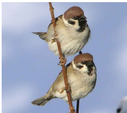
Moineau friquet (J Bisetti)