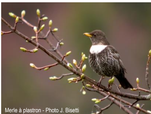
Merle à plastron