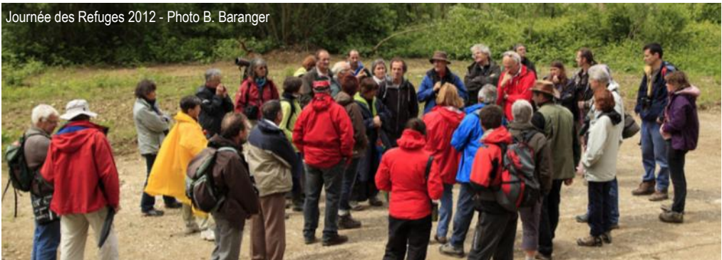
Journée des Refuges 2012 - Photo B. Baranger

Renseignements auprès de Didier Besson au 06 08 33 41 75 ou didier.besson@neuf.fr