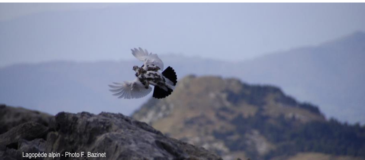
Lagopède alpin

Renseignements et inscriptions auprès de Thierry Vibert-Vichet au 07 87 21 15 04 ou vib-val@aliceadsl.fr ou à la LPO 74 au 04 50 27 17 74