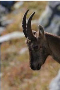
Bouquetin des Alpes

Réunion d'échanges de la LPO Haute-Savoie suivie d'un temps de présentation des événements passés et à venir concernant l'abattage des bouquetins du Bargy.