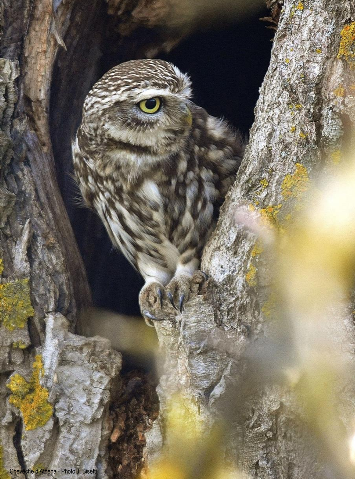
Cheveche d'Athens