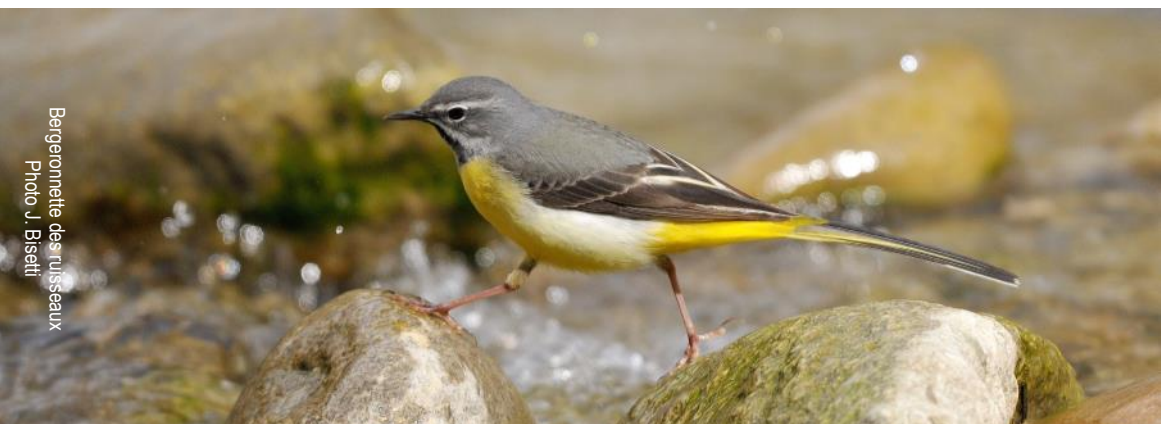
Belgenonnette des ruisseaux