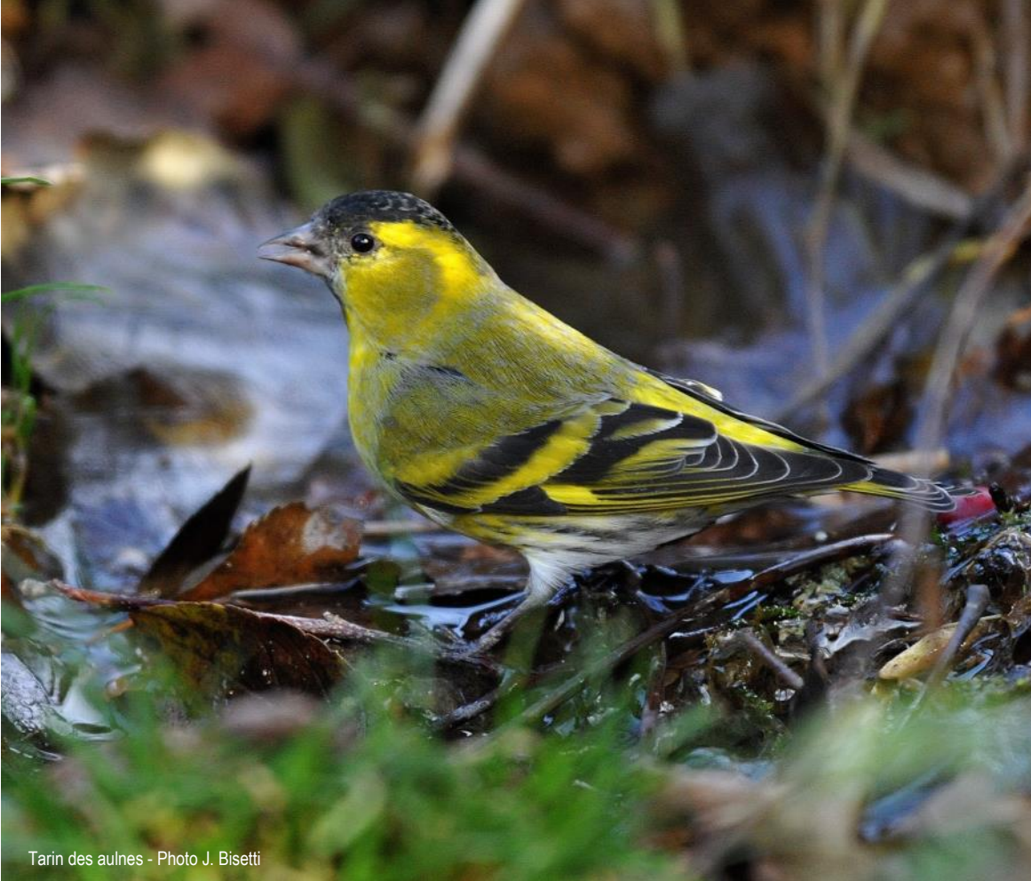
Tarin des aulnes