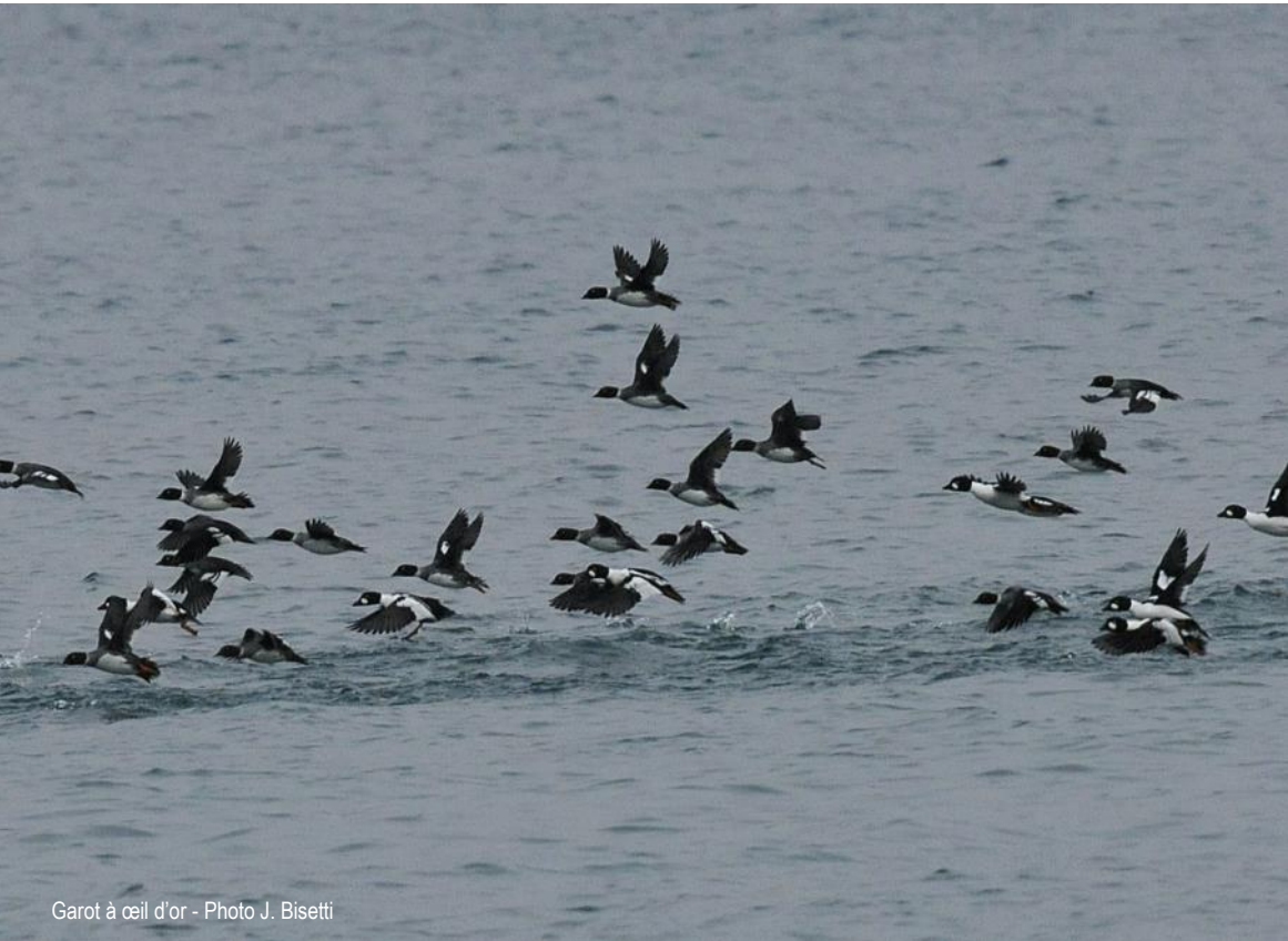
Garot à œil d'or