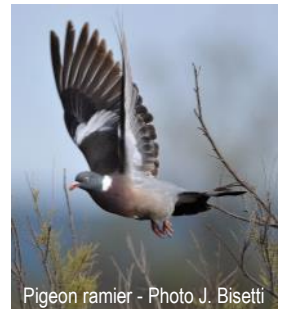
Pigeon ramier

Renseignements à la LPO 74 au 04 50 27 17 74 ou haute-savoie@lpo.fr