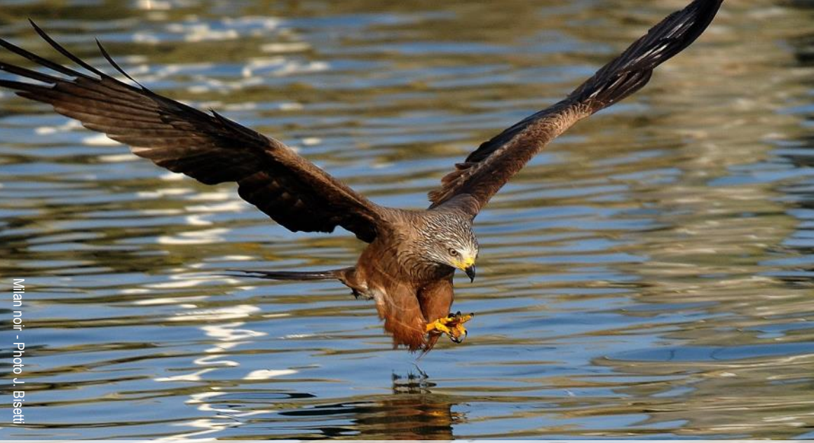
Milan noir - Photo J. Gisetti