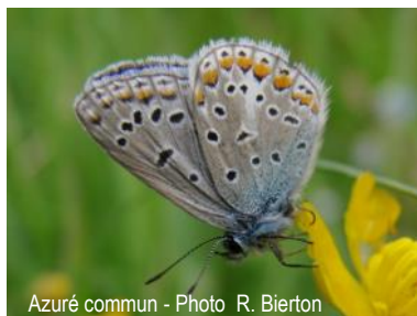
Azuré commun