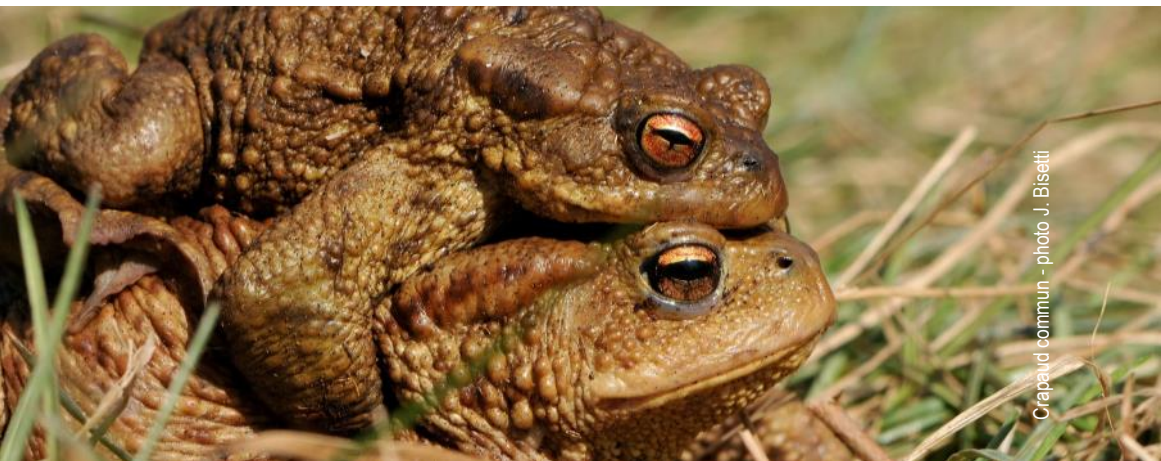
Crapaud commun

Renseignements auprès de la LPO au 04.50.27.17.74. ou haute-savoie@lpo.fr