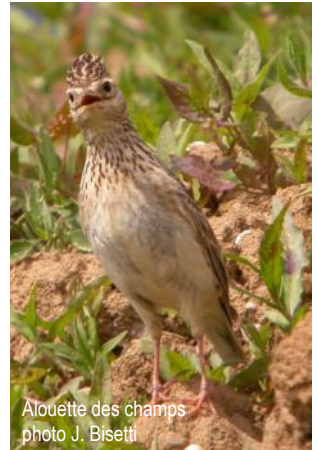
Alouette des champs

Prévoir casse-croûte, matériel optique et vêtements adaptés pour une journée d'observation.