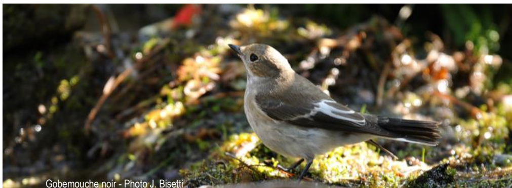
Gobemouche noir - Photo J. Bisetti