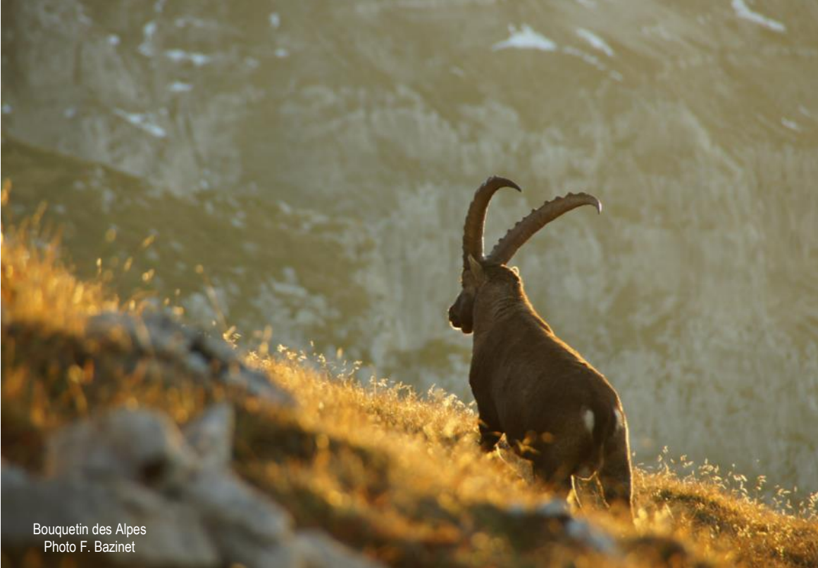
Bouquetin des Alpes