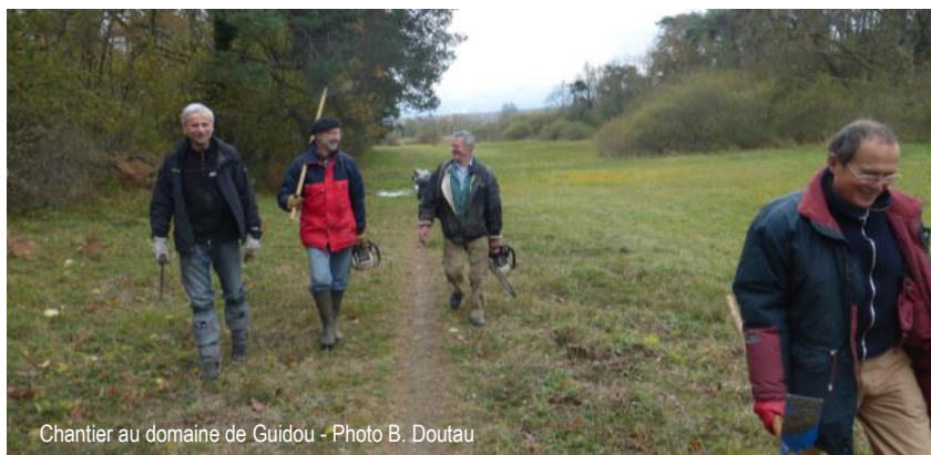
Chantier au domaine de Guidou