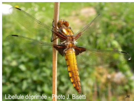
Libellule déprimée