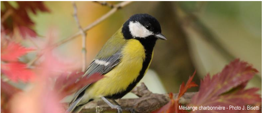
Mésange charbonnière