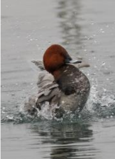
Fuligule milouin

Comme chaque année, nous vous proposons de participer au comptage des oiseaux d'eau hivernant sur les grands lacs alpins. Quelles que soient vos connaissances en ornithologie, venez prêter main forte aux ornithologues !