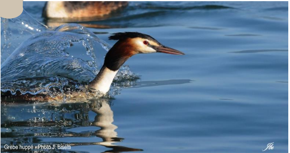
Grèbe huppé

Renseignements auprès de Louis Rose 04 50 46 90 89 ou louis.rose@sfr.fr