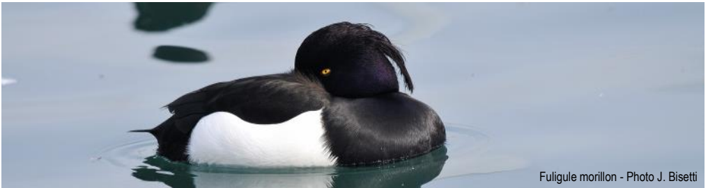
Fuligule morillon

Dimanche 12 janvier au Lac d'Annecy : RDV à 8 h, parking des Marquisats Renseignements et inscriptions auprès de Louis Rose au 04 50 46 90 89 ou louis.rose@sfr.fr