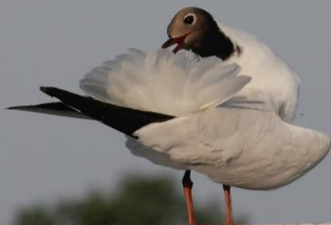
Mouette rieuse