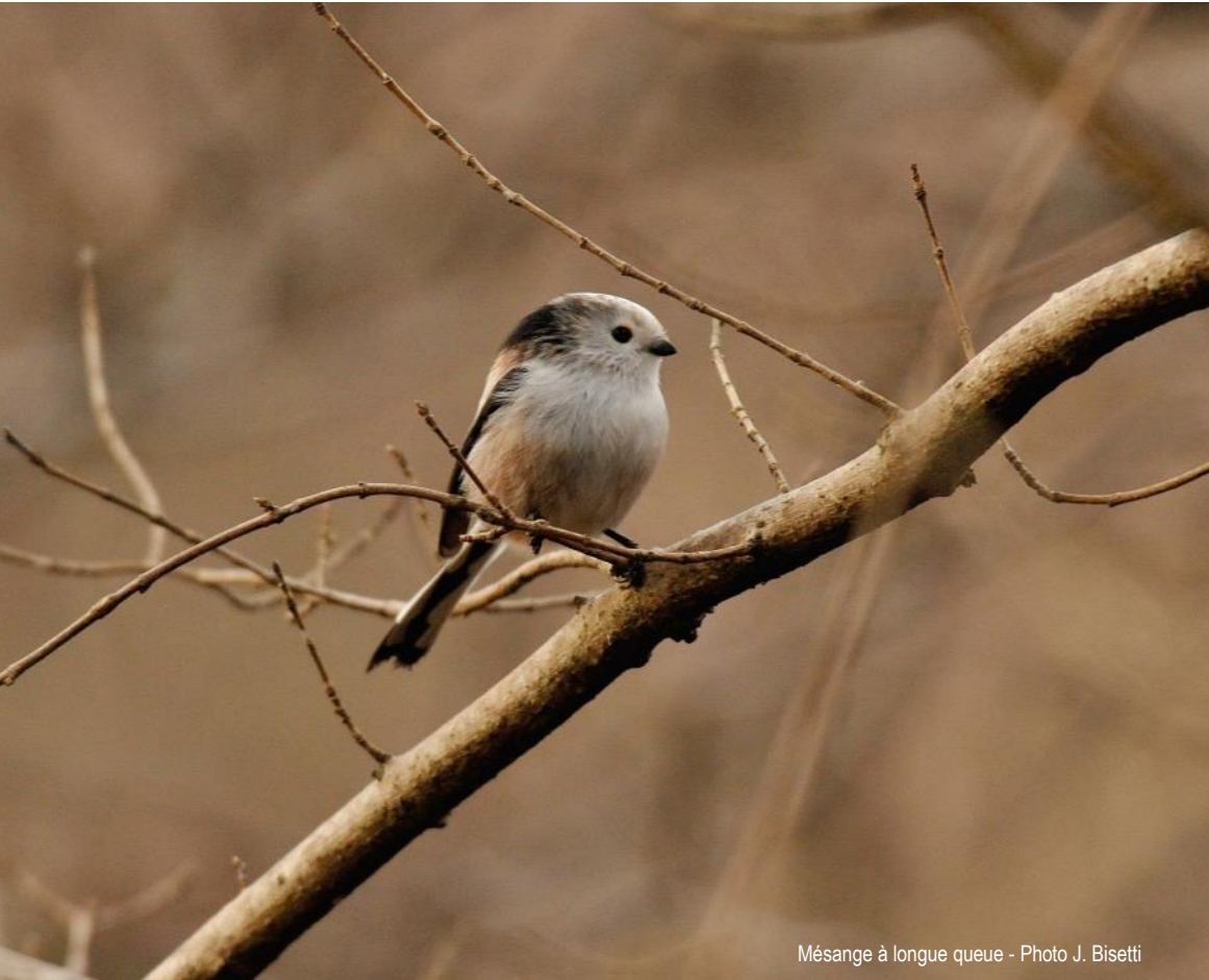
Mésange à longue queue