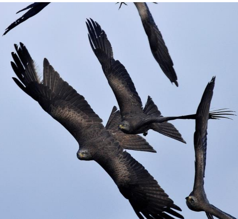
Jbi Milan noir