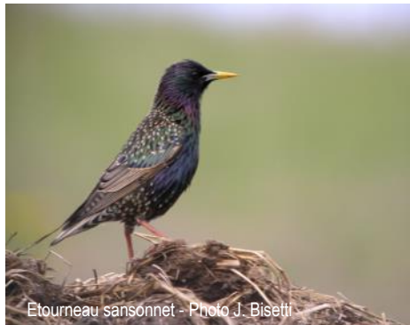
Etourneau sansonnet

Venez retrouver la LPO Haute-Savoie, ainsi que de nombreux exposants (pépiniéristes, artisans et producteurs) qui vous feront découvrir leurs productions sur le marché aux plantes et aux saveurs. Expositions, conférences, ateliers enfants, rencontres nature et environnement vous attendent au cours de ces deux journées.