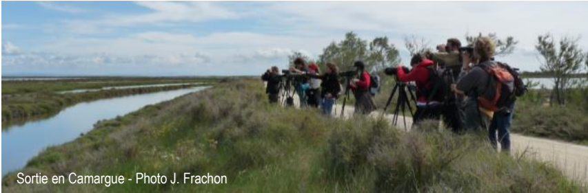
Sortie en Camargue

Renseignements et réservations à la LPO 74 au 04 50 27 17 74 ou haute-savoie@lpo.fr