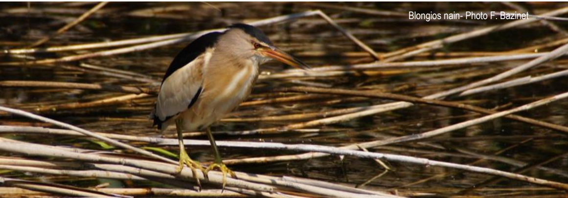
Blongios nain

Renseignements et inscriptions à la LPO 74 au 04 50 27 17 74 ou haute-savoie@lpo.fr