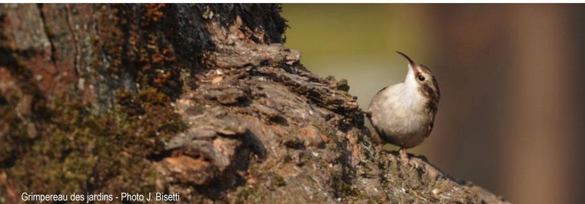
Grimpereau des jardins - Photo J. Bisetti

Renseignements et inscriptions auprès de Jean-Jacques Beley au 04 50 70 80 45 ou jjbeley@sfr.fr