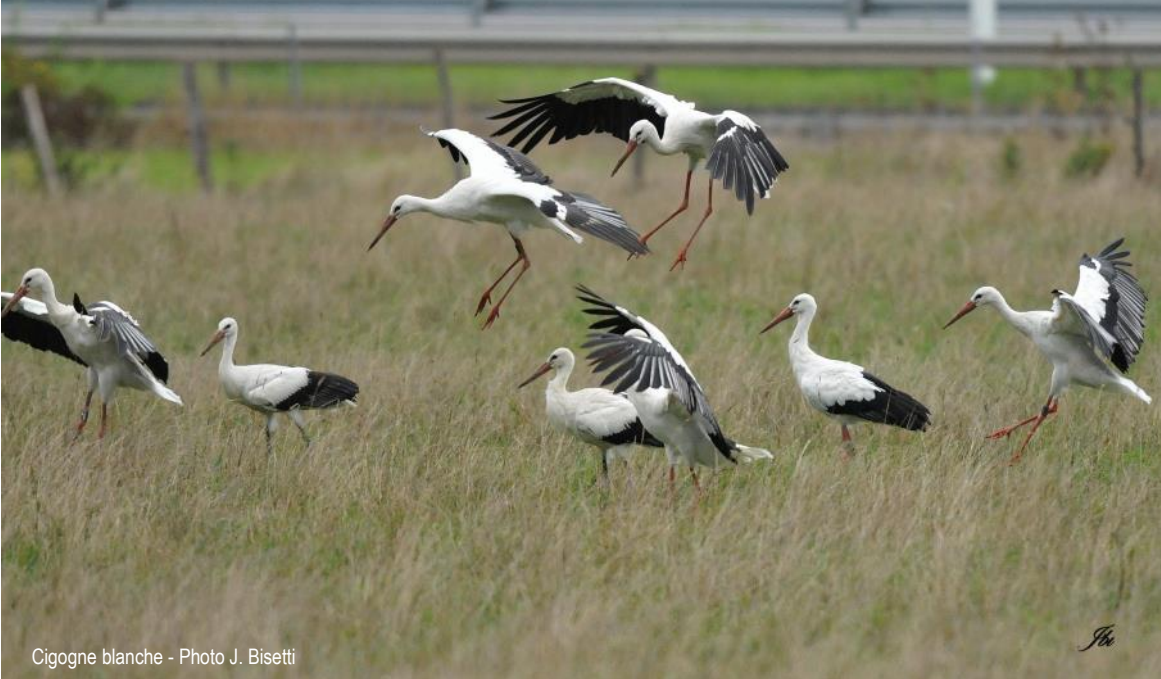
Cigogne blanche