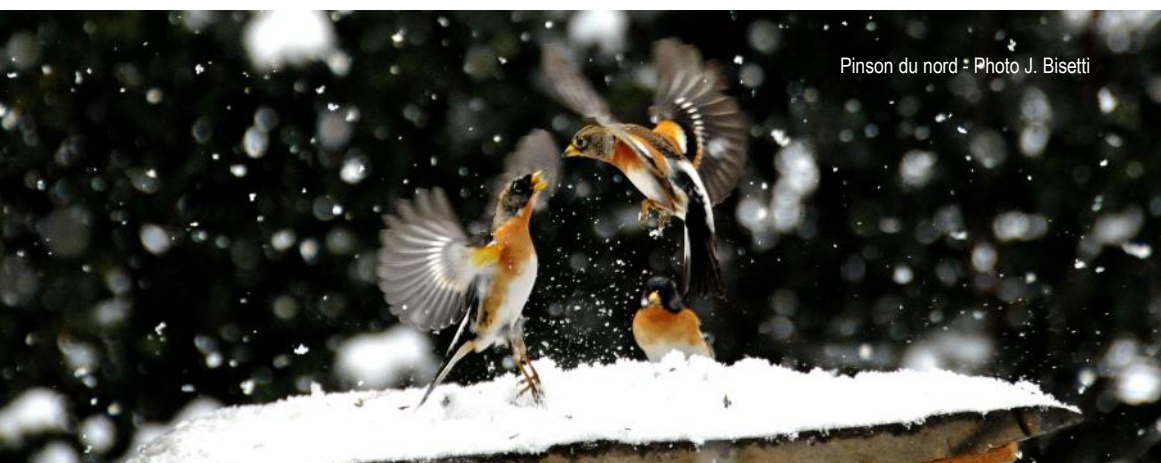
Pinson du nord